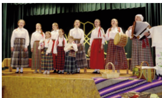
Foto: Kad cilvēks dzied no sirds, viņu apņēm likums, možums, labs prāts, mīlestības un gaišuma sajūta. Dziesma dziedina.

Ņukšu Tautas nama bērnu folkloras kopa „Rīkšoveņa” 26. novembrī svinēja savas darbības 5 gadu jubileju. Kolektīvs dibināts 2011. gada 20. novembrī. Visus šos pastāvīšanas gadus kopas dalībnieces ir priecējušas sava pagasta ļaudis, gan arī iesaistījušas bērnu un jauniešu festivāla „Pulkā eimu, pulkā teku” ietvaros un ir pabijušas Gaigalavā, Jēkabpilī, Viesītē, Dricānos, Rogovkā, Ludzā, Rīgā un Saldū.