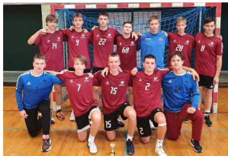
U17 handbolisti sacensībās Igaunijā.

lēs bija viduvējs, noteikti, ka varam spēlēt labāk. Tomēr, šis ir pārbaudes turnīrs. Galvenais, saprast savas kļūdas un spēt rast risināju-