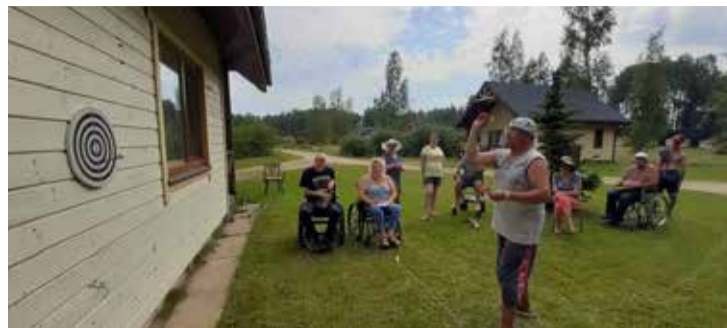
Nometnes dalībnieki piedalās sporta aktivitātēs.