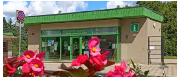
Salaspils novada tūrisma un informācijas centrs.

Jūlija sākumā Daugavas muzeja parkā notika Tirgus Doles muižā. Lai gan laiks bija tveicīgs, skaistajā