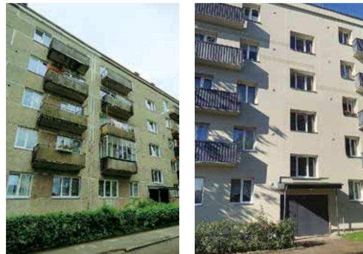
Pirms un pēc renovācijas nams Skolas ielā 7/2.

Pamatojoties uz SIA "Tilderu nami" pieteikumu pašvaldības līdzfinansējuma saņemšanai dzīvojamās mājas Skolas ielā 7/2, Salaspilī energoefektivitātes paaugstināšanas pasākumu veikšanai, pašvaldība piešķirusi finansējumu 30 000 eiro apmērā.