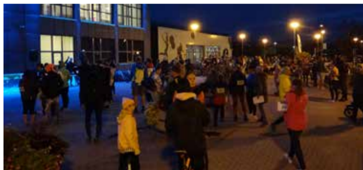
Latvijas orientēšanās nakts Salaspilī dalībnieki.

Eiropas sporta nedēļas ietvaros Latvijas Orientēšanās federācija visiem aktīvās atpūtas interesentiem bija sarūpējusi neaizmirstamu un aizraujošu piedzīvojumu - Latvijas orientēšanās nakti, kas norisinājās 23. septembrī un vienlaicīgi 20 Latvijas pilsētās, tostarp arī Salaspilī.