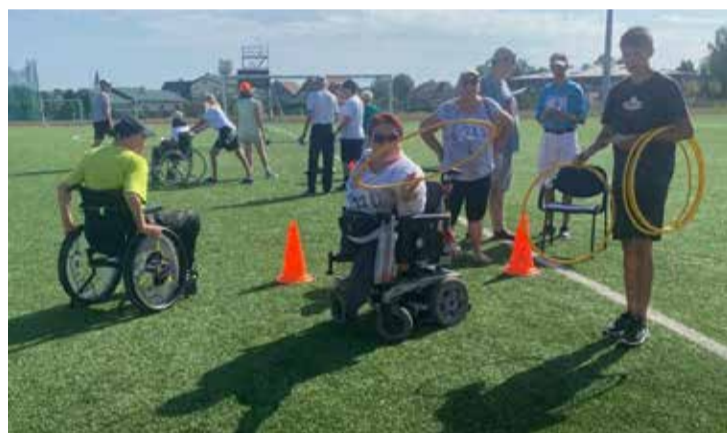
Sporta svētku dalībnieki.

Turpinot tradīcijas, uz tikšanos nākamgad!