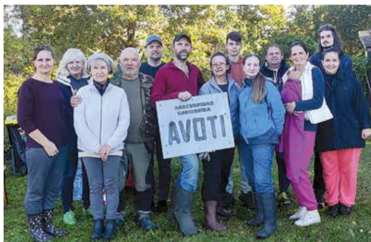
Talka DKS "Avoti".

24. septembrī "Avotos" tika veikti teritorijas sakārtošanas darbi, izzāģējot krūmus, apzāģējot koku zarus un izplūaujot garo zāli vietā, kur plānots ierīkot bērnu rotaļu laukumu. Sabiedrības "Avoti" valdes