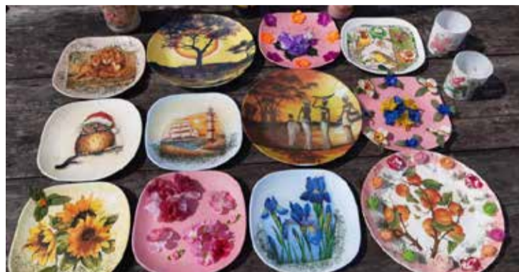
Nometnes dalībnieku veidotie šķīvji dekupāžas tehnikā.