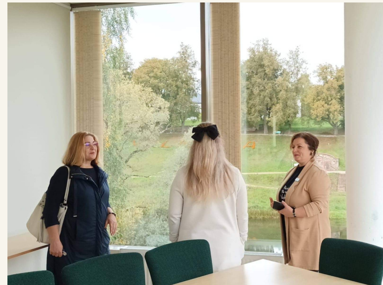
Viesošanās Valmieras integrētajā bibliotēkā.

Pieredzes apmaiņas braucieni uz citām bibliotēkām