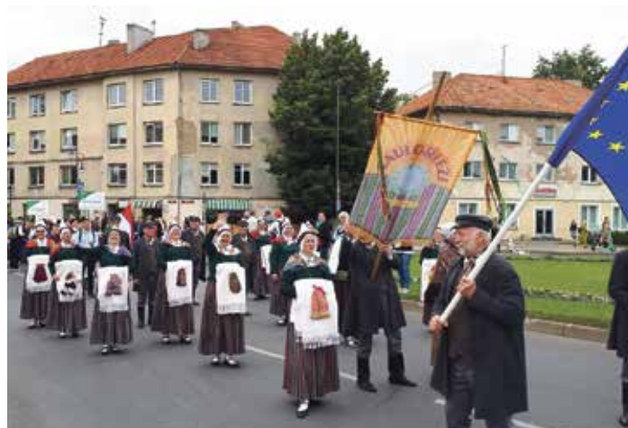
Saulkrastu senioru deju kolektīvs „Saulgrieži” gatavi 57. Eiropiādes svētku gājienam.

Šis festivāls kopš 1964. gada notiek dažādās Eiropas valstīs. „Saulgrieži” 2019. gadā dejoja arī