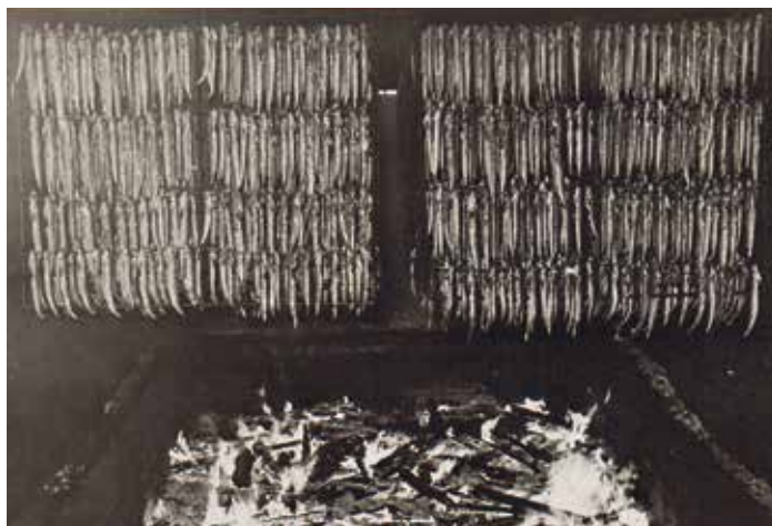
Zivju žāvēšana uz irbiem kūpinātavā 70. gados.

jas ražas pārstrādāšanu un celtu zvejnieku labklājību”.