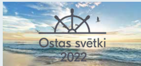
Kultūras notikumi augustā un septembrī