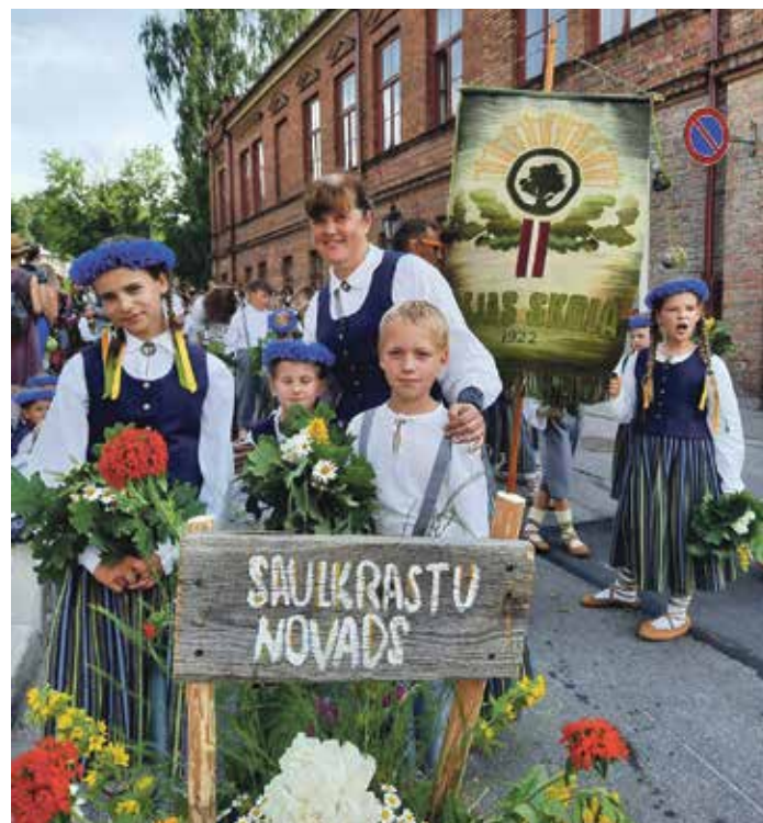
Sējas pamatskolas 1.–4. klašu deju kolektīvs „Ozolēni” jūlijā pārstāvēja Saulkrastu novada Limbažos bērnu tautas deju festivālā „Latvju bērni danci veda”.

MĀKSLĀ: 7. septembrī pl. 18.00-19.30 Saulkrastos, Raina ielā 8 (Domes ēkā, ieeja no pagalma puses); 8. septembrī pl. 18.00-19.30 Zvejniekiemā, Atpūtas ielā 1b (kultūras nama ēkā, 4.stāvs).