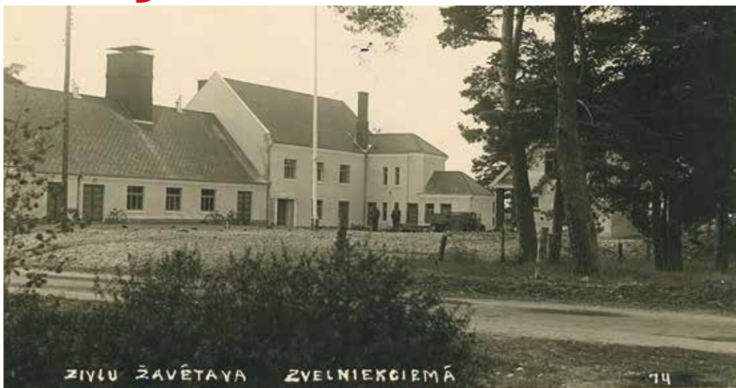
Zvejnieciema zivju kopžāvētava un pārstrādes darbnīca, 1939. gads.

Straujā zvejniecības attīstība rosināja valdību atbalstīt vietējos zvejniekus: tika pieņemts lēmums par jaunās ostas būvi, zivju kopžāvētavas un pārstrādes darbnīcas būvniecību, „lai sekmētu jūras zve-