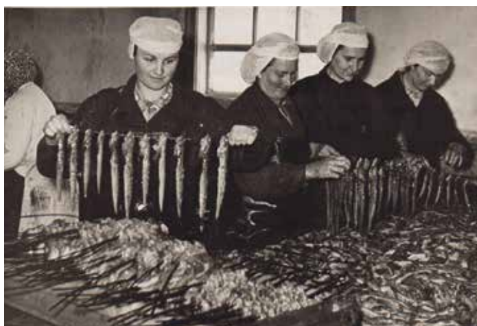
Zivju vēvējas Skultes zivju fabrikā 70. gados.