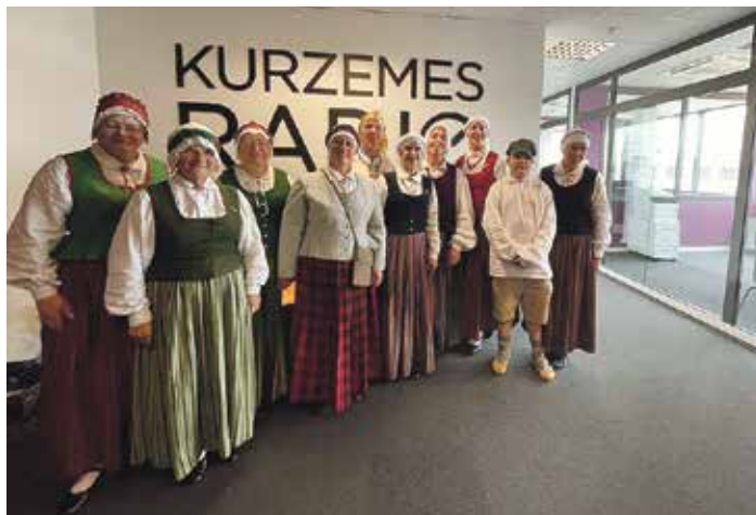
Starptautiskajā folkloras festivālā „Baltica” mūsu folkloras kopa „Dvīga” sniedza arī interviju Kurzemes Radio.

Lai arī man ir plaša pieredze, uzstāšanās daudzviet pasaulē, tādā zālē – ar izcilu tehnisko aparatūru un profesionālo komandu – biju pirmo reizi. Piepildīt šo zāli ar savu