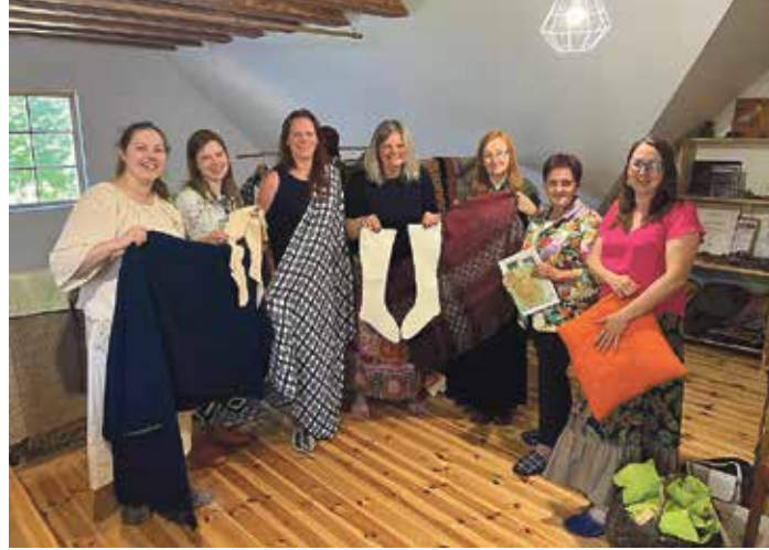
Audēju kopa „Kodaļa” projekta laikā apgūtās aušanas prasmes izmantoja jaunu un skaistu mākslas darbu darināšanā.

iepriekšējā Eiropiādē Frankenberģā, Vācijā, kur radās vēlme doties uz nākamo festivālu Klaipēdā. Diemžēl divus gadus festivālā mūsu kolektīvs piedalījās virtuāli. Šogad beidzot šo brīnišķīgo notikumu piedzīvojām klātienē.