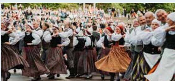
Iespaidīgs mēnesis Saulkrastu amatiermākslas kolektīviem