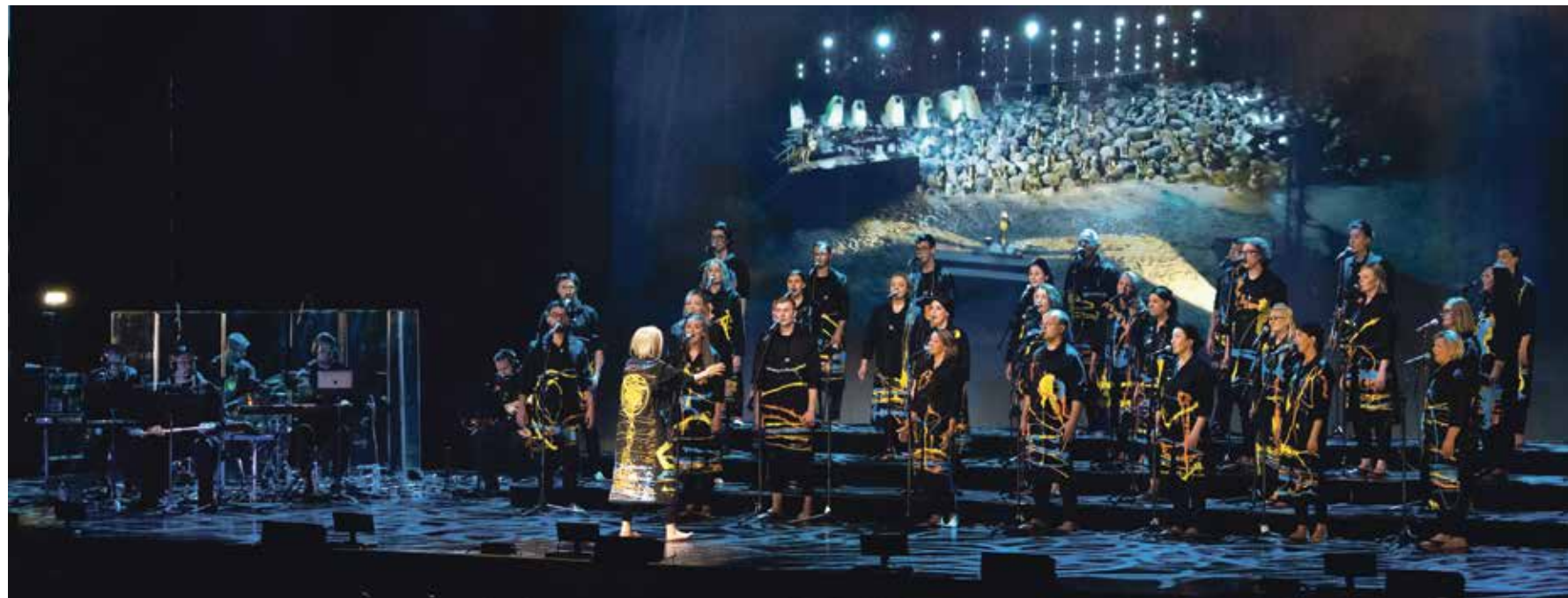
Saulkrastu koris ANIMA izvedies uz ASV pārnest Saulkrastu pludmali ar panākumus guvušo koncertuzvedumu „Krustā savijņots”.

Jūlijs Saulkrastu kultūras centra amatiermākslas kolektīviem bijis ne mazāk aktīvs kā Saulkrastu kultūras dzīve tepat, uz vietas. Kolektīvi piedalījās gan dažādos festivālos Latvijā, gan devās tālākos ceļos, lai nestu Latvijas karogu un godam pārstāvētu Saulkrastu novadu starptautiskos notikumos pat otrpus okeānam.