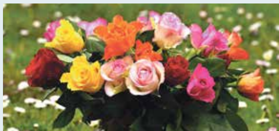
Par Zinību dienu Saulkrastu novada skolās