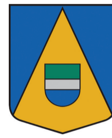
Kolka pagasta ģerboņis