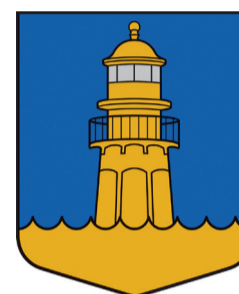
Mērsraga pagasta ģerboņis