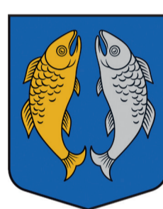
Rojas pagasta ģerboņis

robežās nemainītu to vizuālo noformējumu, bet ietvertu sasaisti ar reģistrētajiem pagastu ģerboņiem.