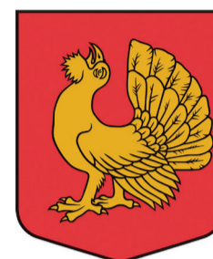
Dundagas pagasta ģerboņis

Patlaban tiek precizēts jautājums par šo pagastu karogiem, lai iespēju