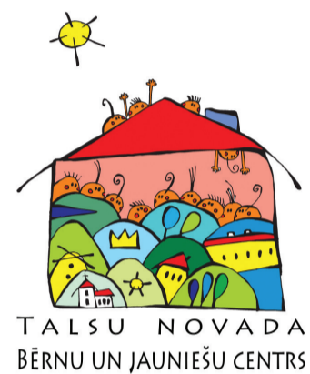
TALSU NOVADA BĒRNU UN JAUNIEŠU CENTRS

Šosezon Tehniskās jaunrades nodarbībās ir iespēja iestāties lidmašīnas pilota ādā un ar avio simulatoru izmēģināt, kā vadīt īstu lidmašīnu. Līdztekus ir jauna programma mūzikā, saistošas nodarbības angļu valodas apguvē, iespējams darboties visa veida deju, galda tenisa, orientēšanās sporta, disku golfa, vēstures un mākslas nodarbībās. TNBJC ir arī vieta, kur pavadīt brīvo laiku pēc skolas vai gaidot autobusu, spēlēt dažādas galda spēles, satikties ar