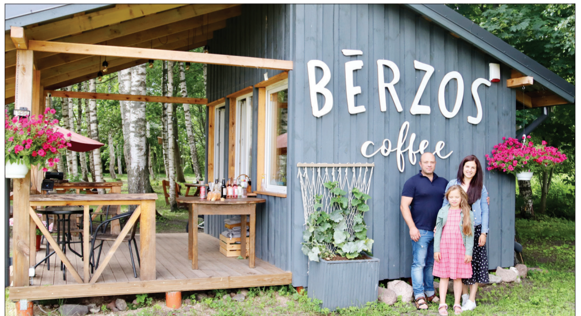
Kafejnīca Užavā būs atvērta visu augustu, bet septembrī, visticamāk, nedēļas nogalēs. Ir iecere rīkot tematiskus pasākumus, piemēram, kino vakaru.