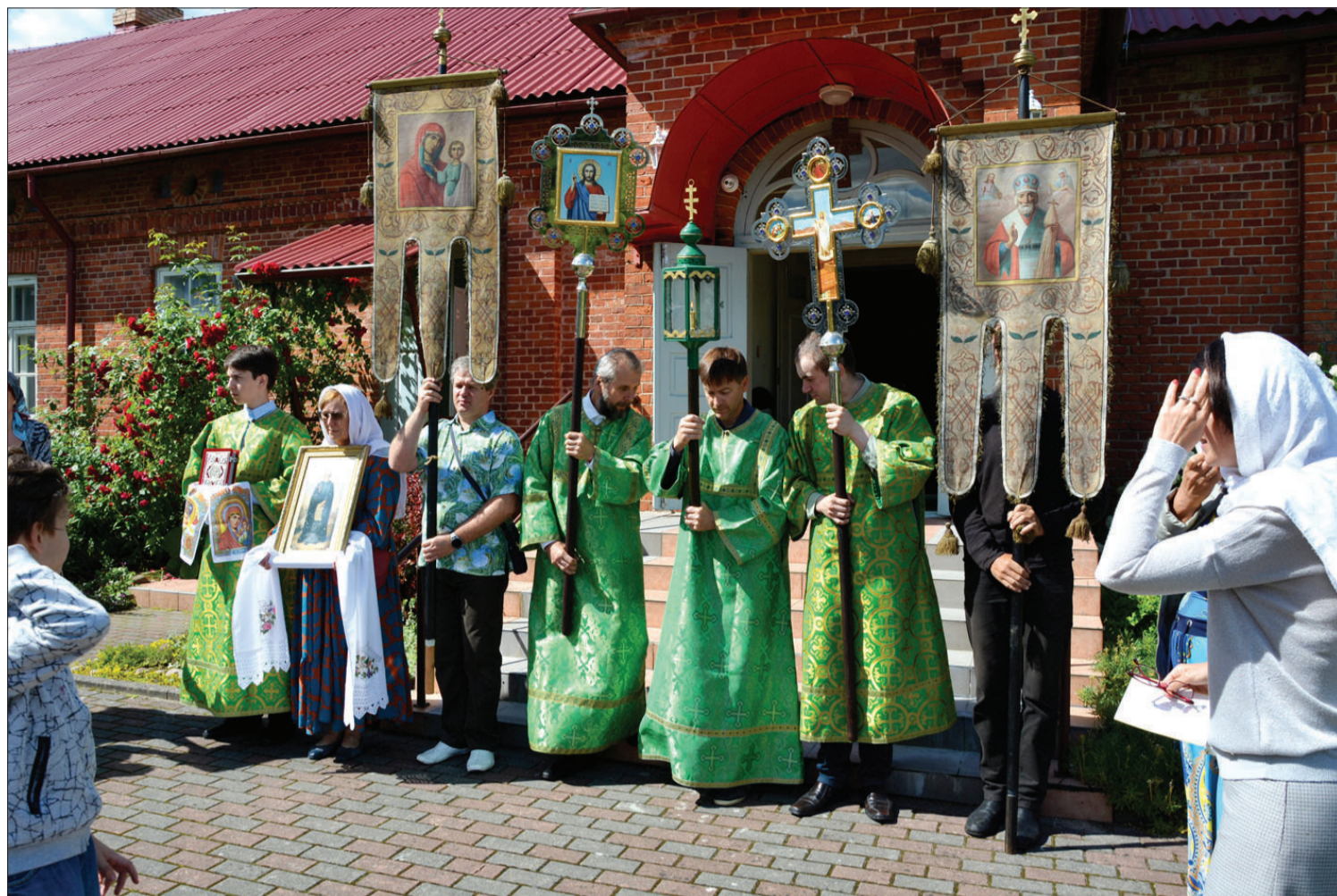
Gatavošanās svētku gājenam gar Radonežas Sergija pareizticīgo baznīcu.