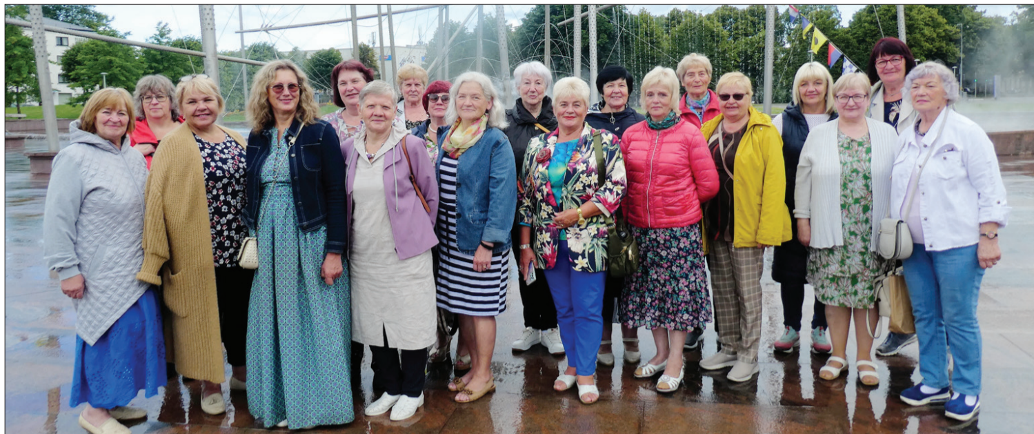
Biedrības "Spārni" dāmas ar savām viešņām Ventspilī.