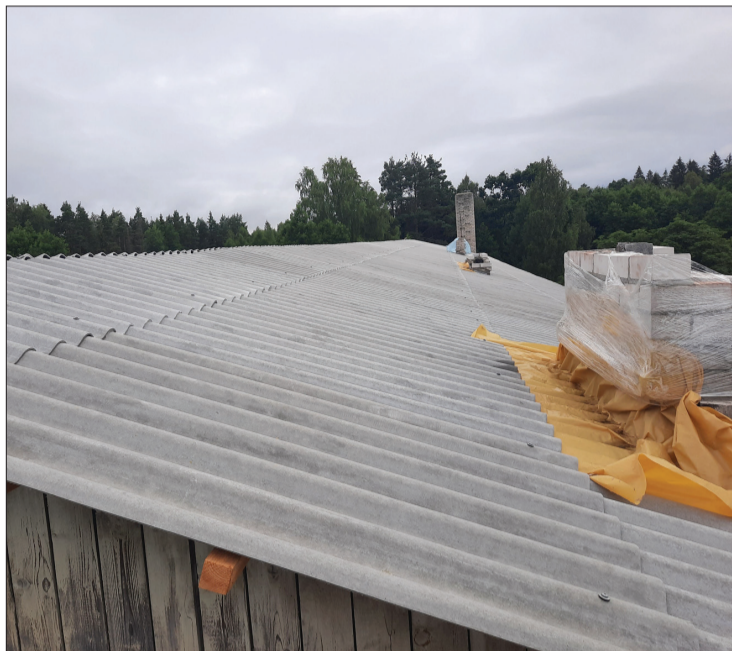
Daudzdzīvokļu mājā “Kraatos” notiek visa jumta seguma nomaiņa.

Ventspils novada Stiklu ciemā kopš jūlija sākuma aktīvi norisinās daudzdzīvokļu nama “Kraatos” jumta renovācijas darbi par kopējo summu 42 242,86 eiro bez PVN, kurus veic būvniecības uzņēmums SIA “KORP”, kas uzvarēja izsludinātajā iepirkuma konkursā, piedāvājot zemāko cenu.