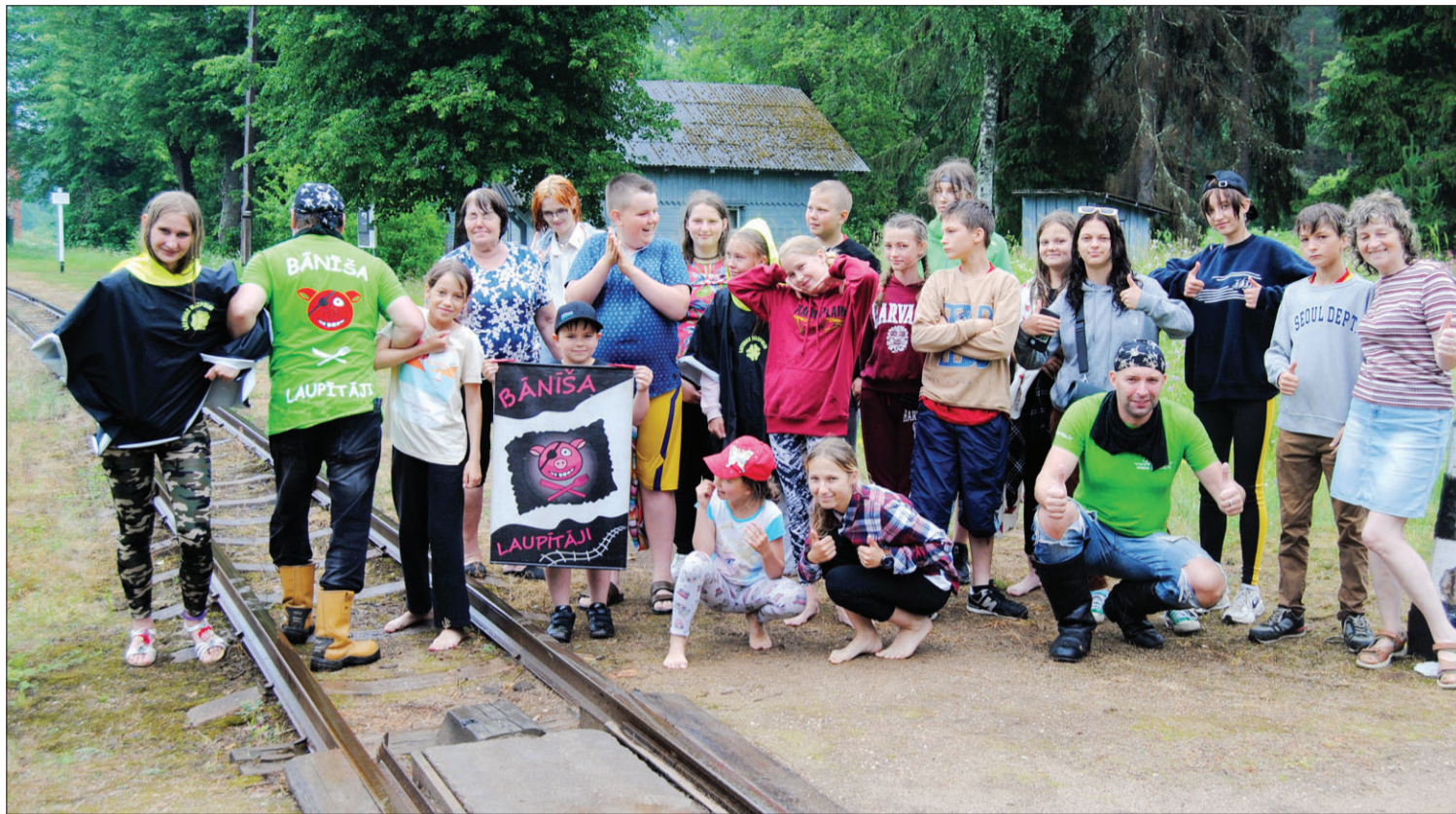
Mazpulcēni bāniša laupītāju gūstā.

laikā katrs izgatavoja sev jauku piemiņas lietiņu. Darbīgā diena noslēdzās ar naksniņu pastaigu pa Alūksni, apskatīts tika tās izgaismotais muzikālais tilts un citi objekti.