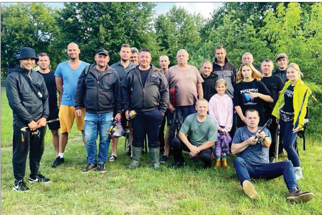
Makšķerēšanas sacensību dalībnieki.