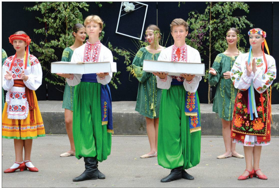
Puzē ieradās arī viesi no Ukrainas.

Vasara – svētku laiks. Un šis ir svētku laiks arī Puzes pagastam. Puzē tie sākās jau jūlijā, kad katru nedēļas nogali viesojāmies kādā no mazajiem ciematiem, lai kopīgi svinētu mazo ciemu svētkus.