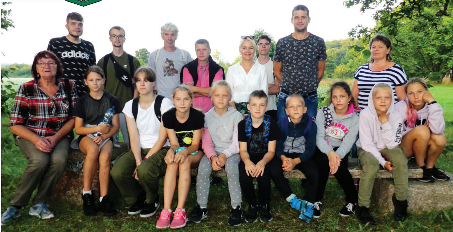
Pārgājienu dalībnieki Popē pie Dullā Daukas soliņa.

Tālāk maršruts veda līdz zemnieku saimniecībai "Bērziņi", kur līdzās nelielai informācijai par