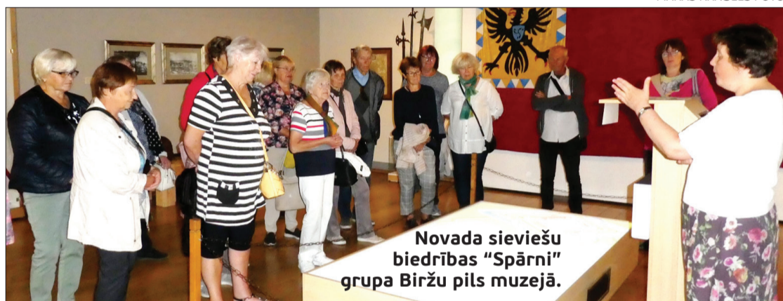
Novada sieviešu biedrības “Spārni” grupa Biržu pils muzejā.

Biržu pili šobrīd atrodas Biržu novada muzejs “Sēla”. Ekspozīcijas ir izvietotas divās ēkās. Galvenajā ēkā atrodas vēsturiskā ekspozīcija, suvenīru veikaliņš un restorāns. Blakus ēkā izstādi modernizē, un tur parādījušies vairāki interaktīvie eksponāti. Interesanti bija vērot filmu par to, kā zviedru