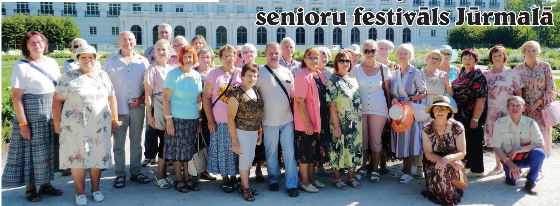
Ventspils novada seniori devušies uz festivālu "Pie jūras dzīve mana".

Saņēmām aicinājumu līdzdalībai sestajā Piejūras novadu senioru festivālā "Pie jūras dzīve mana". Pateicoties Ventspils novada pašvaldības atbalstam, festivālā piedalījās 31 Ventspils novada seniors.