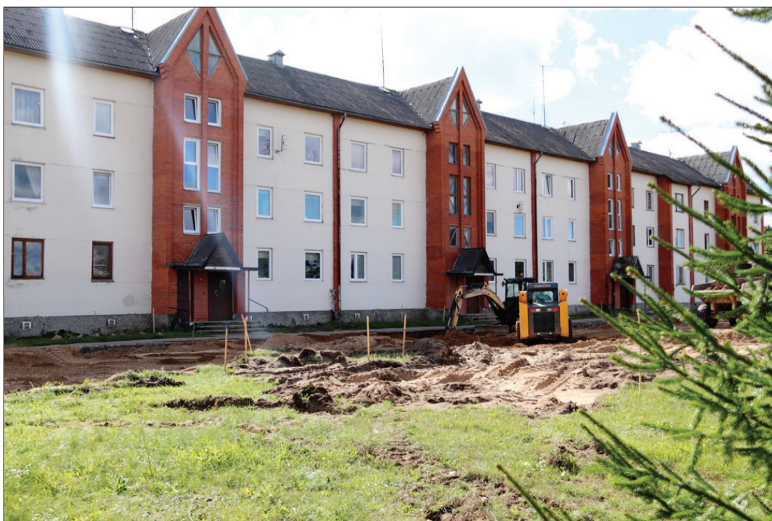
Pēc rekonstrukcijas Peldu ielā 9 būs paplašināta autostāvvietā.