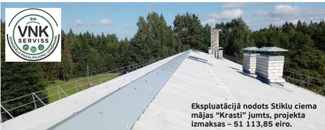
Ekspluatācijā nodots Stiklu ciema mājas "Krausti" jumts, projekta izmaksas – 51 113,85 eiro.

SIA "VNK serviss" jau gadu aktīvi strādā ar tiem klientiem, kuri dažādu iemeslu dēļ laikus nav norēķinājušies par saņemtajiem pakalpojumiem. Vairāki negodprātīgi īrnieki no pašvaldībai piederošiem dzīvokļiem ir izlikti ar tiesas spriedumu, un turpinās darbs ar dzīvokļa īpašniekiem, kuri nenorēķinās par apsaimniekošanu un/vai komunālajiem pakalpojumiem.