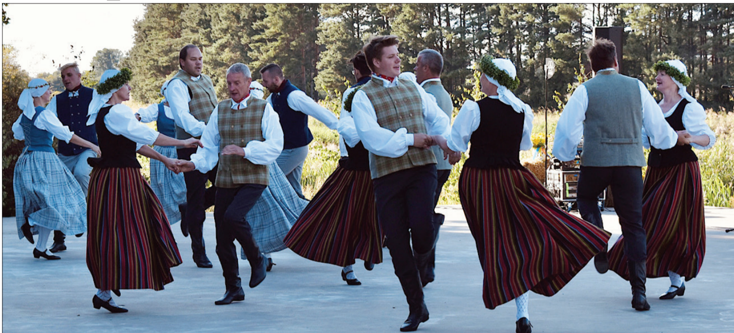
Pēcpusdienā Piltenes estrādē skanēja dziesmas, instrumentu skaņas un uzstājās dejojāji. Attēlā usmenieki un tārģalnieki.