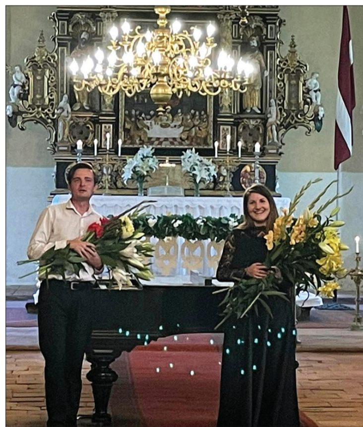
Mākslinieki pēc koncerta ar saņemtajiem ziediem.