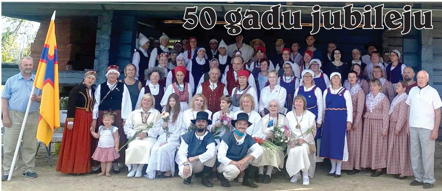
Folkloras kopas “Kāndla” dziedātāji ar saviem viesiem Lībiešu zvejnieku sētā.

Mēs, folkloras kopa “Kāndla”, Tārgalē atzīmējam savu 50 gadu jubileju. Svinības apvienojām ar piejūras folkloras festivālu “Kaijas balss 2022”.