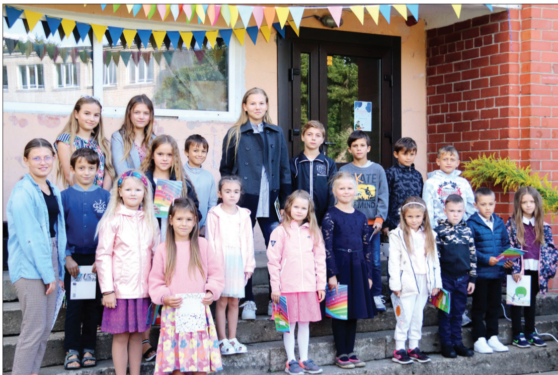
Jaunie audzēkņi piepulcējas Piltenes Mūzikas skolas saimei 30. mācību gadā.