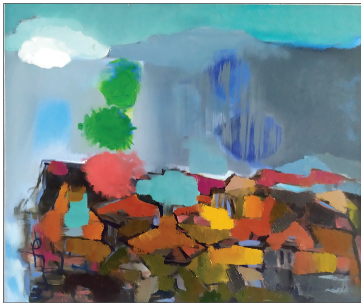
Viens no Guntas Kalseres darbiem.

Mākslas skolas skolotāji plāno aktīvi strādāt ar izstādes materiālu. Audzēkņiem būs iespēja pētīt