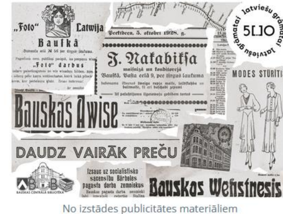
No izstādes publicitātes materiāliem