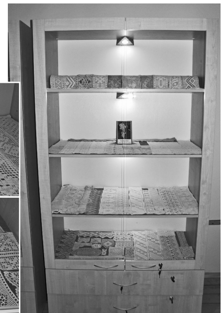
Mildas Bukas izveidotā ekspozīcija