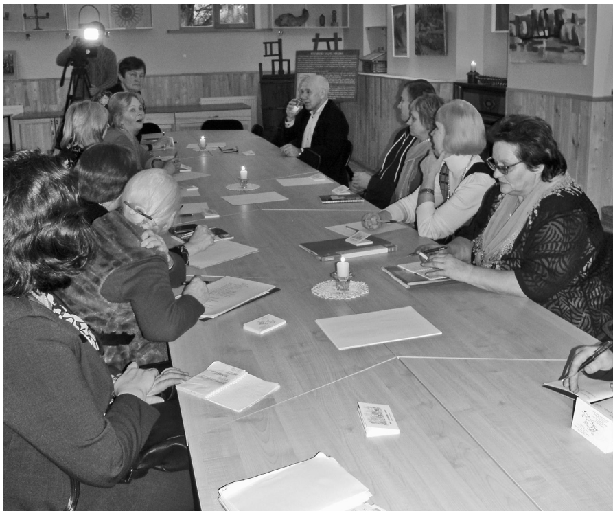
Visu novadu pārstāvji cītīgi diskutē par Sēlijas kultūras vērtību grāmatas izveidi

Šīs grāmatas galvenais mērķis – apkopot visu novadu iesūtītos tekstus un foto, radīt vienotu, kopīgu materiālu par Sēlijas septiņiem novadiem (Ilūkste, Aknīste, Jēkabpils, Viesīte, Sala, Nereta un Jaunjelga-