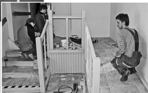
Notiek aktīvs darbs pie uzbrauktuves uzstādīšanas

30. janvāra rītā Neretas sociālā aprūpes centra iemītniekiem un darbiniekiem iesākās ar jaunām cerībām un sapņiem. Pie viņiem ieradās un aktīvu darbu uzsāka Kronīšu un Zeltiņu ģimene. Viņu mērķis bija 2. stāvā izbūvēt uz-