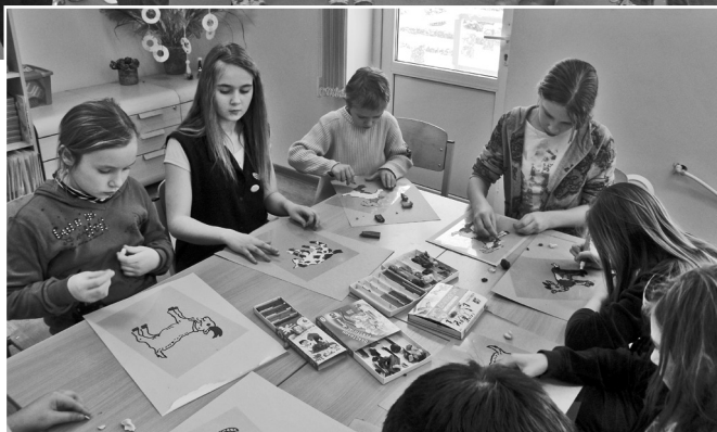
Mazpulku dalībnieki aizrautīgi veido plastilīna glezniņas