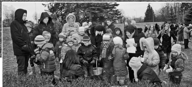
Vēlāk visi dzēra siltu tēju un cienājās ar cepumiem