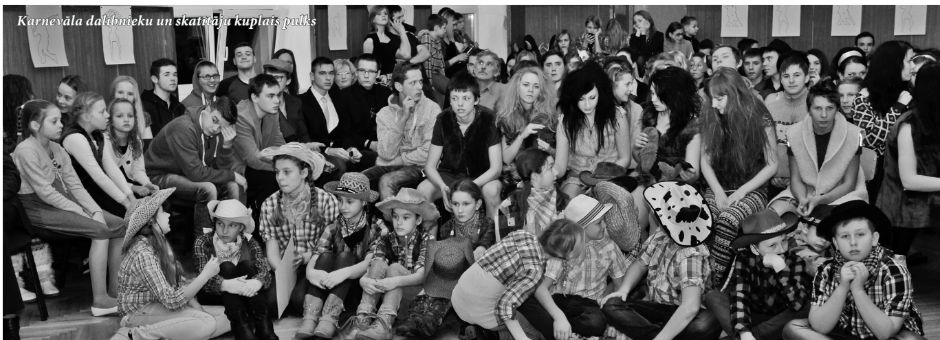
Karnevāla dalībnieku un skatītāju kuplais pulks

Paldies visiem, kas bija atsaucīgi un apmeklēja šo pasākumu! Paldies atraktīvajiem vadītā-