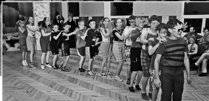
6.klases skolēni aktīvi leca dejā letkiss