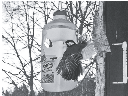
Viļņa Skujas veidotā putnu barotava no piena pudeles

Konkursā var piedalīties ikviens Latvijas iedzīvotājs, taču jo īpaši piedalīties aicināti bērni un jaunieši.