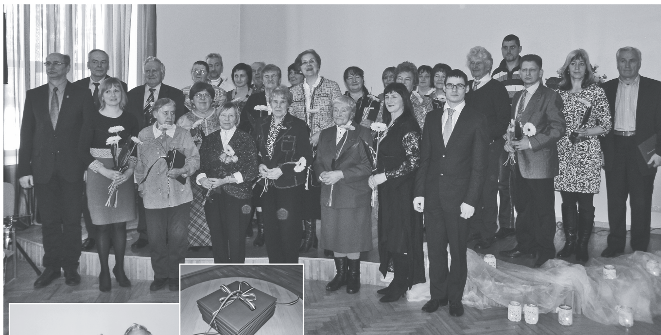
Albuma "Tava un mana Sēlija" radošā darba grupa