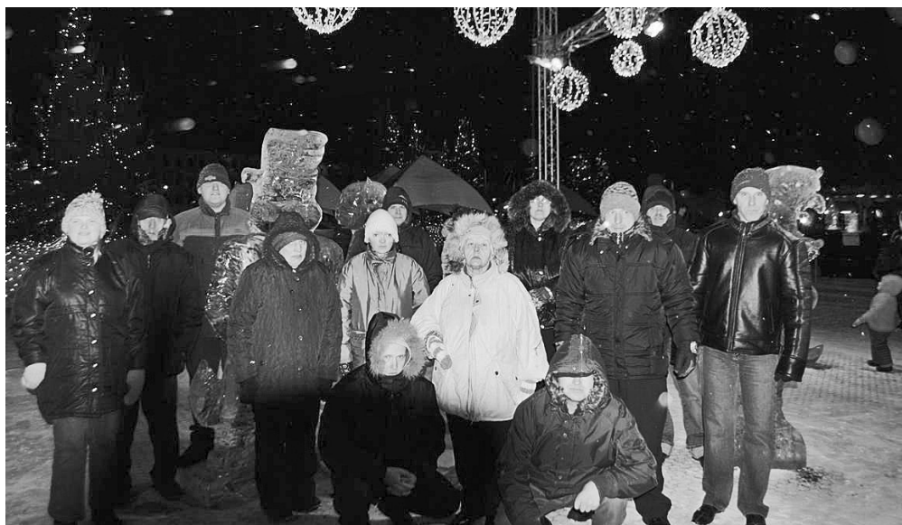
VSAC "Latgale" filiāles "Mēmele" klienti izbaudīja ledus skulptūru šovu un krāšņo uguņošanu

8. februārī vairāki VSAC „Latgale” filiāles „Mēmele” klienti kopā ar darbiniekiem devās uz Jelgavu, lai apmeklētu Starptautisko Ledus skulptūru festivālu, kura tēma šogad bija pasakas.