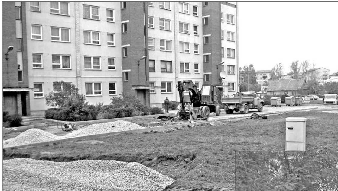
На ул. Спорта 36, 5, 5а и 7 работа в самом разгаре

Жители примерно десяти пятиэтажных домов в этом году порадуются возобновленным дворам. За последнее десятилетие это первый раз, когда проводится реконструкция внутренних дворов.