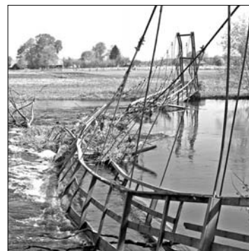
Так пешеходные мостки выглядели этой весной.

Дума приняла решение провести реконструкцию двух пешеходных мостков через реку Дубну, которые находятся в Калванах – Герцанах и Рожупе I – Рожупе II Рожупской волости. Оплату предусмотрено произвести со средств выделенных государством для непредвиденных ситуаций. Возобновление мостков задержалась в связи с тем, что владельцы земли не согласились с постройкой мостков, так как это обременяет их земельные владения. По этой причине немного изменено раз-