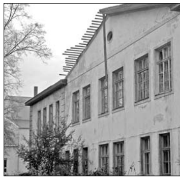
Уже начались возобновительные работы белой или Большой школы.

Дума Ливанского края заключит договор с ООО «Екабпилское ПМК» о ремонте крыши здания самоуправления на ул. Домес 3, условившись об отложенном платеже на 2006 году в размере 9993,70 латов. Это необходимо, чтобы возобновить во время бури испорченную крышу здания. Упомянутая сумма будет предусмотрена в бюджете думы 2006 года. Уже начались опросы цен и, возможно, вскоре будет известно, кто займется работами возобновления здания. Путем проекта для этого привлечено 800 000 EUR, и ремонт здания и обустройство необходимо закончить до осени следующего года.