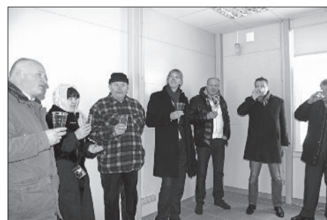
Glāze dzidrā ūdens – par veiksmīgu stacijas darbību.