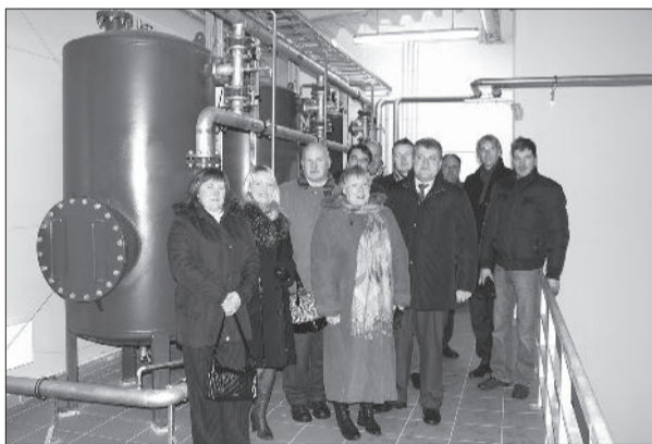
Kopbildē – visi vēsturiskā notikuma dalībnieki.