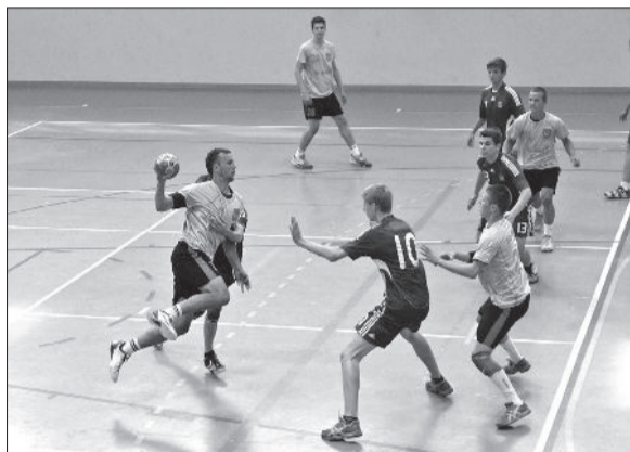
↑ Aucenieki dodas uzbrukumā.