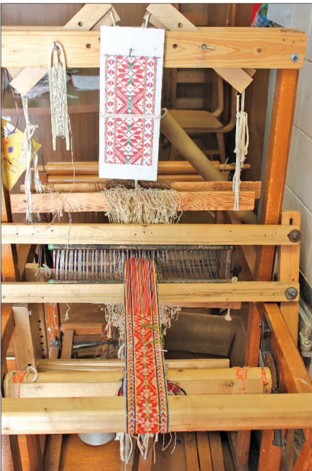
Līdz Dziesmu svētkiem Zemgales jostai trīsarpus metru garumā jābūt noaustai.

Auces novada pašvaldības bezmaksas informatīvais izdevums «Auces Novada Vēstis» iznāk reizi mēnesī, un tā iznākšanas laiks ir saistīts ar novada domes ikmēneša sēdi.