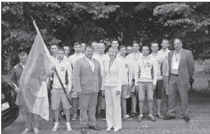
↑ Mūsu handbolistu komanda kopā ar pašvaldības vadību.