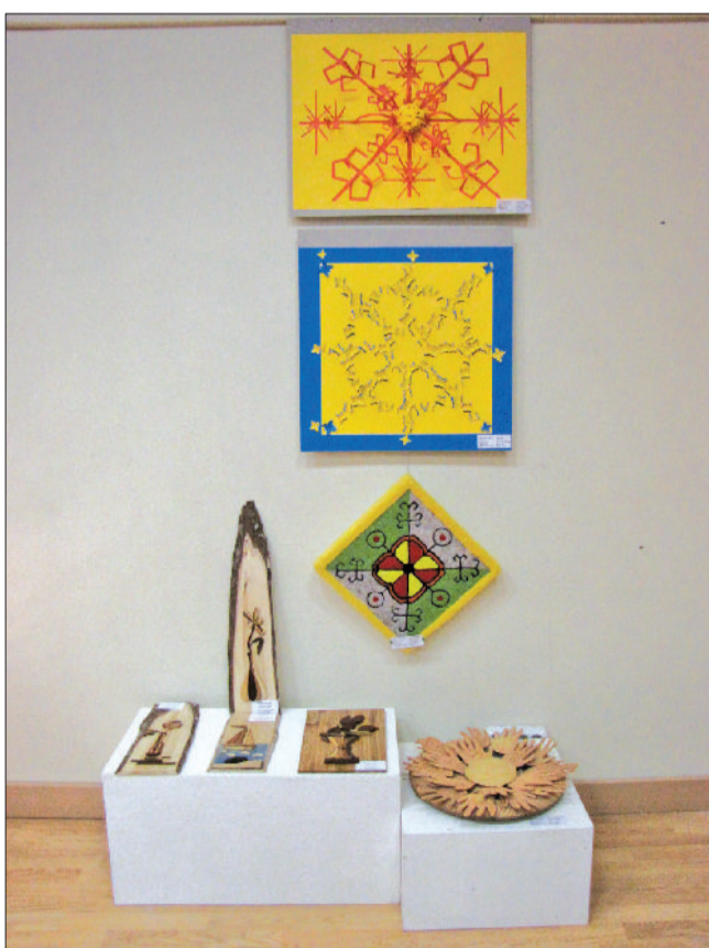
Zemgales reģiona izstādei izvirzītie darbi.

Jaunos māksliniekus no dažādām Zemgales reģiona skolām Jelgavā sagaidīja ne tikai rezultātu paziņošana un labāko apbalvošana. Konkursa dalībniekiem bija iespēja papildināt savas zināšanas dažādās Jelgavas Mākslas skolas grafikas, foto un dabas materiālu apgleznošanas, kā arī Bērnu un jauniešu centra „Junda” radošajās darbnīcās, spēlēt spēles un iepazīt jaunus draugus.