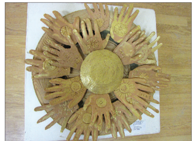
Keramikas pulciņa darbs „Lai vienmēr būtu saule, Lai vienmēr būtu es!”.

Savukārt skolotāji un novadu koordinatori viesojās Ģ. Eliasa Jelgavas Vēstures un mākslas muzejā un Jelgavas Svētās Trīsvienības tornī.