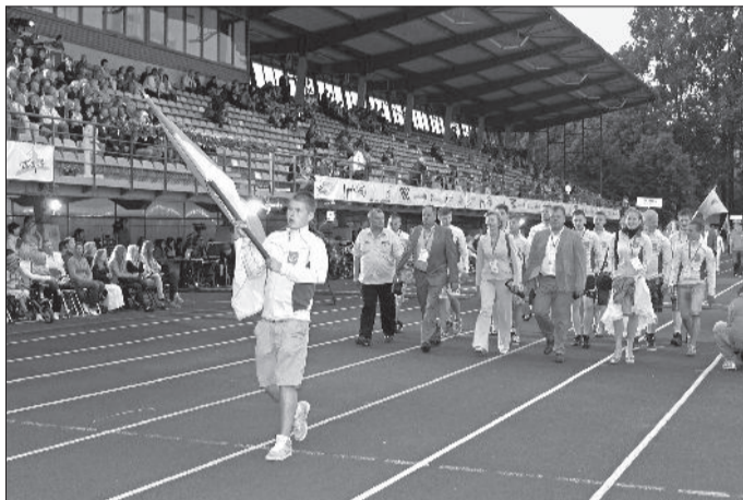
→ Auces novada delegācija soļo olimpiādes atklāšanas gājienā.