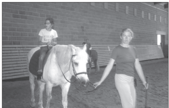
Reitērijas manēžā Vaivaros.

Kamēr skolā brīvlaiks, esam ieplānojuši saviem mazākajiem asistenta pakalpojuma saņēmējiem rast iespēju apmeklēt reitērijas nodarbības Nacionālajā rehabilitācijas centrā „Vaivari”.