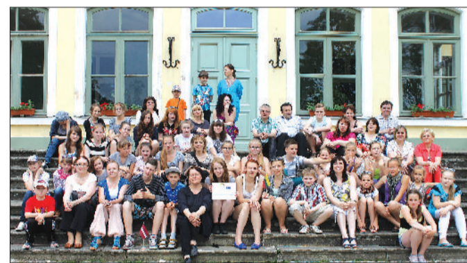
Projekta dalībnieki pie Lielauces pils.