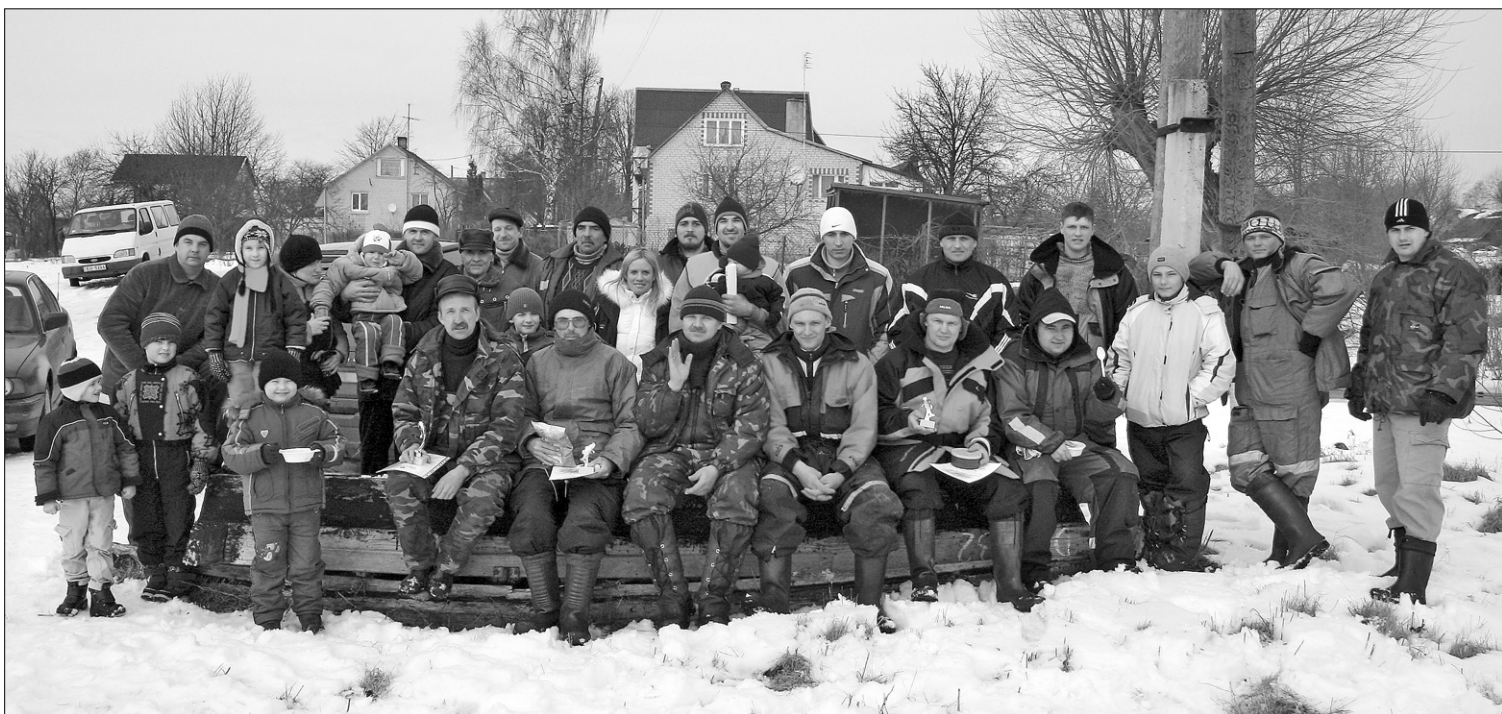
Участники соревнований подледной рыбалки вместе с болельщиками