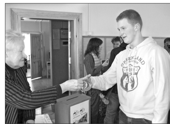
Участники семинара свои вопросы помещали в специальный ящик сбора вопросов и за свою активность получали сувенир с лого-кружку.