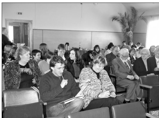
Участники семинара и активно вслушивались в презентацию лектора о ЕС, и задавали свои вопросы о Европейском Союзе и Латвии.