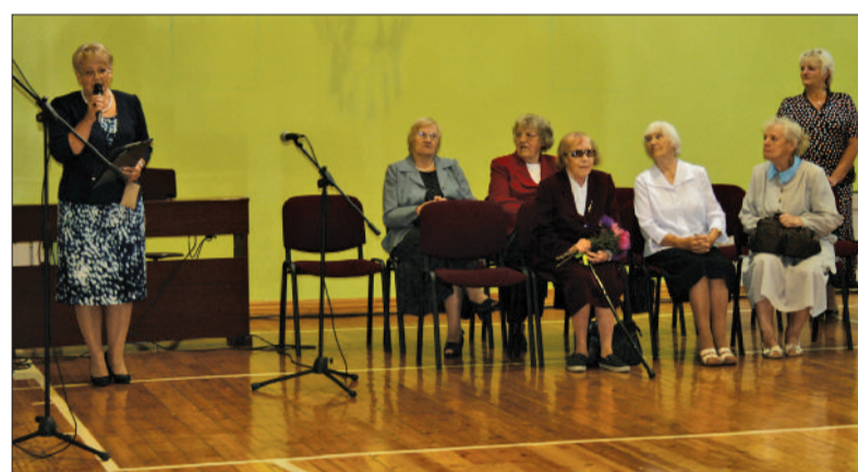
Izskanēja jaukas uzrunas un apsveikumi jaunajā mācību gadā.

Tam vien prieki gaviļē, Visā plašā pasaulē, Kas ar prātu dedzīgu Metas iekrāt gudrību.