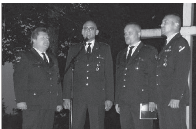
Skandobeles Zemessargu ansambļa balsis.