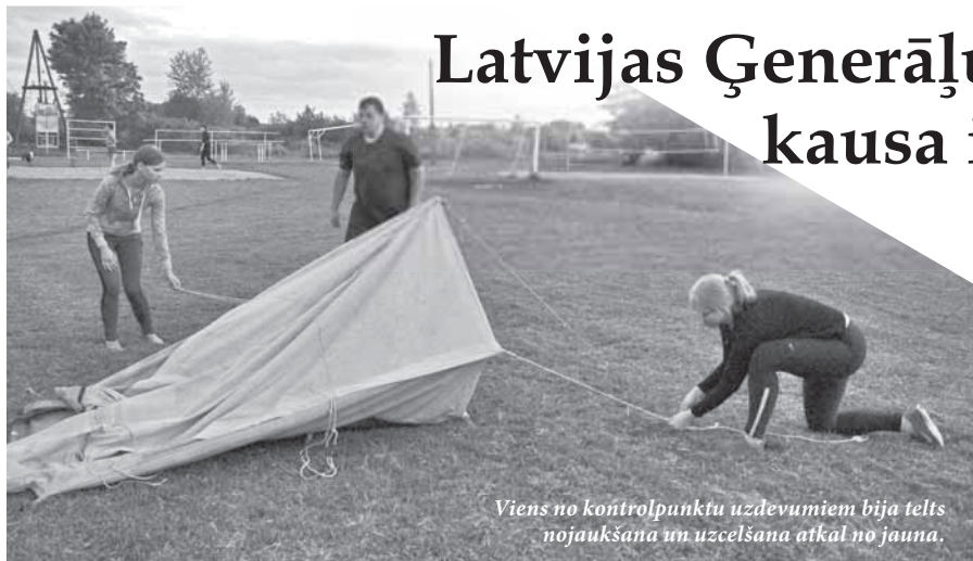
Viens no kontrolpunktu uzdevumiem bija teltis nojaukšana un uzcelšana atkal no jauna.

Pirmo gadu, iesaistot visus 7 Sēlijas novadu jauniešus, ir aizsācies Latvijas Ģenerāļu kluba ceļojošais kauss. Šī pasākuma mērķis ir stiprināt valstiski – patriotiskās vērtības un zināšanas par Valsts drošību un aizsardzību, vienlaikus veicinot bērnu un jauniešu sportiskās aktivitātes.