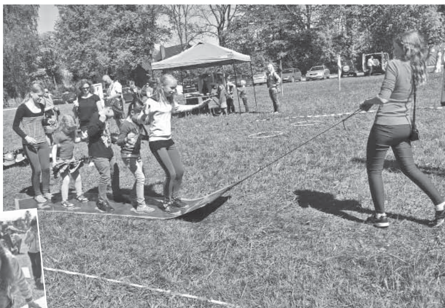
Sproģu pamatskolas skolēni piedalījās dažādās sportiskās aktivitātēs.

Skolēniem 24. maijā bija iespēja braukt uz noslēguma vides festivālu Siguldā. Pasākumā darbojās nozīmīgākās Latvijas vides un dabas aizsardzības organizācijas, kā arī zaļi domājoši uzņēmumi un biedrības. Pasākumā tika piedāvātas daudz un dažādas radošas darbnīcas, kurās skolēni piedalījās ar lielu interesi un zinātkāri. Katram bija iespēja sev kaut ko pagatavot, veikt pētījumus, piedalīties sporta aktivitātēs, kā arī jauki pavadīt laiku ar mūziķi Ralfu Eilandu un grupu "Musiqq".