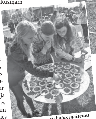
Sproģu pamatskolas meitenes pārbaudīja savas zināšanas daudzveidīgajā augu valstībā.