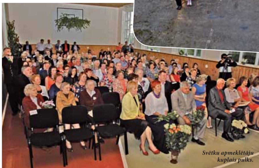
Svētku apmeklētāju kuplais pulks.

tām emocijām viens otru sveicināja sen neredzētie klases biedri.