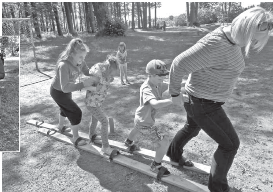
Veicamajos uzdevumos, pasākuma apmeklētājiem vajadzēja darboties komandā.

Pasākumā bija iekļauts arī orientēšanās uzdevums. Katrai komandai pašai bija jāsamēklē pieturas pēc īpašas kartes ar muižas parka plā-