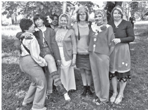
Biedrības "Ērberģietes" pārstāves iejutās pasaku tēlu lomās.

Sestdien, 30. maija rīta pusē, Ērberges muižas teritorijā valdīja ista rosība. Tur pulcējās 10 aktīvas ģimeņu komandas no Mazzalves un arī Pilskalnes. Šis ģimenes atsaucās ielūgumam un