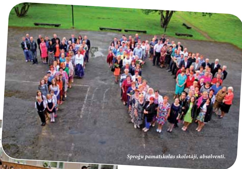
Sproģu pamatskolas skolotāji, absolventi.

Svētku pasākums iesākās ar absolventu un viesu reģistrēšanos. Pirms svētku atklāšanas, skolas bijušie absolventi, skolotāji labprāt izstaigāja skolas telpas, bibliotēkā, pētot speciāli šai dienai veidotos fotogrāfiju standus, atminējās skolas laikā piedzīvoto. Ar patiesu prieku un nevilto-