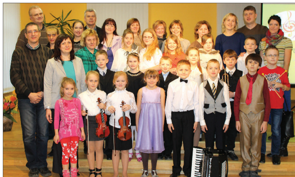
2. klases audzēkņi kopā ar pedagogiem un vecākiem.

Šogad esam atjaunojuši senu tradīciju – visu klašu audzēkņu koncertus ciklā „Es muzicēju Jums”. Šī ir lieliska iespēja katram skolas audzēknim spēlēt vai dziedāt uz koncertskatuves. Katru koncertu papildina klases audzēkņiem veltīta prezentācija un fotogalerija skolas mājas lapā. Šajos koncertos nostiprinām skatuves kultūras iemaņas – paklanīties pirms un pēc uzstāšanās, kon-