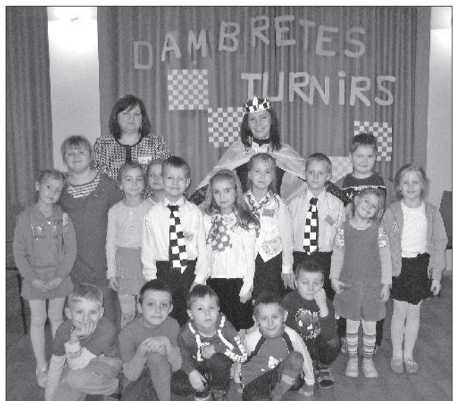
PII „Pilādzītis” komandas.

Pasākums iesākās ar dalībnieku reģistrāciju. Viesiem bija iespēja aplūkot PII „Pilādzītis” bērnu un vecāku pašgatavotus un seno laiku dambretes eksponātus, kurus mēs piedāvājam aplūkot kā muzeja aizsākumu.