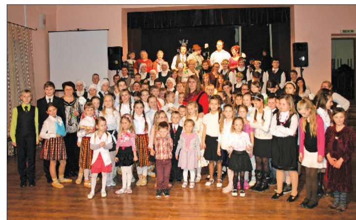
„Tā mēs augam” kuplais dalībnieku pulks.

Pēc koncerta notika ballīte Bēnes vidusskolas instrumentālā pūtēju orķestra vadībā. Visi, kuri pabija šajā sen nebijušajā notikumā, atzina, ka mūsu pūtēju orķestra dalībnieki lieliski prot izvēlēties dejošanai piemērotas melodijas un meistarīgi tās nospēlēt. Paldies mūsu foršajiem muzikantiem! Uz tikšanos