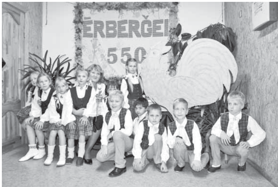
Mazzalves pamatskolas dejotāji un skolotāja gandarīti un lepnī pie pagasta simbola – gaiļa.