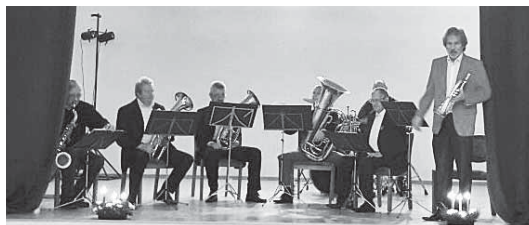
Viesītes pūtēju orķestris.