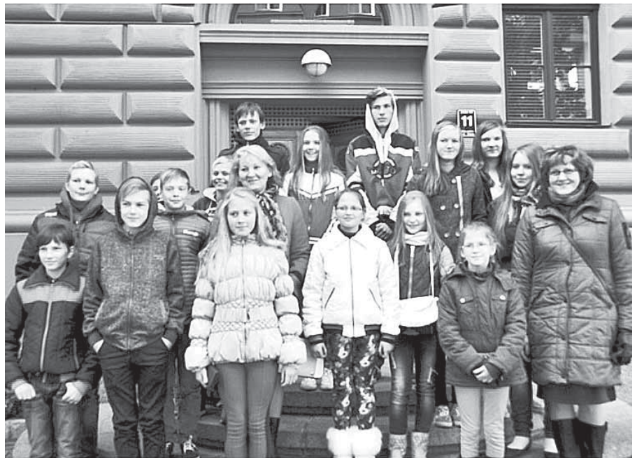
Mazzalves pamatskolas skolēni un skolotāji pie Latvijas Republikas Saeimas ēkas.

Pēc tam visi devāmies uz Latvijas Nacionālo bibliotēku. Daži skolēni tur jau bija bijuši, bet ne ekskursijas nolūkā, tādēļ visiem bija pavisam interesanti. Ar gida palīdzību izstaigājām visus bibliotēkas stāvus un par katru kaut ko uzzinājām. Redzējām slaveno Dainu skapi. Protams, visinteresantākais bija divpadsmitais stāvs, no kura varēja redzēt skatu uz Rīgu no augšas. Toties astotajā stāvā ir speciāls logs, no kura var redzēt tikai Rīgas Svētā Pētera baznīcu.