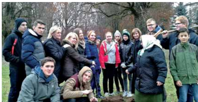
Pie Neretas Jāņa Jaunsudrabiņa vidusskolas savas saknes zemē “ieguldījis” jauns ozola kociņš, tagad tam atliek vien augt lielam un stipram.

Otrdien, 3. novembrī, mēs, mazpulcēni un muzeja draugi, pie skolas iestādījām vienu no ozoliņiem, kurus mums uzdāvināja, piedaloties akcijā “Simtozolu meži Latvijas simtgadei.” Stādot kociņu, mēs kopā domājām labas domas un vēlējām, lai ozoliņš izaugtu stalts, varens un kupls.