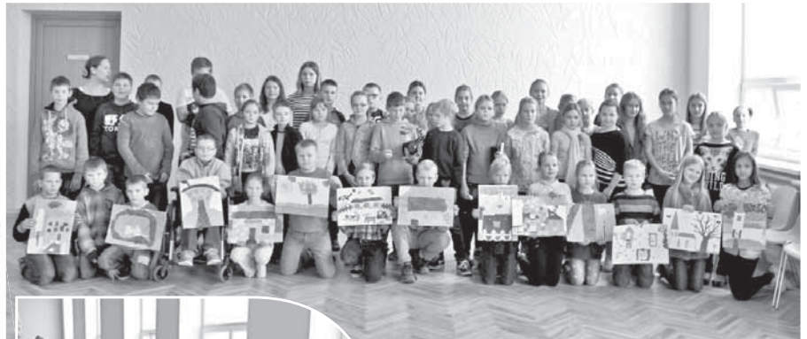
Pēc padarīta darba visi vienojās kopīgā foto.

Daloties grupās pa četri, skolēni izvēlējās vienu no nosauktajām īpašajām vietām, un tālākais uzdevums bija, pielietojot krāsainus papīra gabaliņus, baltu lapu un līmi, veidot kolāžu. Skolēnu izdoma un radošums bija apbrīnojama. Mērķis tika sasniegts. Nepilnas stundas laikā, bērni radīja krāšņus un neordinārus darbus. No-