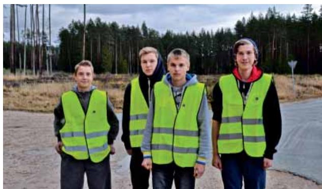
Neretas novada lāpu skrējiena dalībnieki no Mazzalves un Pilskalnes pagastiem.

14. novembrī Patriotu nedēļas ietvaros Jaunjelgavas novadā tika organizēts Sēlijas apvienības jauniešu lāpu skrējieni. (Sēlijas apvienībā ir 7 novadi – Jaunjelgava, Nereta,