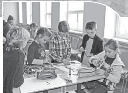
Skolēni veidoja krāsainas kolāžas.

mēšanu un griešanu. ASV vēstniecība sadarbībā ar Latvijas Starptautisko skolu organizē šīs darbnīcas dažādās Latvijas skolās ar mērķi veicināt radošu domāšanu Latvijā.