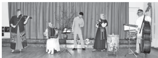
Aizkraukles pilsētas kultūras nama folkloras kapela "Karikste".