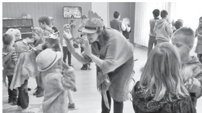
Bērni iesaistās tradicionālajās Mārtiņdienas rotaļās.