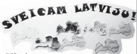
Bibliotēkas apmeklētāju veidotie novēlējumi Latvijas 97. dzimšanas dienā.

Pēc miklu minēšanas, darbojamies radoši – veidojam apsveikumus Latvijai 97.gadadienā. Katrs varēja izpausties kā vien vēlējas, galvenais, lai tas būtu no sirds. Apsveikumi tika veidoti kontūrā, kas simbolizēja katra atnākušā Latviju. Kad tauta ir kopā, mēs sakām “Mūsu Latvija”, bet katrs atse-