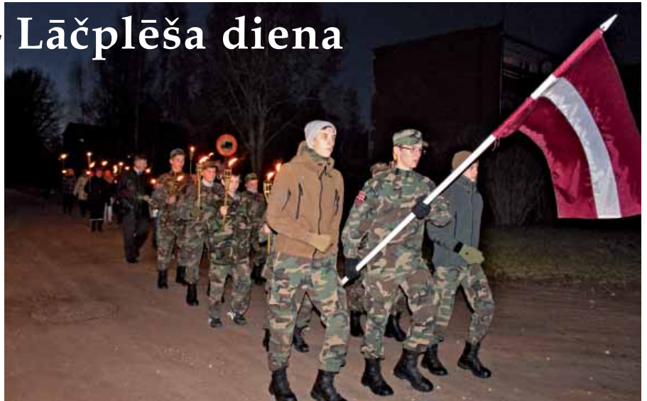
Plivojot Latvijas sarkanbaltsarkanajam karogam ar degot uguns liesmai lāpā, zemessargu vadībā, pagasta ļaudis devās uz Ķesteru kapsētu.