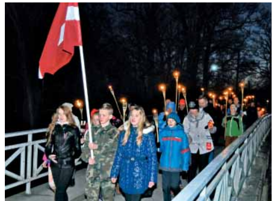
Mazzalves pagasta iedzīvotāju lāpu gājienā dodas pāri Marijas tiltu uz Varoņu laukumu.

Lāčplēša dienas pasākumi mazzalviešos viesā pārliecību, ka esam vienoti ar savu tautu, ka at-