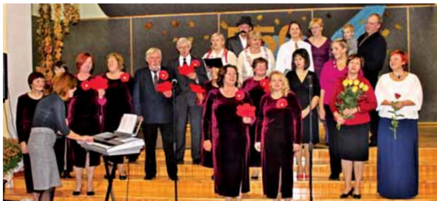
Mazzalves pagasta pašdarbnieki un skatītāji koncerta noslēgumā vienotās kopīgā dziesmā.