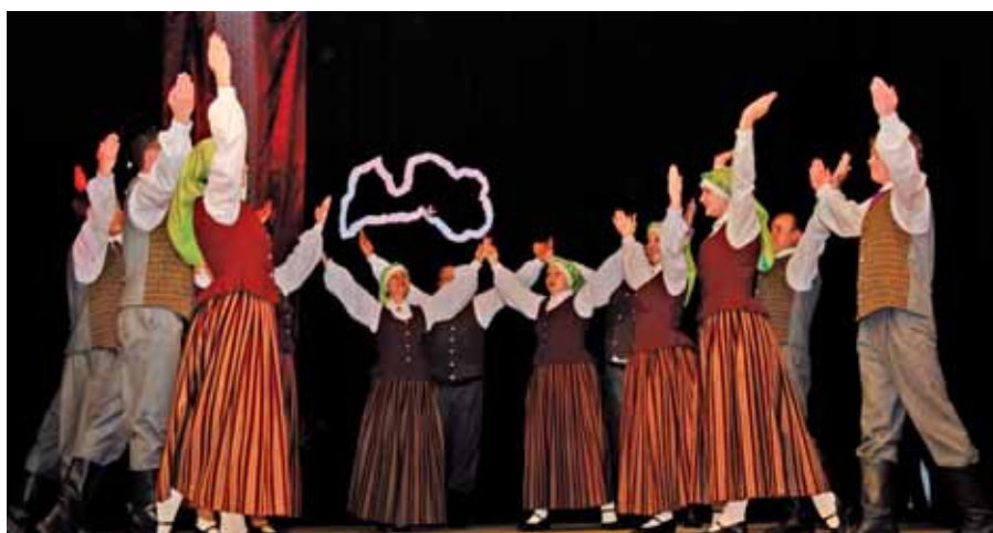
Vidējās paaudzes deju kolektīvs "Sēji."

savas valsts pastāvēšanu, jāstiprina un jāveicina sava piederība tautai. Jātur godā Latvijas sarkanbaltsarkanais karogs. Ģimenē jārunā par tā laika notikumiem un par to, kā rīkoties šodien. Mēs ne uz brīdi nedrīkstam aizmirst, ka pieradam Latvijai. Šobrīd kaut ko paredzēt nav iespējams. Vienā momentā mēs esam laimīgi, bet jau nākamajā brīdī var notikt, kas negaidīts un pārdzīvojumiem sēts. Francijas galvaspilsētā Parīzē nesen notiekošais ir pierādījums tam, ka dzīve var būt nežēlīga. Tieši tāpēc valsts prezidents Raimonds Vējonis 15. un 16. novembrī visā valstī iedzīvotājus aicināja izkārt valsts karogu sēru noformējumā, solidarizējoties ar Francijas valsti. Mums atliek domāt un sirdī būt kopā, būt vienotiem.