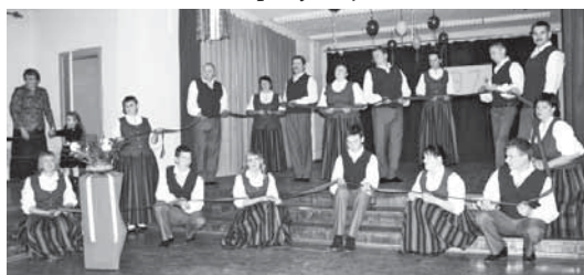
Pilskalnes vidējās paaudzes deju kolektīvs "Sarma," veidojot Latvijas kontūru, skaitīja dzejoļus par Latviju.