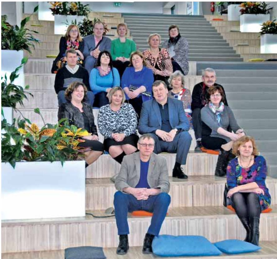
Mazzalves pamatskolas skolotāji iepazīstot Dabaszinātņu centru.

Mazzalves pamatskolas skolotāji bieži dažādās mācību ekskursijās ved savus audzēkņus. Šoreiz, 6. februārī, Mazzalves pamatskolas skolotāju kolektīvs devās uz Rīgu, lai apskatītu Latvijas Universitātes dabaszinātņu akadēmisko centru un Latvijas Nacionālo bibliotēku.