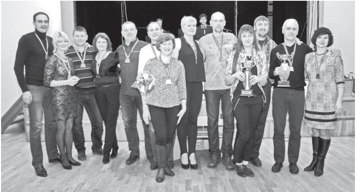
“Sēlijas kausa” ieguvēji – 40+ vīriem un 45+ dāmām – Madonas komandas.