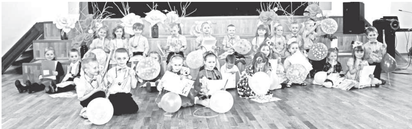
Pagājušā gada radošās pašizpaušmes konkursa "Talantiņš" dalībnieki.