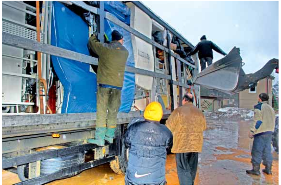
Vietējo uzņēmēju darbinieki cītīgi izkrāva visas preces angārā.