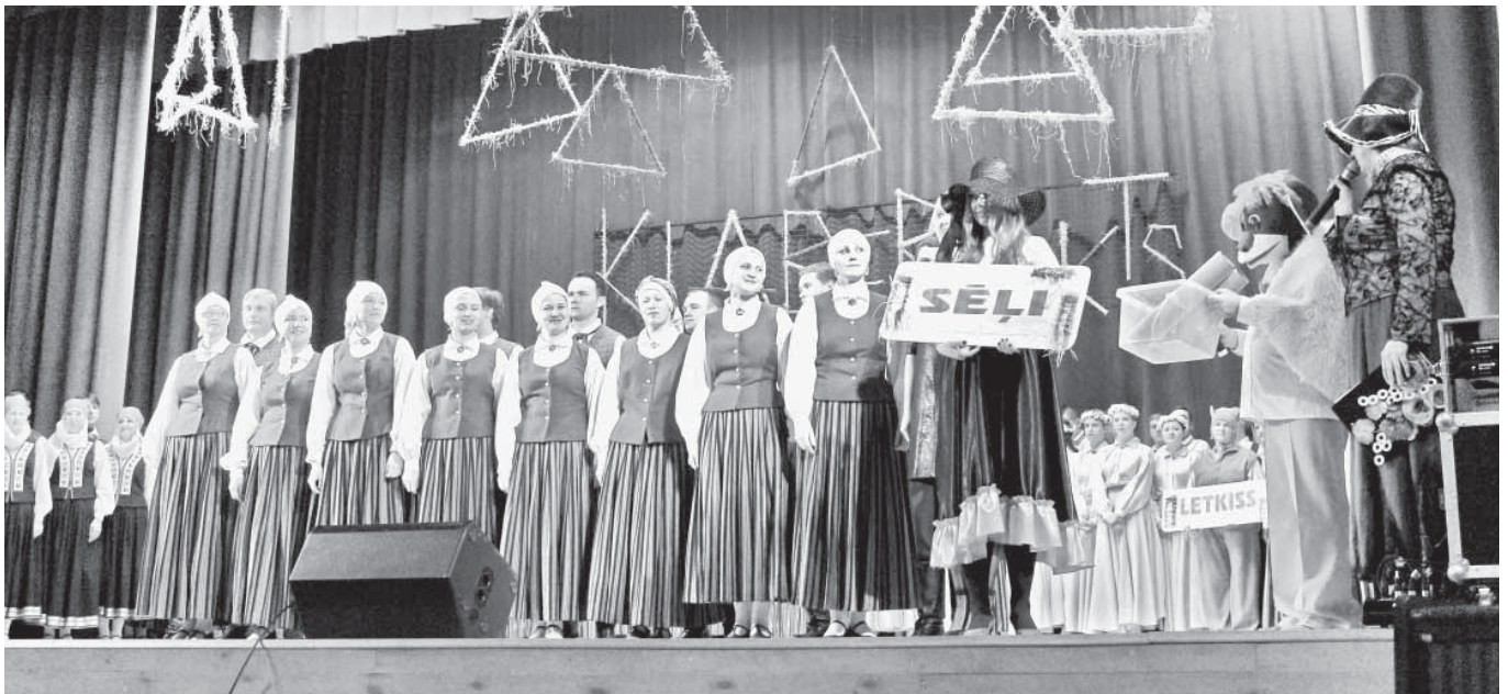
Vieni no ikgadējā tautisko deju kolektīvu sadanča "Klaberjaks" dalībniekiem – mūsu novada vidējās paaudzes deju kolektīvs "Sēļi."

30. janvāri Viesītes kultūras pili izdejota gadskārtējā "Klaberjaks". Šis ir jau 16. gads, kopš janvāra nogalē Viesītes un kaimiņu novadu dejojāji tiek starpnovadu tautu deju kolektīvu sadanci.