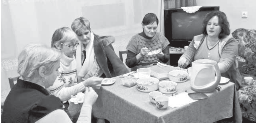
Biedrības "Ērberģietes" pārstāves dalās padomos un pieredzē kā nostiprināt veselīga dzīvesveida paradumus.

bija gan!) "Ērberģietes" "izvilka no pūralādes" arī dažādus sen aizmirstus sentēvu ieteikumus kā pārvarēt dažādas slimības un likstas. Katra no dalībniecēm šim pasākumam bija sagatavojusi kaut ko veselīgu. Sekoja pasākuma "garšīgākā" daļa.