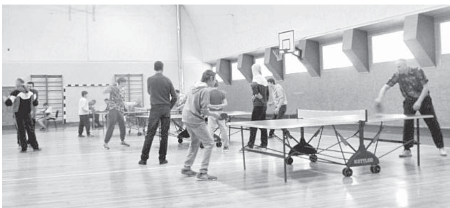
Aktīvākie novada galda tenisisti savstarpējās spēlēs noskaidroja labāko spēlētāju.

20. februāri, rīta pusē, Ērberģes sporta hallē gan mazi, gan lieli tika aicināti uz galda tenisa un dambretes turnīru. Interesentu pulciņš bija krietns, dalībnieki bija no Ērberģes, Neretas, Jaunjelgavas un Mēmeles, kuri izvēlējās piedalīties vienā vai abos turnīros.