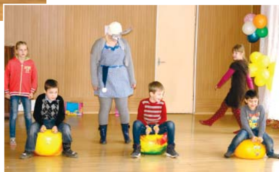
Jaunākie svētku apmeklētāji dienas centra "Vālodzīte" zālē devās jautrās izdarībās ar Vinniju Pūku un Trusīti.