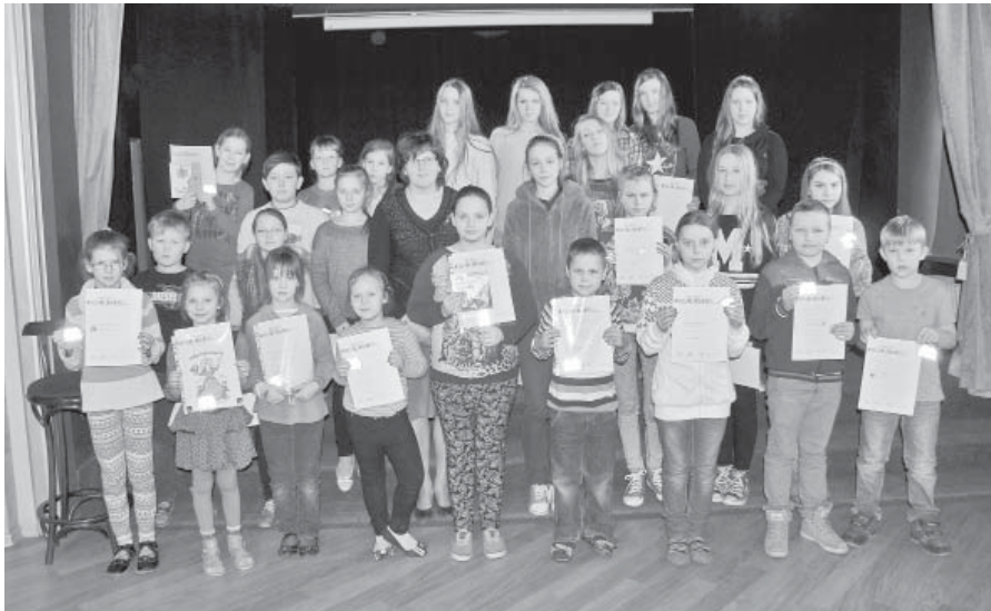
Mazzalves pamatskolas citīgākie lasītāji.

Janvāra beigās Mazzalves pamatskolas bibliotēkas lasītāji noslēdza ikgadējo LNB rīkotās „Bērnu žūrijas – 1015” ciklu, individuāli nobalsojot par izlasītajām grāmatām.