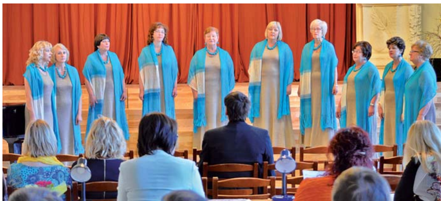
Neretas kultūras nama sievietes vokālais ansamblis "Kadence" vokālo ansambļu skatē 2015. gadā.

Bijām ļoti, ļoti pārsteigtas, jo "Kadence"