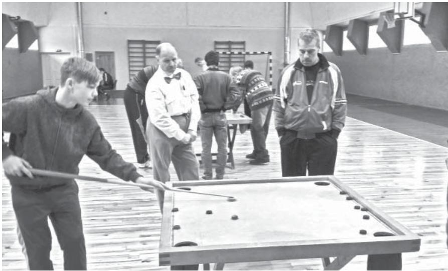
Ari jaunākie spēlētāji rādīja savas iemaņas novusā.

Jau otro reizi galda spēļu fani un atbalstītāji tika aicināti uz Ērberges sporta halli.