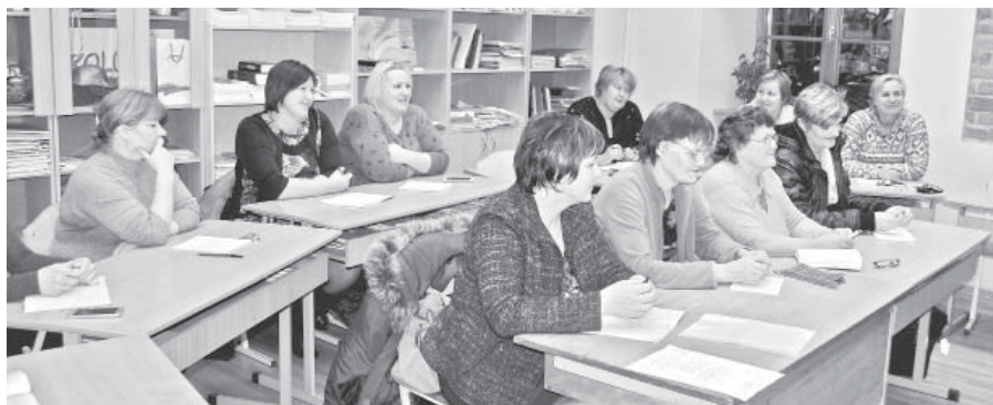
Biedrības "Ērberģietes" pārstāves un citi interesenti uzklausa padomus par veiksmīgu dārzkopību savā sētā.

Pavasaris vairs nav aiz kalniem. Īstais laiks pilnveidot savas prasmes un gūt iedvesmu jaunajai dārza sezonai. Tā biedrības "Ērberģietes" dalībnieces 15. februārī kopā