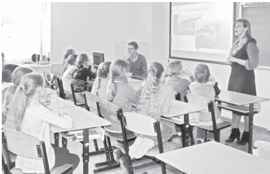
Neretas Jāņa Jaunsudrabiņa vidusskolas skolēni citīgi klausās par eiro banknošu drošības pazīmēm.

Mazzalves pamatskolā un Neretas Jāņa Jaunsudrabiņa vidusskolā Latvijas Bankas un Jelgavas Spīdolas ģimnāzijas pārstāvji 3. – 6. klašu skolēniem vadīja interesantas, aizraujošas nodarbības, kuru mērķis bija informēt par eiro banknošu un monētu drošības pazīmēm un popularizēt spēli “Eiro skrējiens”.