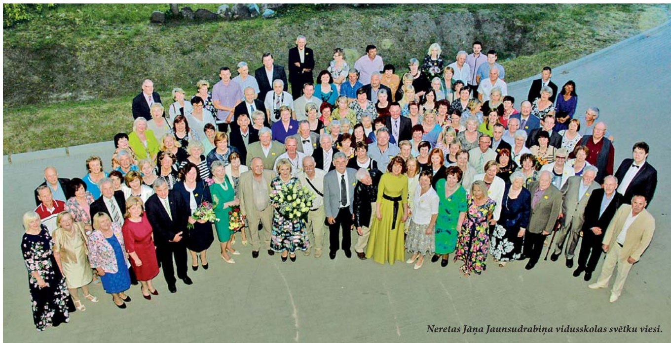
Neretas Jāņa Jaunsudrabiņa vidusskolas svētku viesi.