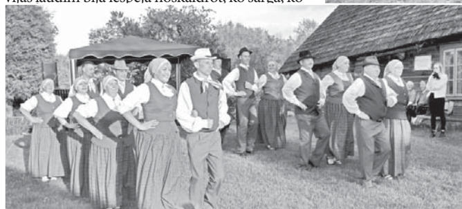
Pilskalnes pagasta vidējās paaudzes deju kolektīvs “Sarma”.