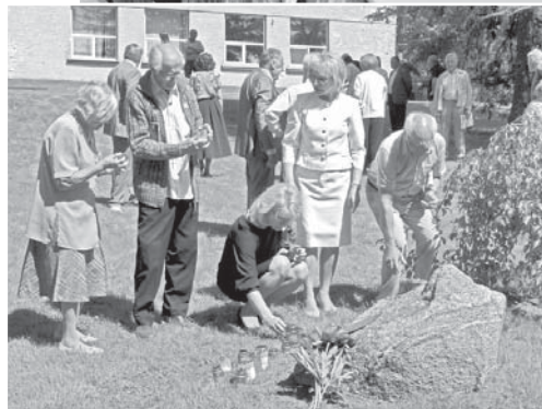
Noliekot svečītes pie Piemiņas akmens.

tu, krūzīti un bukletu tika teikts paldies.