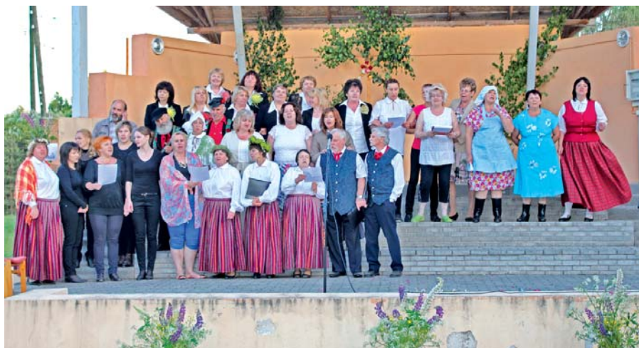
Novada pašdarbnieku kolektīvi noslēgumā vienotās kopīgā dziesmā.