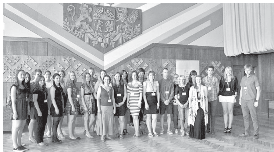
Sēlijas reģionālās konferences dalībnieki.

2. jūnijā Viesītes Kultūras pilī notika Strukturētā dialoga Sēlijas reģionālā kon-