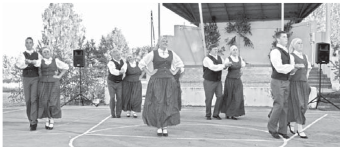
Pilskalnes pagasta vidējās paaudzes deju kolektīvs "Sarma" griežoties raitajā dejas solī.

Pasākuma apmeklētāji nenoliedzami bija ieguvēji, jo koncertu caurvija humors un as-