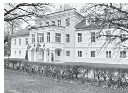
Noslēpumainā un vilinošā Ērberģes muiža.