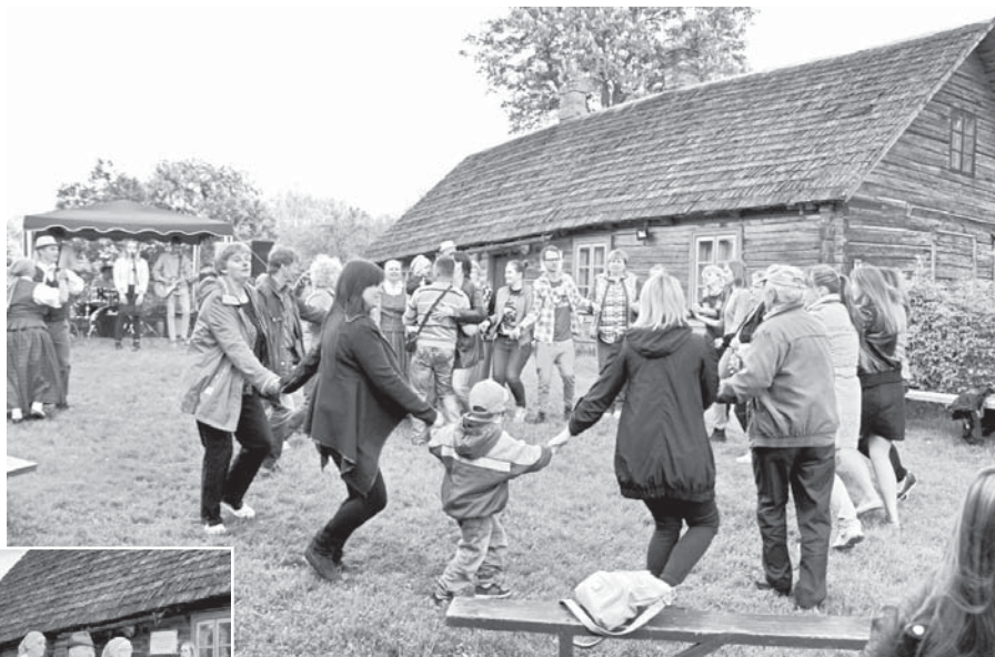
Pasākuma apmeklētāji iesaistījās kopīgās rotaļās.

Katru gadu “Muzeju nakts” pasākumu pavada kāda noteikta tēma. Šī gada akcijas atslēgvārds bija “Durvis”, kas ikvienu rosināja mirkli pakavēties uz sliekšņa un pavērot kādas durvis mēs veram ikdienā – aicinošas, pārsteigumu sološas vai varbūt smagas, bijību raisošas. “Durvis”, ar kurām mēs “sastopamies” dienu no dienas var būt dažnedažādas. “Muzeju naksti” Latvijas laudim bija iespēja noskaidrot, ko sargā, ko