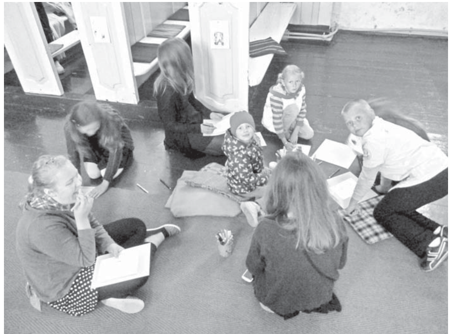
Baznīcu nakts jaunākie apmeklētāji labprāt nodevās zīmēšanai.

Neretas luterāņu draudze jau otro gadu bija gatava vērt durvis visiem naksnīgajiem ciemiņiem. Vēlējāties, lai tiem, kas atnāk, ir interesanti. Tā, lai gribas atnākt atkal. Šajā gadā nolēmām, ka viesu sagaidīšana notiks