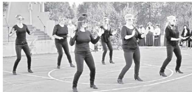
Mazzalves pagasta brīvā stila deju kopa "Mozaika" savos priekšnesumos izcēlās ar humora un atjautības "odziņu".