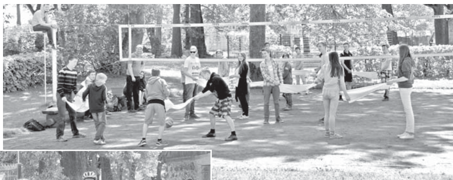
Aizraujošais un netradicionālais "Dvieļbols".

23. – 29. maijā Latvijā daudzi novadi iesaistījās tradicionālajā Latvijas Veselības nedēļā. Arī Mazzalvē visa nedēļa bija saplānota ar dažādām sportiskām aktivitātēm, jo sports un aktīvs dzīvesveids ir drošākais ceļš uz veselību. Vairums sportotāju bija Mazzalves pamatskolas skolēni, bet viņiem pievienojās arī pieaugušie – skolotāji, skolas darbinieki, vecāki, pagasta ļaudis. Visu nedēļu ap Ērberģes