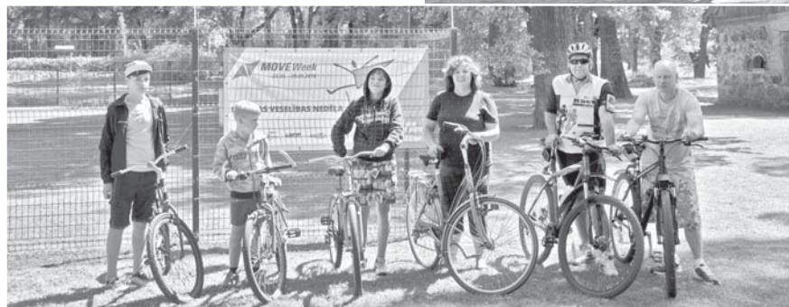
Aktīvākie braucēji ar divriteni.