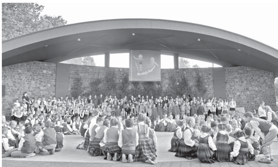
Dižkoncerta "Man stāstīja Daugaviņ" dziedātāji un dejotāji.