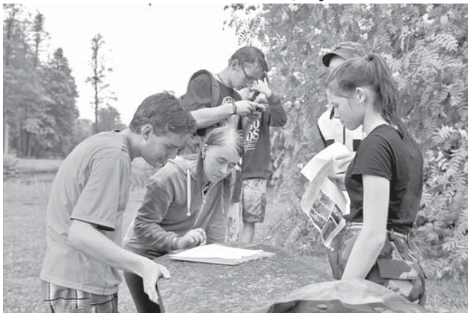
Neretas novada jauniešu komanda citīgi pildot uzdevumus.

Šī gada 25. maijā Jēkabpils novada Zasas pagastā norisinājās Sēlijas novadu apvienības un Krustpils novada Latvijas Ģenerāļu kluba ceļojošā kausa izcīņas 3. posms jauniešiem – foto orientēšanās, kurā mūsu novada jauniešiem ne tik ļoti paveicās un, iespējams, pietrūka arī nedaudz veiksmes, tomēr svarīgākā tomēr ir dalība.