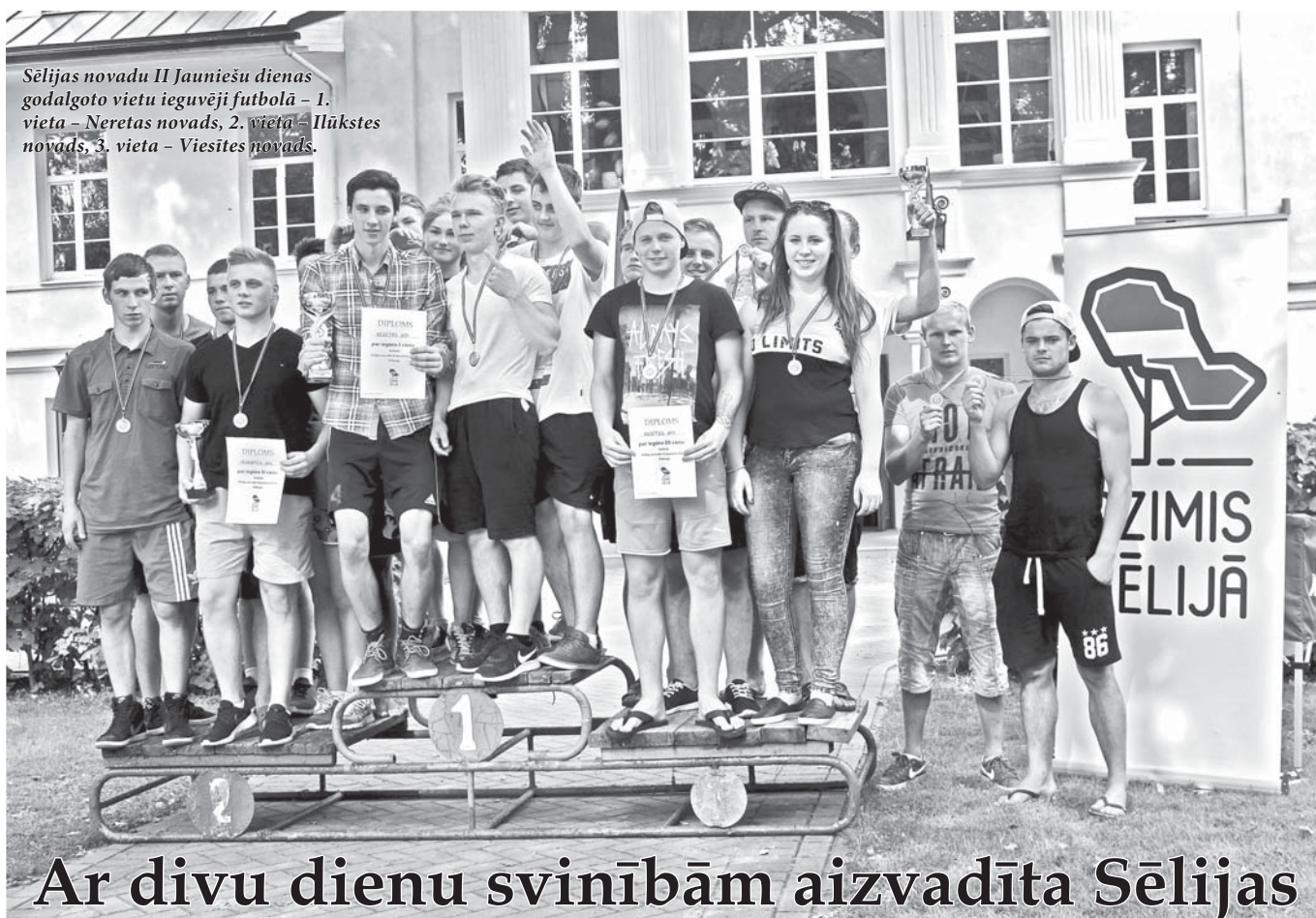
Sēlijas novadu II Jauniešu dienas godalgoto vietu ieguvēji futbolā - 1. vieta - Neretas novads, 2. vieta - Ilūkstes novads, 3. vieta - Viesītes novads.