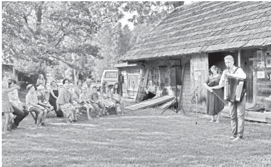
Jāņa Jaunsudrabiņa muzeja "Riekstiņi" sētsvidū pulcējās piemiņas pasākuma apmeklētāji uz kvalitatīvu un aizraujošu koncertu.

Pēc koncerta ikviens iesaistījās tradicionālajā "pupiņu ballē", kurā varēja nobaudīt gar-