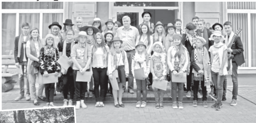
Neretas novada pašvaldībā Dzejas dienu skolēni lasīja vairākus dzejoļus un dziedāja dziesmas.

Neretas pagastā Neretas Jāņa Jaunsudrabiņa vidusskolas skolēni 12. septembra rītā ar dzeju un dziesmām pie-