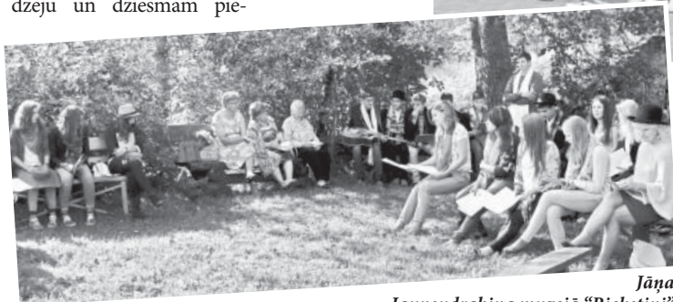
Jāņa Jaunsudrabiņa muzejā “Riekstiņi” Dzejas dienu apmeklētāji jaukā atmosfērā uzklauzot dzeju.

skandināja Neretu, iegriezoties veikalos, pastā, aptiekā, bērnu dārzā, Neretas sociālās aprūpes centrā, Neretas novad pašvaldībā un Jāņa Jaunsudrabiņa muzejā “Riekstiņi”.