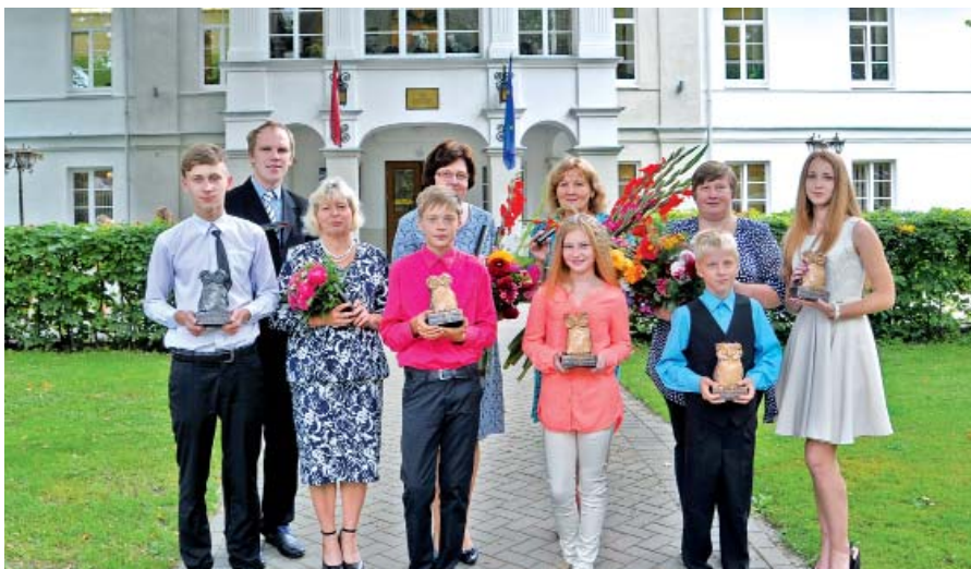
Mazzalves pamatskolas skolēni un skolotāji, kuri saņēma "Lielo pūci" un "Zelta pildspalvu".

Vasara aizsteigusies. Mazzalves skolā tā bijusi darbīga – nometnes, tūristi, dažādi lielāki un mazāki pasākumi... Nu skola ver durvis jaunajam mācību gadam. Mazzalves pamatskolā 94 bērni 2016./2017.mācību gadā katru dienu nāks uz skolu gūt zināšanas.