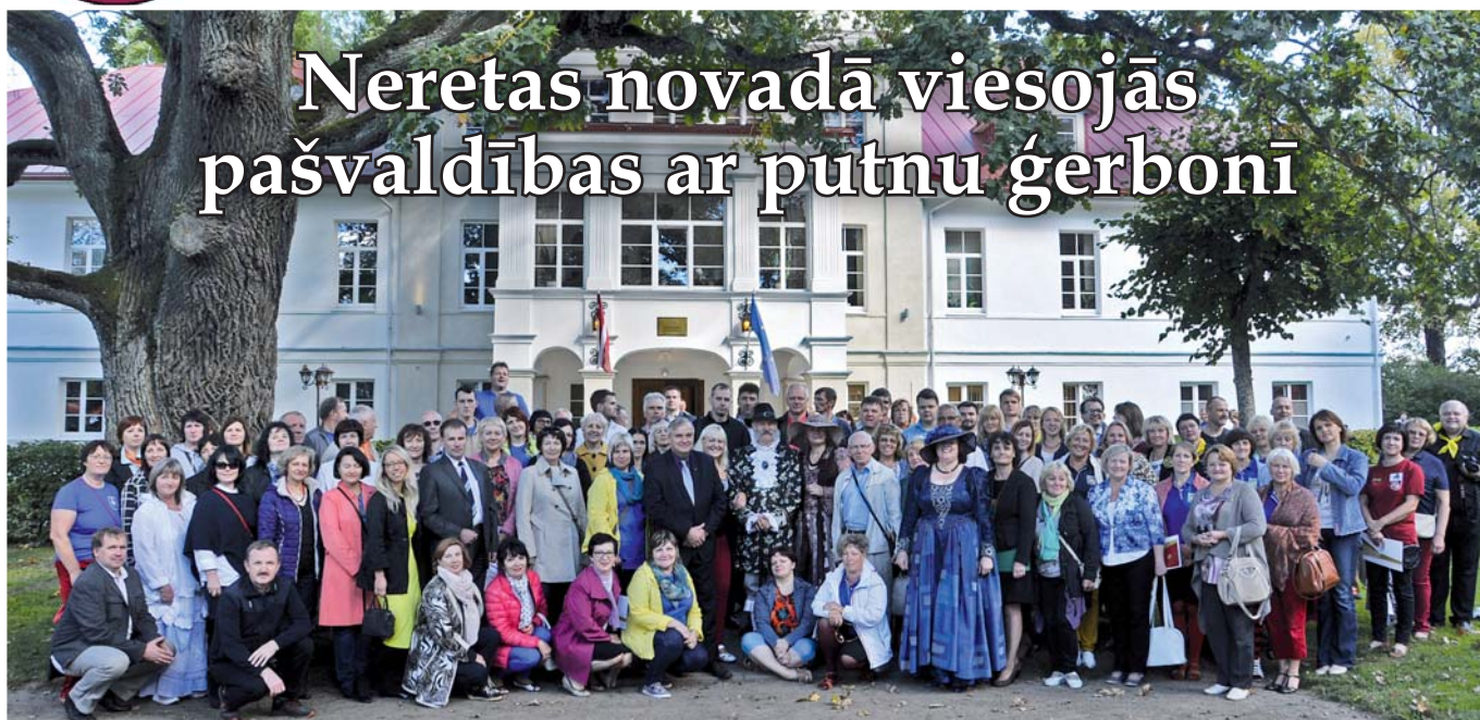
Putnu pašvaldību pārstāvji vienojoties kopīgā foto pie Ērberģes muižas.

“Visim ligzdas Neretā!” Ar šādu nosaukumu 16. septembrī Neretas novadā tika aizvadīts XV putnu pašvaldību – novadu, pilsētu un pagastu salidojums. Plānošanas un gatavošanās darbi norisinājās jau krievu laiku iepriekš. Neretas novads vienā dienā sen nebija uzņēmies tik daudz viesu.