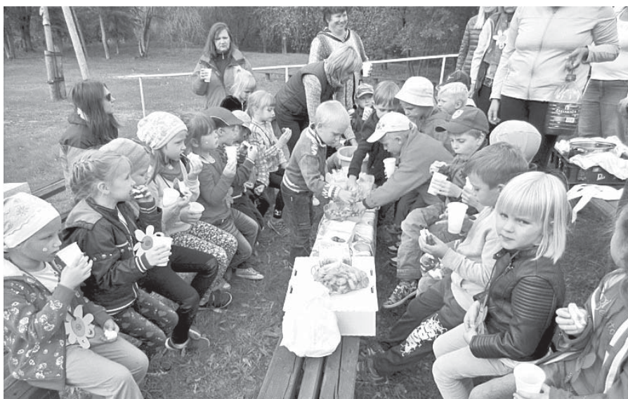
Sagatavošanas grupas bērni cienāties ar dārgumu lādes saldumiem.

20. septembrī Neretas pirmsskolas izglītības iestādes "Ziediņš" sagatavoša-