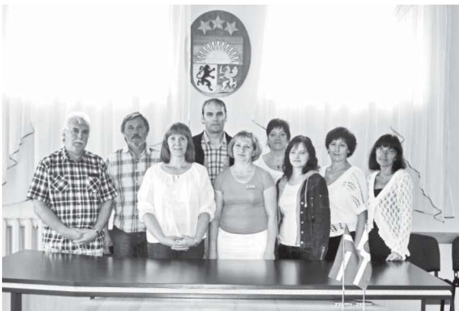
Ķeipenes pagasta pārvaldes (Ogres novads) un Neretas novada pašvaldības darbinieki.

Negaidītā vizītē 26. augustā Neretas novada pašvaldībā iegriezās Ogres novada pašvaldības Ķeipenes pagasta pārvaldes darbinieki. Viņu ceļa mērķis bija doties tālāk uz Aknīstes pusi, bet vēlme bija arī apskatīt Neretu.