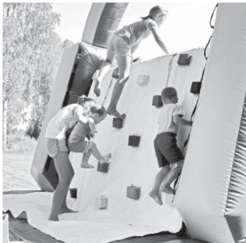
Bērni pasākuma laikā lēkāja piepūšamajā pilsētiņā, lielākie labprāt palīdzēja mazākajiem.