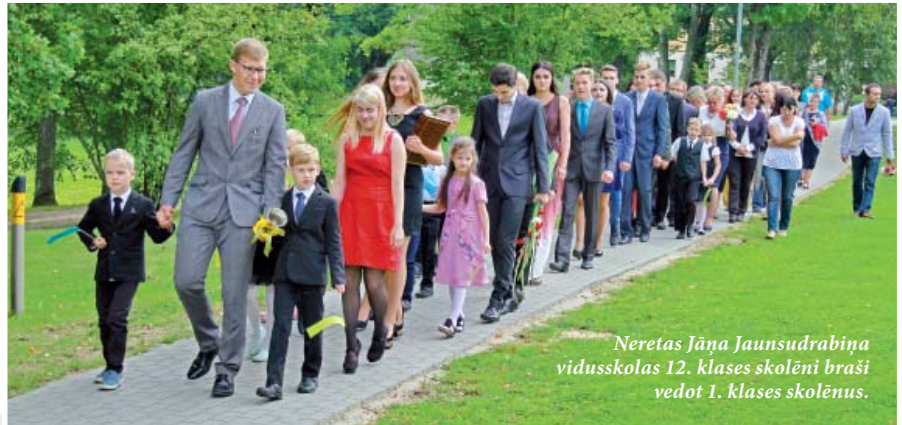
Neretas Jāņa Jaunsudrabiņa vidusskolas 12. klases skolēni braši vedot 1. klases skolēnus.

draugi dzīvnieki jāatstāj mājās, jo nu ir iesācies skolas laiks un būs jāsāk mācīties gudrības.