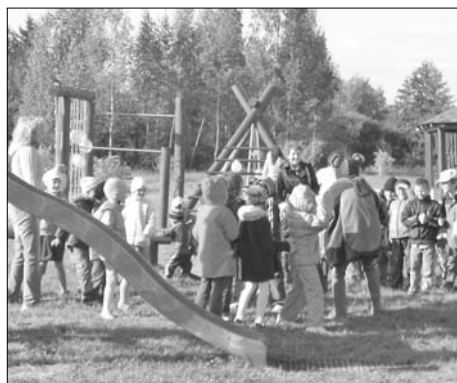
В восторге о сделанном учащиеся Яунсилавской основной школы и дети дошкольной группы.

17 сентября у Яунсилавской основной школы был открыт совместно реализованный проект работников школы, Туркской волостной управы и думы Ливанского края, общества «Preiļu partnerība» и родителей.