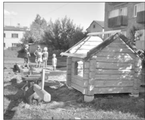
Создается домик Гномов, маленькие гномики наблюдают за рабочим процессом.

При содействии Hipotēku banka общество «Sabiedriskais centrs Rudzāti» реализовало проект «Сердечки Богооявления». Сейчас общество реализует два проекта в программе «Leader»: за средства ELFLA и софинансирование думы Ливанского края будет обустроено помещение бюро общества, которое общество арендует в Рудзатской средней школе. Дума Ливанского края для общества арендовало помещения на 2 этаже амбулатории, которые после упрощенной реконструкции и перепланировки будут использоваться коллектив Рудзатского театра «Okūts» для репетиций.