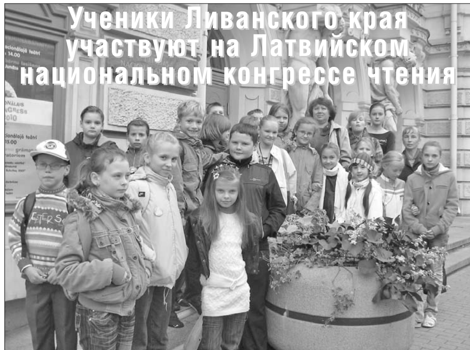
Участники национального конгресса чтения – ученики Ливанского края.

И руководство музыкальной школы, и воспитанники и их родители благодарны фонду Карела Буксела в Германии и Укермаркским евангелически-лютеранскими церквям за эту великолепную возможность и надеются, что и на III Международном конкурсе ливанчане получат призовые места, таким образом способствуя узнаваемости города Ливаны в Европе.