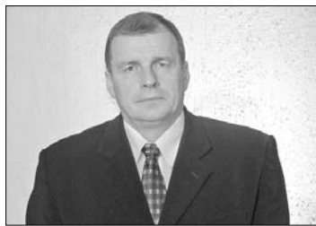
Здравствуй, на неделе Отечества!

Пусть разделяют латышей как хотят, мы хотим их видеть как единый народ. Народ и есть государство. Из классовых осколков мы должны стать единым народом, государством. Если мы этого не сумеем сделать, то тогда наш народ и еще через десятки лет будет стоять согнутой спиной и искалеченный как дерево без верхушки. Тогда он станет таким, каким его хотят видеть те, кто смотрел на него как на добычу и держали в своем рабстве. Нас может сплотить крепкое сознание народности.