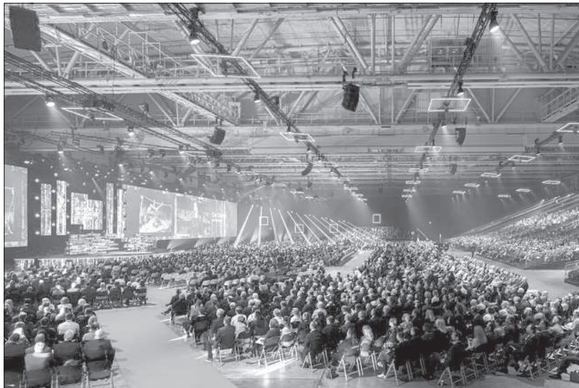
Бизнес-форум Северных стран Nordic Business Forum 2022 – бизнес-конференция мирового уровня проходит в Финляндии (Хельсинки). В этом году здесь собрались более 7 000 бизнес-лидеров из более чем 50 стран