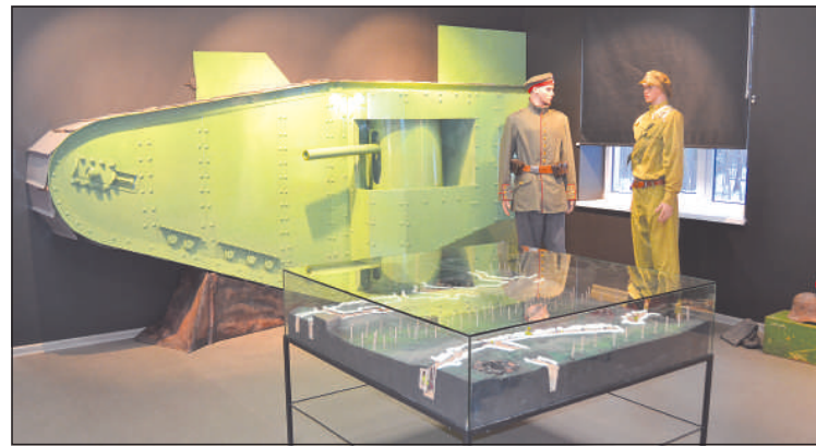
Экспозиция Медумского Музея Первой мировой войны.