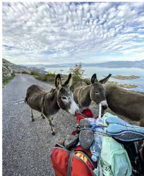
Skadaras nacionālajā parkā Melnkalnē.

„Vislabākā valsts šai ziņā ir Slovēnija, jo visur ir norādes un veloceliņi. Varēja just pret riteņbraucējiem lielu cieņu. Arī Albānijā ceļi bija ļoti labi.”