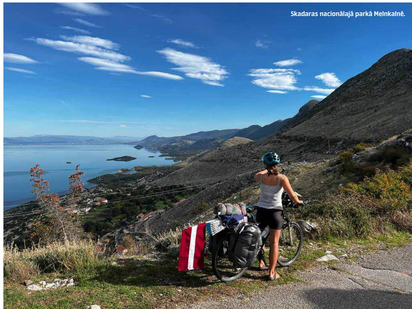
Skadaras nacionālajā parkā Melnkalnē.

Elizabete Rublāne Alises Krūmiņas arhīva foto