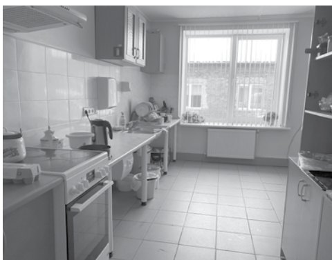
Virtuve ukraiņu bēgļu centrā, kas Kabilē izveidots agrākajā bērnudārzā. Iekārtas, traukus un pārtiku gādā pašvaldība, kristiešu draudze Zilais krusts un citi kabilnieki.