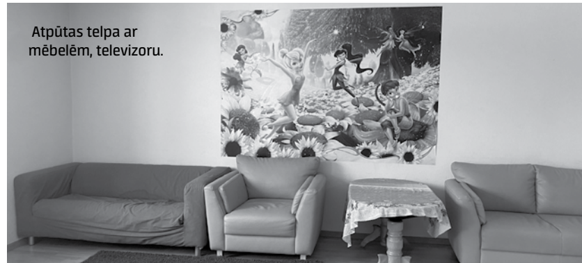
Atpūtas telpa ar mēbelēm, televizoru.