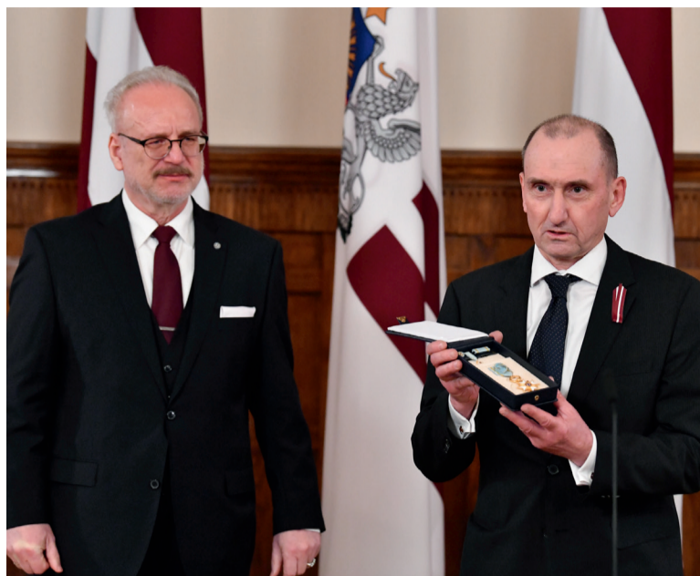
Valsts prezidents Egils Levits pasniedz valsts augstāko apbalvojumu Olafam Libermanim