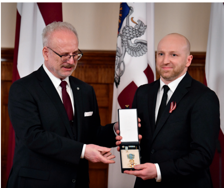
Valsts prezidents Egils Levits pasniedz valsts augstāko apbalvojumu Mārtiņam Malzubrim

Ukraina, karš, brīvība, palīdzība – šie ir 2022. gadā biežāk lietotie vārdi. Un aiz šiem vārdiem ir notikumi un cilvēki.