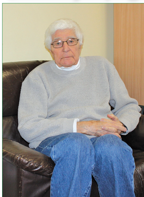
Laimons Niedres kungs tagad.

Uzskatāt sevi par Latvijas patriotu, nākušu no Auces apkaimes Vītiņu pusēs, vai varat pastāstīt par savām bērnības un jaunības gaitām? Kā zināms, esat beidzis arī Vītiņu sešgadīgo skolu, kas visvairāk palicis atmiņā?