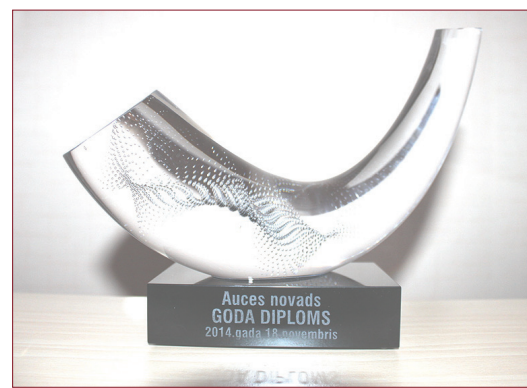
↑ Stikla skulptūra kā piemiņas velte stilizēta novada ģerboņa elementa, – pasta raga izskatā.

Gita Šēfere-Šteinberga Riharda Rudziņa foto