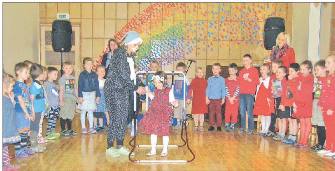
Dzied krāsainie „Rūķi” un „Kāpēcīši”.

Sandra Brūna, PII „Vecauce” skolotāja