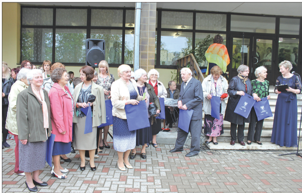
Tiek sveikti Auces vidusskolas pensionētie skolotāji.