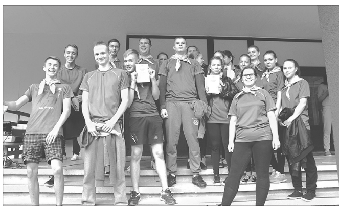
Auces vidusskolas 11. klases jaunieši.