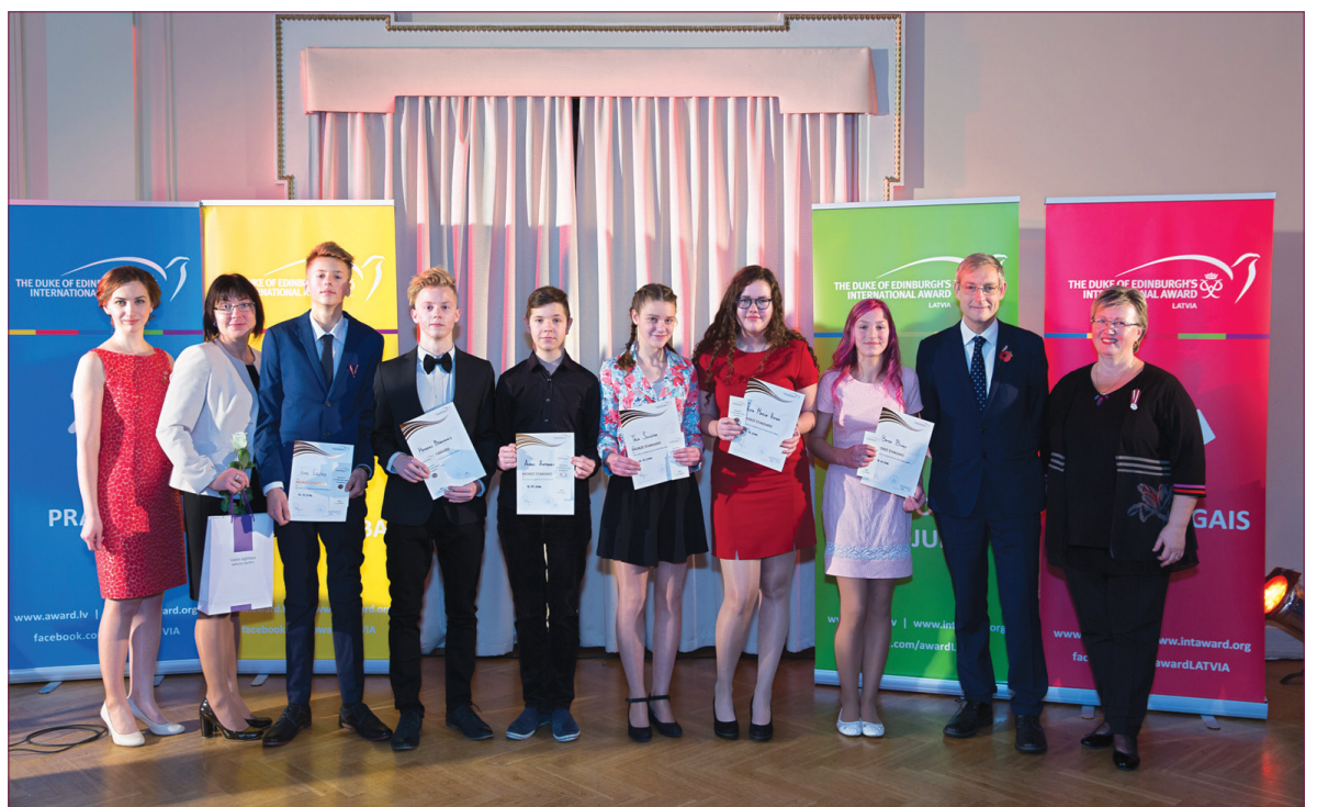
Auces vidusskolas Award vienība apbalvošanas ceremonijā.

Pateicoties Britu vēstniecībai un VISC, visiem apbalvojumu saņēmējiem un viņu vienību vadītājiem bija iespēja viesoties Brīvības pieminekļa Goda telpā, kur parakstījāmies Goda grāma-