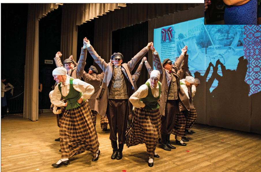
↑ Dejo Vitiņu Tautas nama VPDK „Robežnieki”.