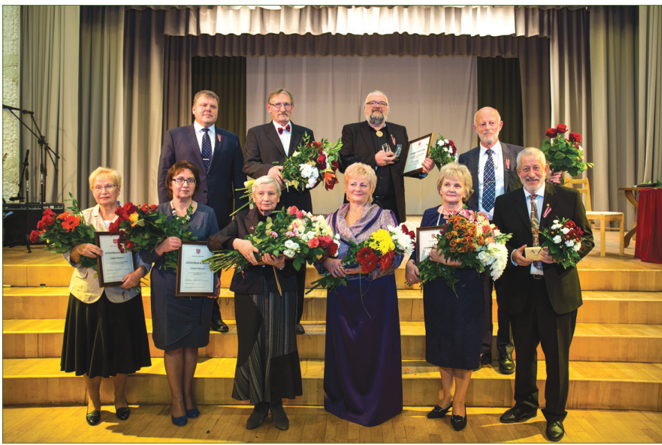
↑ Apbalvoto personu kopbilde Auces novada Kultūras centrā.