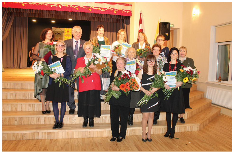
↑ „Bēne lepojas” diploma saņēmēšu kopbilde.