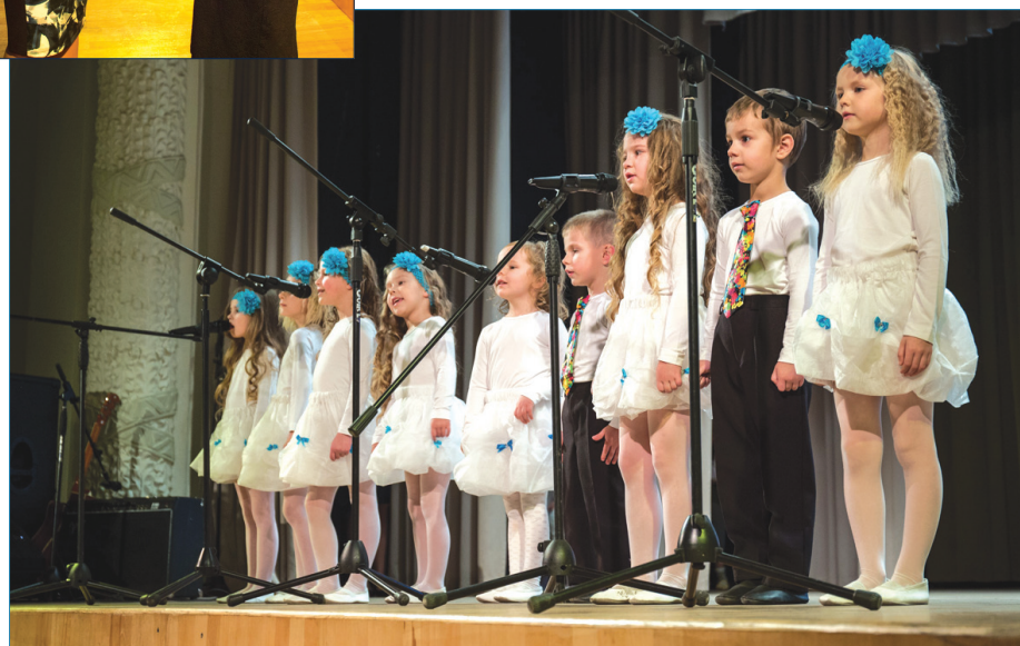
↑ Dzied PII „Pīlādzītis” audzēkņi.