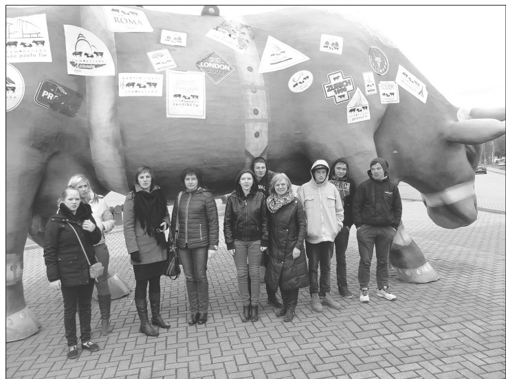
Projekta „PROTI un DARI” dalībnieki oktobra beigās devās uz Ventspili.

Kopš 2016. gada jūlija Auces novadā tiek īstenots projekts „PROTI un DARI!” (Nr. 8.3.3.0./15/I/001). Šī projekta īstenošana notiek ne tikai Auces novadā, bet lielākajā daļā no Latvijas pašvaldībām.