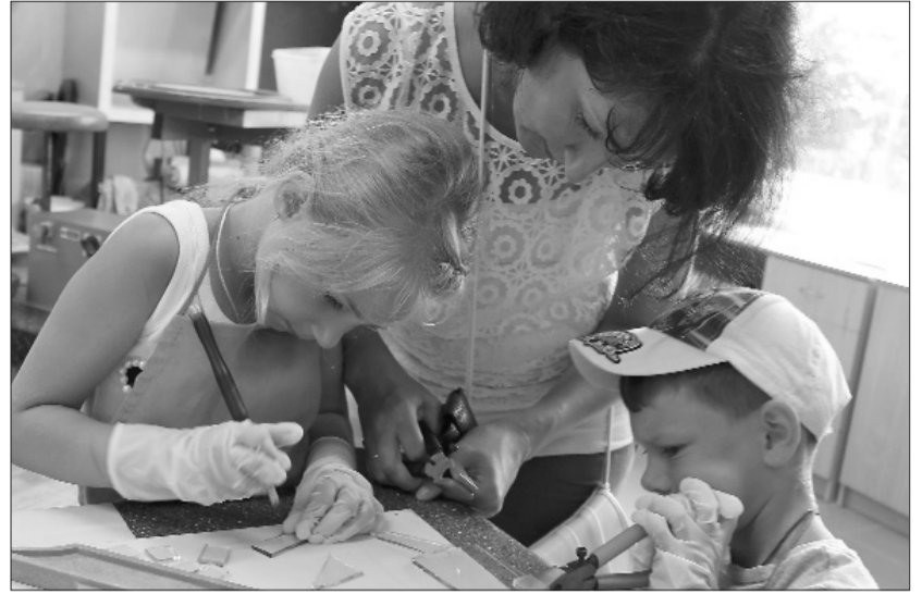
■ С большим увлечением изготовить свой – особенный и неповторимый – сувенир из стекла используют не только дети, но и взрослые.

Проект дал возможность приобрести рабочие инструменты и материалы. Организован кружок по выплавке стекла, где проходят регулярные занятия. Сейчас, по предварительной заявке, можно поработать в творческой мастерской не только индивидуально, но и в группе. Эта возможность активно используется. В мастерской имеются несколько комплектов инструментов, доступны материалы для работы со стеклом, участникам мастерской предлагают