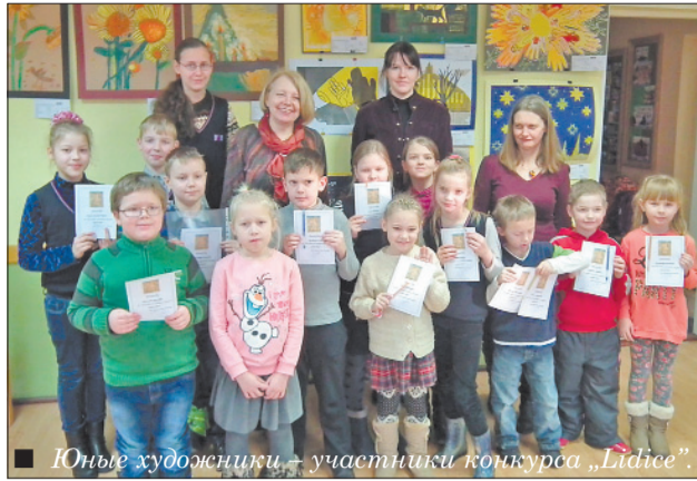
Юные художники – участники конкурса „Лидице”.

14 января в Ливанском ДЮЦ завершилась организованная ГЦСО выставка работ юных художников Ливанского краевого тура конкурса „Лидице - 2015”. ООН 2015 год объявил Годом света. Чешская национальная комиссия по UNESCO призывала 43-ий международную выставку-конкурс детского искусства „Лидице - 2015” посвящать теме „Свет”. Всего на конкурсе из школ Ливанского края приняли участие 38 участников. Для 2-го конкурсного тура в Риге были отобраны 36 работ юных художников, созданные в различных техниках. Спасибо за отзывчивость! Творческого успеха в дальнейших конкурсах и других художественных выражениях!