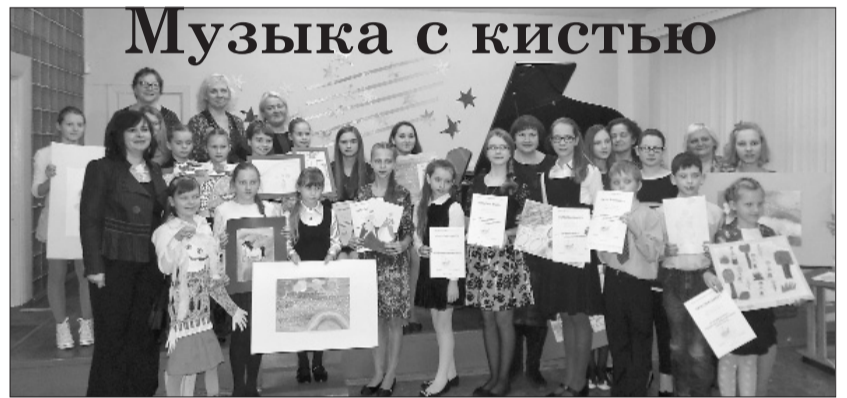
■ Фото: Эмоции, которые доставляет классическая музыка, можно выразить не только в звуках, но и в ярких картинах.

5 декабря, в Ливанской Музыкальной и художественной школе прошла музыкальная встреча воспитанников по классу фортепиано Даугавпилсской, Ливанской и Прейльской музыкальных школ. Мероприятие под названием „Музыка с кистью” получилось своеобразным и интересным. На сей раз вокруг флигеля на сцене были также располжены и мольберты, на которых были видны рисунки воспитанников. На них юные художники изобразили музыкальное произведение таким, каким он вообразил его во время изучения. У посетителей была возможность углубиться в детский мир музыкальных образов, рассматривая их рисунки, а также пометать и создавать их самим, слушая выступления