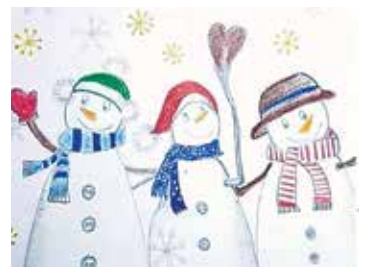
Tulkot.lv apsveikuma kartiņa.

2. decembrī tika apbalvoti bērnu zīmējumu konkursa “Eiropas Savienības ieguldījums Tavā drošībā” labāko darbu autori. Piedaloties konkursā, bērni tika aicināti vizuāli attēlot, ko viņiem nozīmē vārds “drošība”, cik droši viņi jūtas apkārtējā vidē un ko domā par drošību savā valstī, Eiropā un pasaulē.