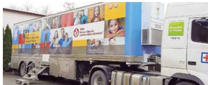
Mobilais kabinets pie Salaspils veselības centra.