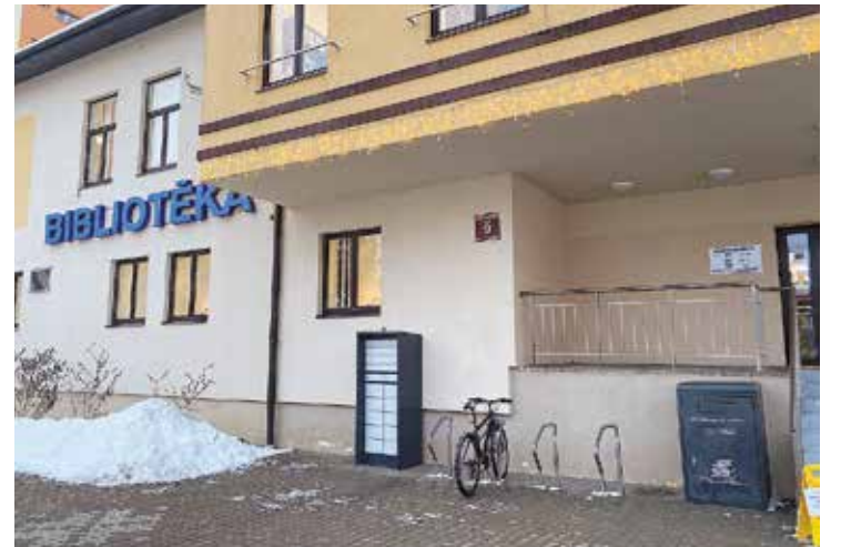
Bibliomāts pie Salaspils novada bibliotēkas.

Grāmatu bibliomāts darbojas pēc līdzīga principa kā visiem zināmie pakomāti sūtījumu saņemšanai. Salaspils novada bibliotēkā vai filiālēs reģistrēts lasītājs elektroniskajā katalogā vai pa tālruni 67943452, 26436442 var pasūtīt grāmatas vai citus iespieddarbus, bibliotekārs tos ievietos bibliomātā un lasītājs saņems izziņu ar unikālu durvju kodu. Jāatceras, ka pasūtīt grāmatu elektroniskajā katalogā, jāieliek atzīme par pasūtījumu saņemšanu bibliomātā.