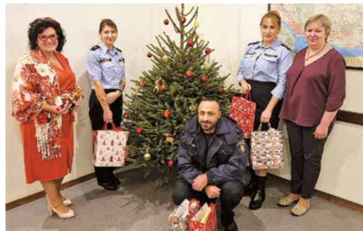
Salaspils Sociālā centra darbinieces kopā ar Valsts policijas Rīgas reģiona pārvaldes pārstāvjiem.

Paldies Valsts policijas Rīgas reģiona pārvaldes kolektīvam par sarūpētajām Ziemassvētku dāvanām Salaspils novada Sociālā dienesta klientiem! Kā arī pateicamies Salaspils novada pašvaldības Komunālajam dienestam par sarūpētajām eglītēm! Tās ir ļoti skaistas!