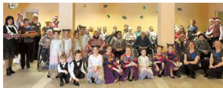
Viesojoties sociālās aprūpes centrā "Ziedugravas".

Šogad vēlējamies paši aizbraukt ciemos un dāvēt svētku noskaņu šajā Ziemassvētku gaidīšanas laikā. Laikā, kad dabā iestājas klusums un miers, kad arī cilvēkiem tik ļoti nepieciešams sirds siltums, laba vēlējumi un cerība.