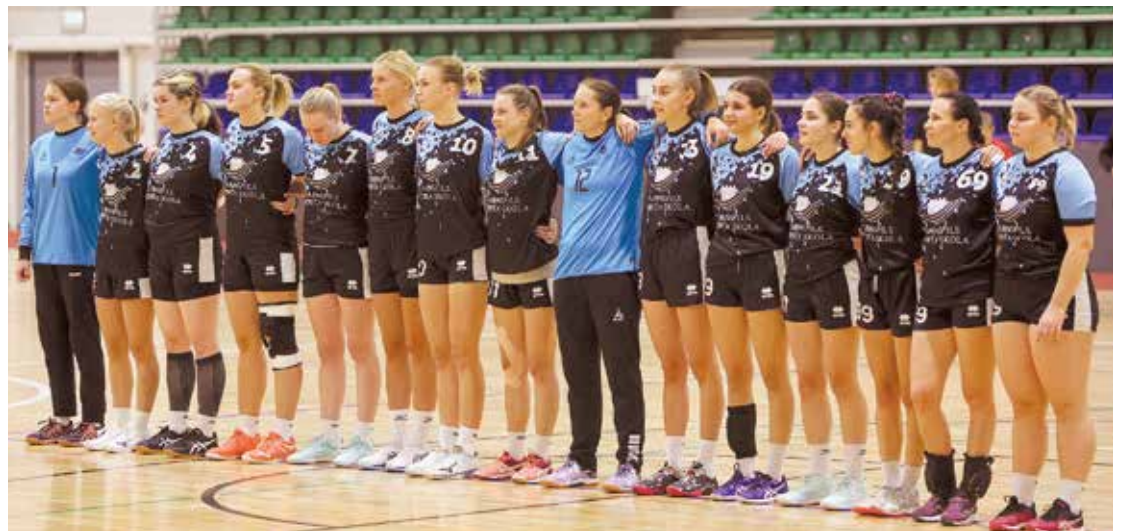
Salaspils sporta skolas handbolistes Sieviešu handbola virslīgā.