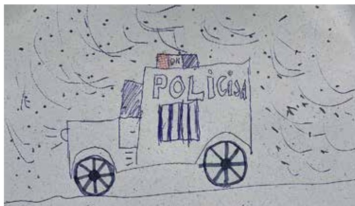
Salaspils 1. vidusskolas skolēnu apsveikumi – zīmējumi.