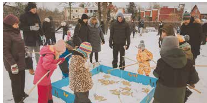
Svētku tematikas spēļu stacijas Rīgas Mūzikas un mākslas dārzā.