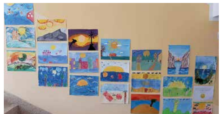
Vizuālās mākslas olimpiādes “Lec saulīte” darbi.