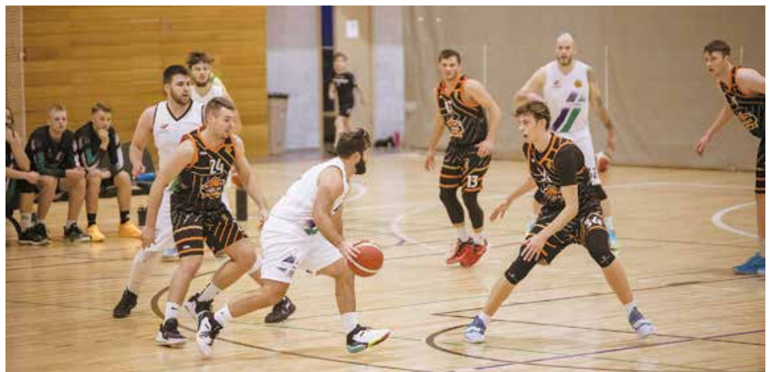
Salaspils sporta skolas RBL basketbolisti.