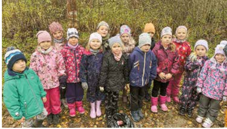
PII “Atvasīte” bērni.

Bērni no grupas “Skudriņas”, lai tuvāk iepazītu un izprastu šī mācību gada EKO tēmu “Transports”, devās ekskursijā uz Rīgas Motormuzeju, kur, klausoties gida aizraujošajā stāstījumā, uzzināja daudz interesantu faktu par auto vēsturi un tā attīstību līdz mūsdienām. Nedēļas turpinājumā čaklās “skudriņas”