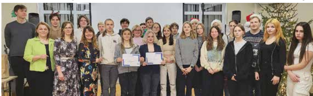
Hakatona “Skolotons 2022” dalībnieki un žūrija. Publicitātes foto

Īsi pirms svētkiem un skolēnu brīvlaika, noslēdzās 48 stundu darbs pirmajā Salaspils 1. vidusskolas rīkotajā hakatonā “Skolotons 22”. Tajā, piedaloties izaicinājumā, skolēnu komandas veica izpēti par kādu no tēmām, ko bija izvirzījuši skolotāji un skolēnu padome: papīra patēriņa samazināšana skolā, mobilo telefonu lietošana stundās un starpbrīžos, vai arī par skolēnu attieksmi pret skolas īpašumu un kultūralu attieksmi pret vidi, kurā mēs visi dzīvojam.