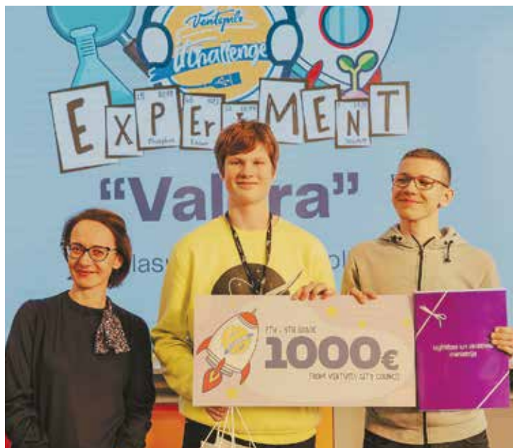
Salaspils 1. vidusskolas 9.c klases skolēnu komanda “Vaļera”. Publicitātes foto

Konkursa finālā kārtā iekļuva 46 erudītāko dalībnieku komanda