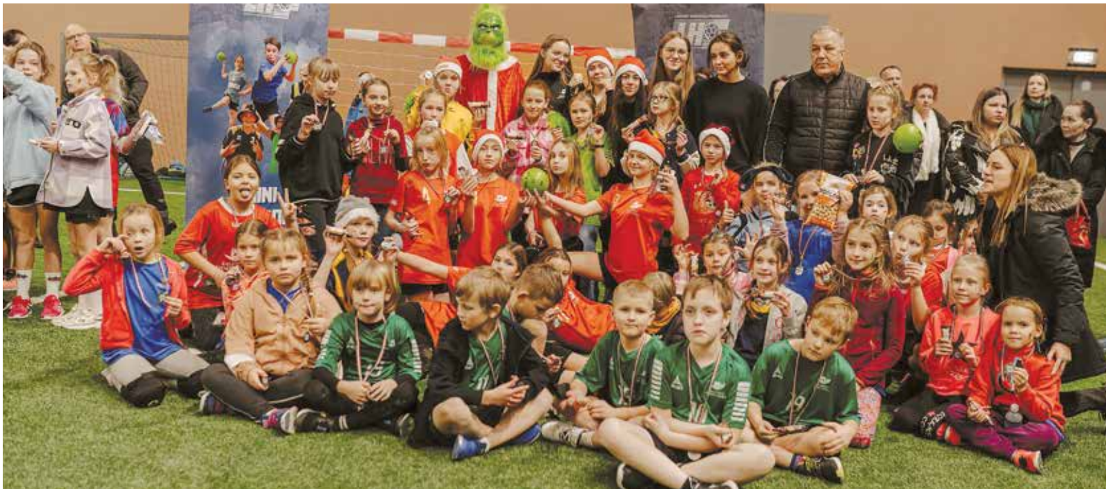
Salaspils sporta skolas minihandbolisti.

un pavadīt aktīvi laiku, piedaloties dažādās radošajās aktivitātēs, ko bija sarūpējusi Latvijas handbola federācija.