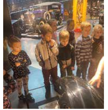
Ekskursija Rīgas Motormuzejā.

dauzveidību. Darbošanās laikā bērni konstatēja, ka mežā ir daudz atkritumu, un paši arī ierosināja sakopt tuvāko meža teritoriju, ko arī kopīgiem spēkiem paveica.