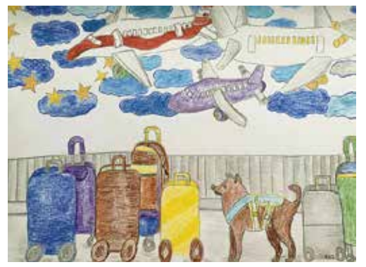
Zīmējums “Par drošiem lidojumiem”.