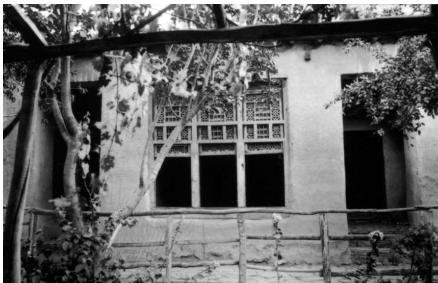
Один із будинків Бахаулли

та єдності, але це мало протилежні наслідки. Багато людей побачили, що Баб робив тільки добрі справи та не заслуговував на ув'язнення. Його вплив поширювався, і дедалі більше людей ставали Його послідовниками.