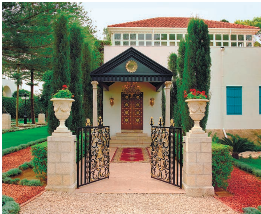
Місце спочину Бахаулли

очей, і мене сповнили почуття скорботи та печалі після того, як я почув ці слова. У цей момент Благословенна Довершеність наказав мені наблизитися до Нього, і я підкорився. Користуючись хусточкою, що була в Його руках, Бахаулла витер сльози з моїх щік».