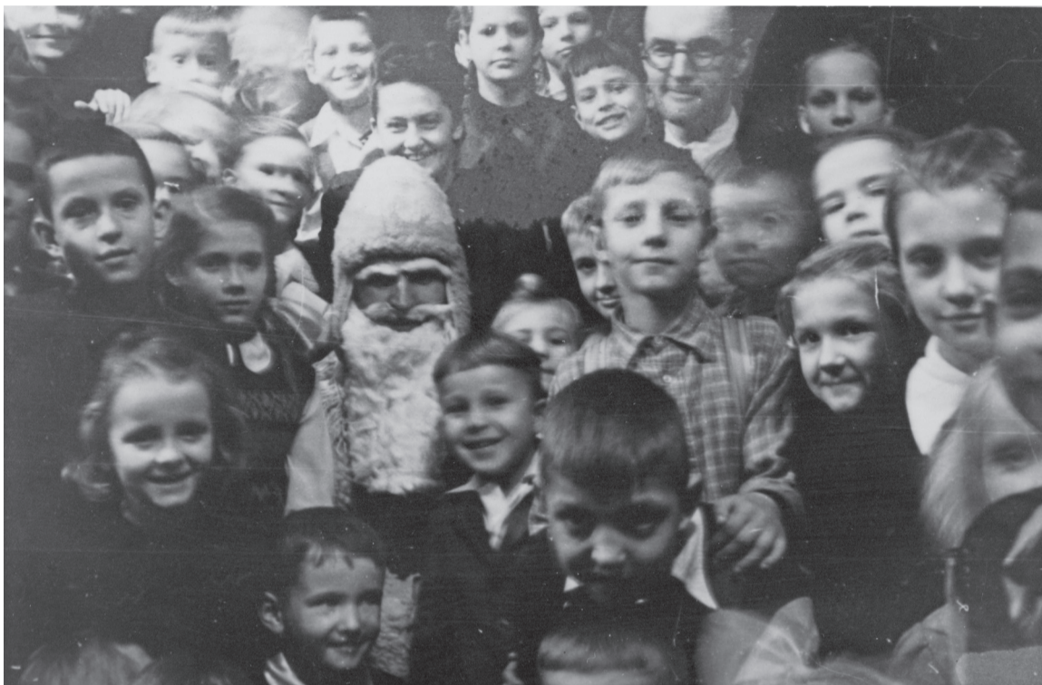
Bērni ar Ziemassvētku vecīti ap 1948. gadu bēgļu nometnē Ventdorfā, Vācijā

24. decembrā vakarā. Tiesa, Ziemassvētku vecītis kažoku un rakstainos dūraiņus nomainījis atbilstoši modei un tērþjas sarkani baltā tērþā.