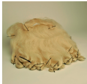
Ziemassvētku vecīša bārda