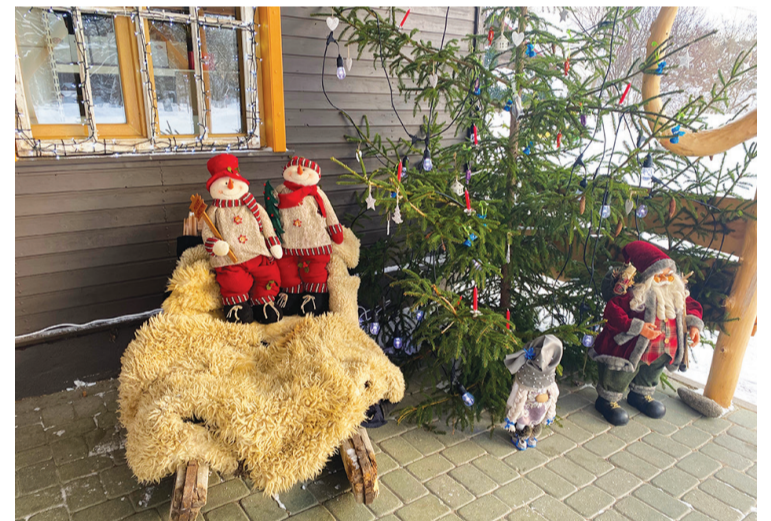
z/s „Selgas” Uguņciemā