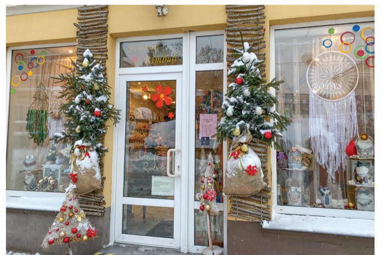
„Bimbuļi Rimbuļi” Talsos

šanas balvu saņēmēji saņems naudas balvu 50 eiro apmērā.