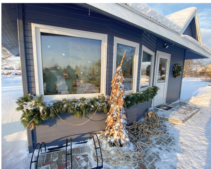
„Ziedu bode” – IK „Š. Tims” Mērsragā

kārt 3. vietas ieguvējs – ar Talsu novada Pateicību un naudas balvu 75 eiro. Valdemārpils, Stendes un Sabilē pilsētā katrā noteikts viens konkursa uzvarētājs, kurš apbalvots ar Talsu novada Pateicību un naudas balvu 150 eiro apmērā. Savukārt konkursa nolikuma 15. un 16. punktā neminētajās teritoriā-