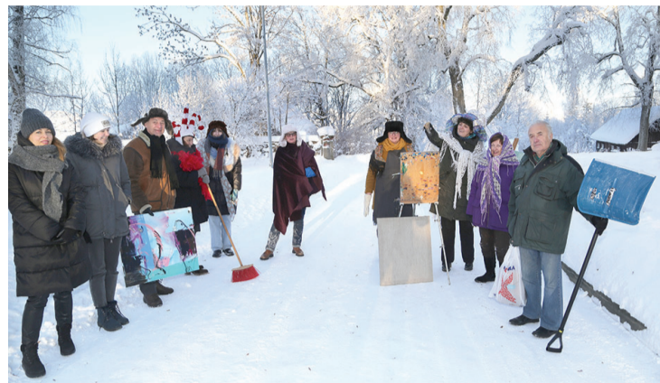
Projekta „Ziemas plenērs Tiņģeres muižā” dalībnieki.