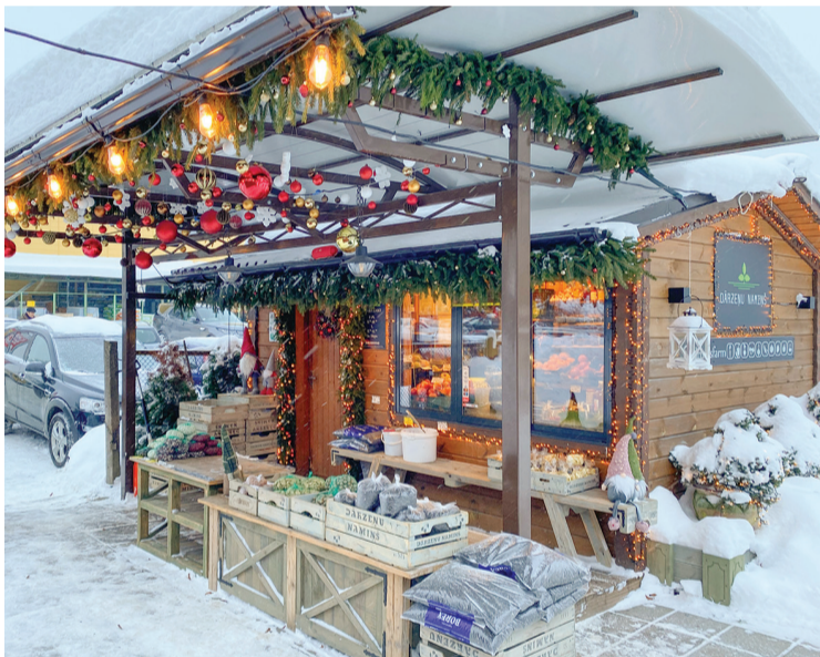
„Dārzeņu namiņš” Talsos