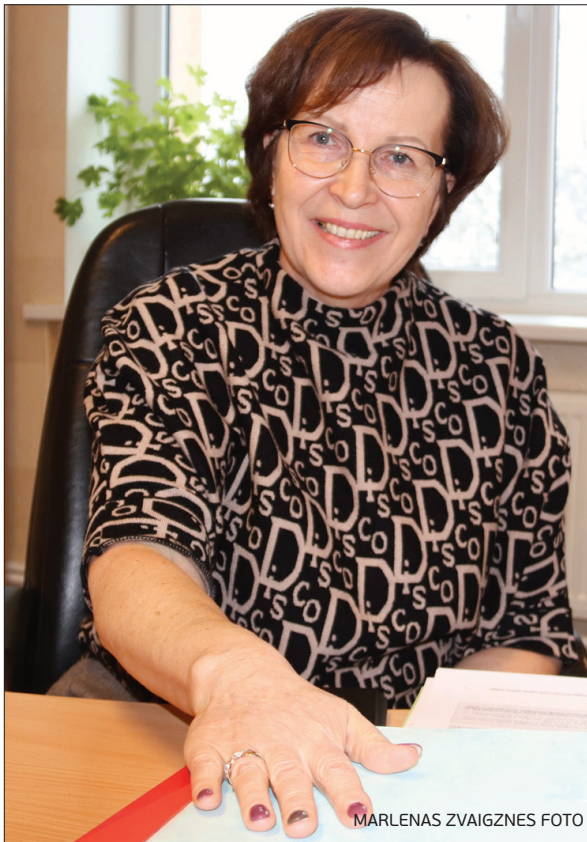
MARLENAS ZVAIGZNES FOTO