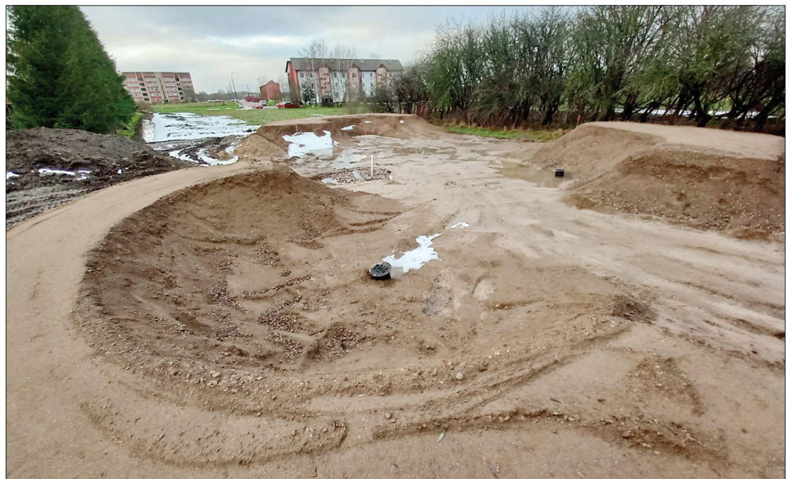
Jau šogad šajā vietā būs izveidota asfalta velotrase.

Atbalsta Zemkopības ministrija un Lauku atbalsta dienests