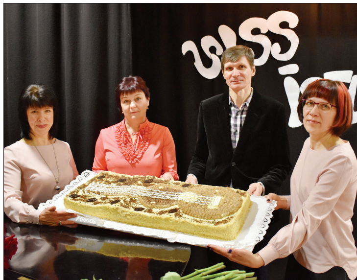
Puzes pagasta trio "Pa īstam" ar svētku kūku.