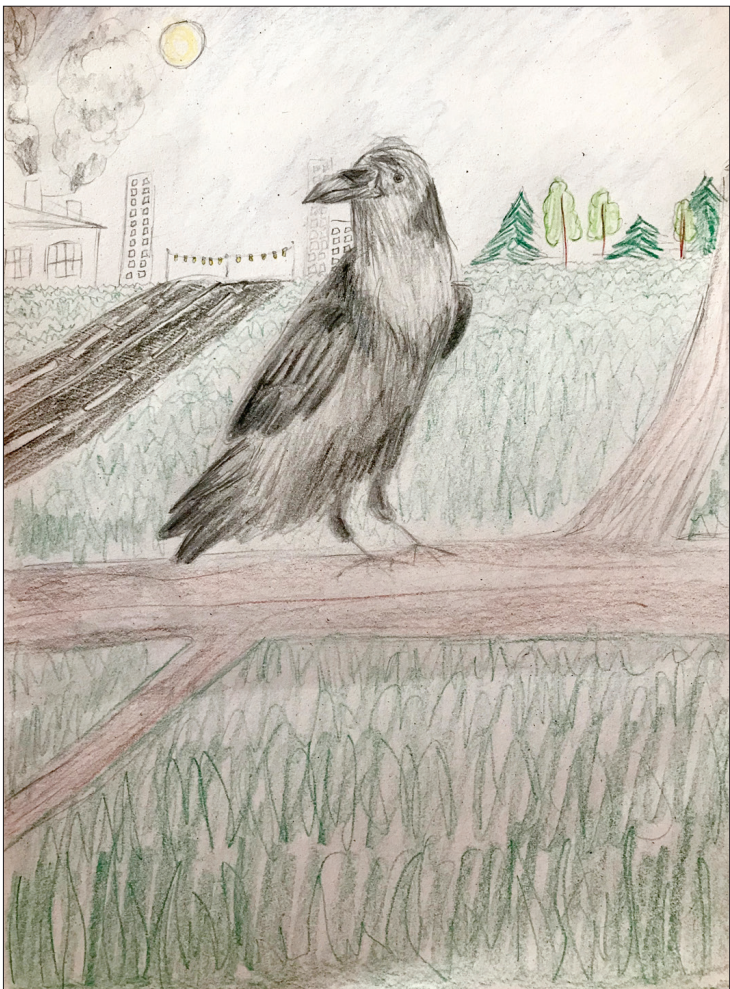
Elzas Brālītes uzzīmētais krauklis.