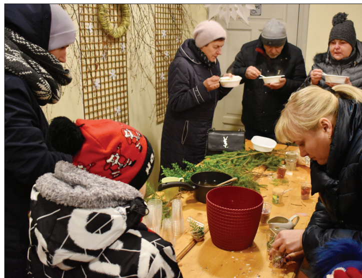
Tirdziņā varēja nogaršot nēgu zupu un piedalīties radošajās darbnīcās.