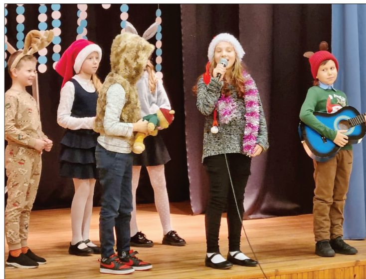
3. un 4. klases priekšnesums svētku noskaņā.

Pieaugušajiem, bērniem un jauniešiem par piedzīvojumu izvērtās sekojošā atkala ar jauniem izaicinājumiem. 6. decembrī skolēni piedalījās Latvijas Zaļās kustības jauniešu forumā "Piekrastes dabas daudzveidība" Zūru pamatskolā. Skolā valdīja īsta ziemas noskaņa. Sagaidīti un aizvadīti Ziemassvētki. Gaidot svētkus, katru Adventes pirmdienu skanēja dzēja un bērnu sagatavota dziesma. Ziemassvētku gaisotni radīja skolotājas Karīnas izveidotais svētku dekors. Pašpārvaldes dalībnieki izrotāja skolu ar baltām virtenēm, darbā iesaistot visus skolēnus. Darbojās Ziemassvētku pasts. Un tad jau tuvojās svētku pasākums – mēģinājumi un priekšnesumu gatavošana, kuros iesaistījās gan pašpārvaldes dalībnieki, gan vokālās studijas dziedātāji un klašu audzinātāji ar saviem skolēniem. Paldies skolēniem, skolotājiem un vecākiem, kuri palīdzēja un atbalstīja. Lai sekmīgi pabeigtu 1. semestri, īpaša uzmanība tika pievērsta mācību darbam. Par tradī-