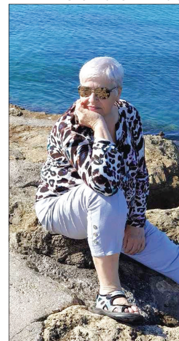
Ruta 2022. gada vasarā Francijā, Antibā.