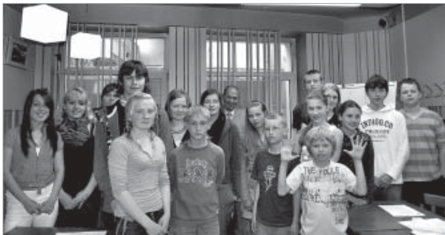
UNESCO eseju konkursa laureāti no Ādažu Brīvās Valdorfa skolas

„Domājot par eseju konkursa tēmu – izglītību, balvas nolēmām izvēlēties tā-