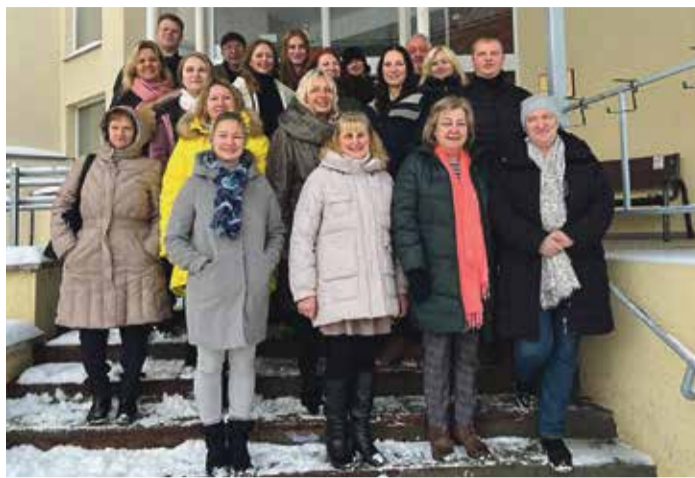
2022. gadā – Saulkrastu veselības un sociālās aprūpes centra daļa kolektīva kopējā pasākumā.

Ejot laikam, mainījās arī valsts un pašvaldības politika attiecībā uz finansējumu medicīnas iestādēm, īpaši tas skāra mazās slimnīcas. 2008. gadā valstiski tika izlemts slēgt 13 Latvijas mazās slimnīcas, kuru skaitā bija arī Saulkrastu slimnīca. Slimnīcai bija pilnībā jānostājas uz savām kājām, cīnoties par izdzīvošanu. Daļu finansējuma piešķīra pašvaldība, bet lielu daļu finansējuma iemācījāmies nopelnīt paši. 2021. gadā tika mainīts arī Saulkrastu slimnīcas nosaukums un juridiskais