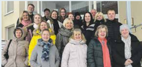
Saulkrastu slimnīcai 70!