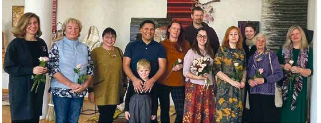
Audēju kopa „Kodaļa” izstādes „Satities, Sapities...” atklāšanā.

redzētas vairākas nodarbības, lai apgūtu aušanas pamatprasmes no pieredzējušiem, ilggadējiem un profesionāliem meistariem – velku sagatavošanu, šķērēšanu un steļļu iekārtošanu. Saulkrastu Kultūras