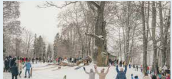
Par „Eiropas Gada koku Latvijā 2022” kļūst Sējas dižozols