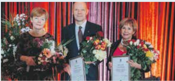
Valsts svētkos sumināti novadnieki