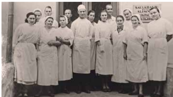
1958. gads. „Mācītājmuīža”, slimnīcas kolektīvs.

statuss. Saulkrastu slimnīca tika apvienota ar Saulkrastu sociālās aprūpes māju, kļūstot par pašvaldības aģentūru „Saulkrastu veselības un sociālās aprūpes centrs”.