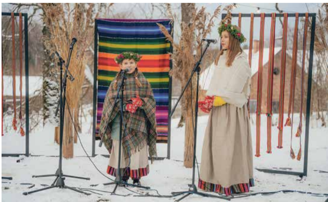
▲ Sējas Mūzikas un mākslas skolas audzēknes pie Sējas dižozola sniedza priekšnesumu.

Kopjot savu vēsturi, mēs kļūstam spēcīgāki.”