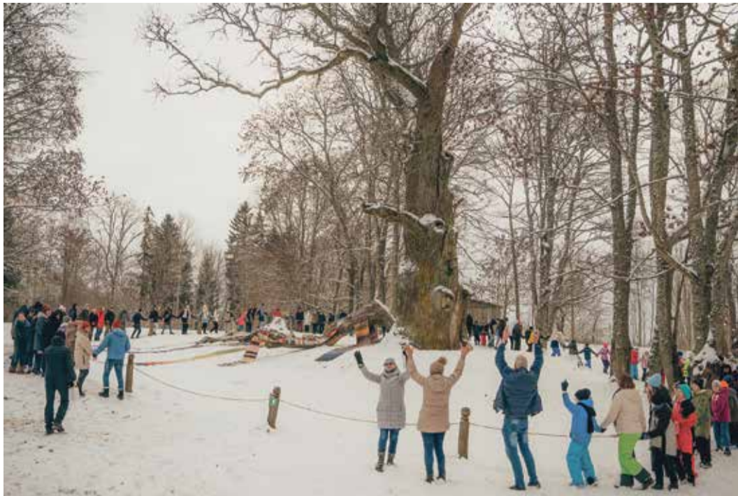
▲ Pēc balvu pasniegšanas pasākuma apmeklētāji vienojās kopīgā aplī, godinot Sējas dižozolu.