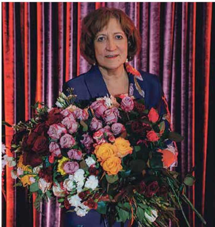
Saulkrastu novada vidusskolas pedagoģe Astrida Dineviča.