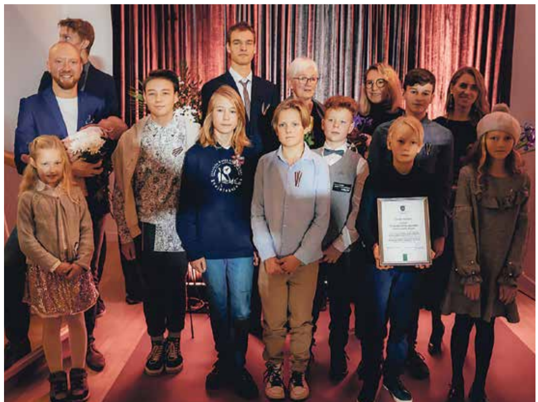
Biedrība „Zvejniekiema Jauniešu ūdens sporta klubs”.