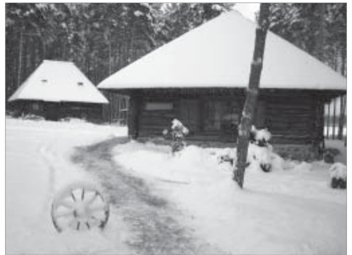
Viesu nams "Gungas"

Pateicoties plašajai ziedotāju atsaucībai, Ziemassvētku vecītim akcijas dažādajos pasākumos šogad nācās strādāt sviedriem vaigā,