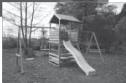
◀ „Baltezers Fani” projekts „Atpūtai un sportam”