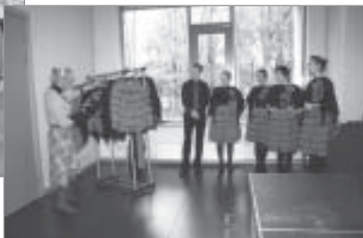
▲ „Jauniešu koris „Mundus”” projekts „Jauniešu kora „Mundus” skatuves tērpu šūšana”