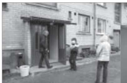
▲ „Mēs Jaunbērziņiem” projekts „Jaunbērziņu mājas labiekārtošana”