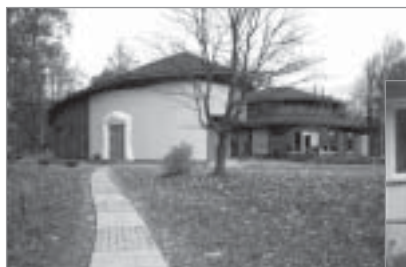
▲ „Ādažu Brīvā Valdorfa skola” projekts „Ādažu Brīvās Valdorfa skolas parka celīņa iekārtošana Ādažu centrā”