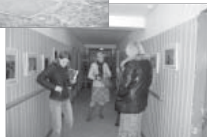
▲ „Ādažu 1. fotogrūpa” projekts „Foto arhīva „Ādaži, Ādažu cilvēki” veidošana”

Izvērtējot visus projektu iesniegumus pavasarī, konkursa žūrijas locekļi skatījās, lai projekti atbilstu konkursa galvenajai būtībai – lai iedzīvotāji var izstrādāt un īstenot projektus, kas dod iespēju iedzīvotāju grupām saviem spēkiem uzlabot savu dzīvi un dzīves kvalitāti. Apmeklējot atbalstītās projektu