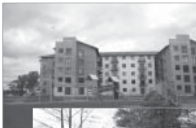
◀ „Podnieku kaimiņi” projekts „Bērnu priekam”