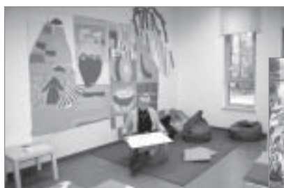
▲ „Radošu speciālistu grupa” projekts „Trīs krāsas, septiņas notis”

Projektu īstenošanai tika atvēlēts salīdzinoši neliels laika posms – tie bija jābeidz līdz septembra vidum, taču, kā pārliecinājās konkursa žūrija apmeklējuma laikā projektu īstenošanas vietās, gandrīz visas grupas spēja iekļauties noteiktajā laikā un sasniegt projektu pieteikumos izvirzītos mērķus. Konkursa ietvaros tika īstenoti šādi projekti: