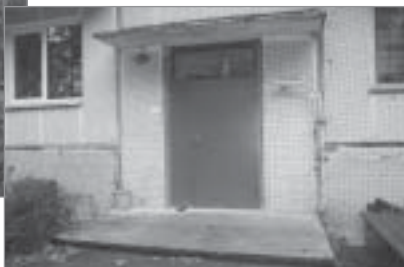
◀ „Atmodas” projekts „Draudzīgi videi!”