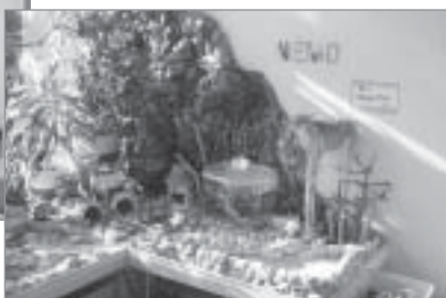
▲ „Audzītes” projekts „Tropu māja”