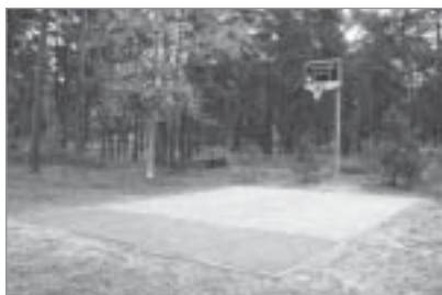
◀ „PROGRESSIO” projekts „Sportiskai Kadagai”