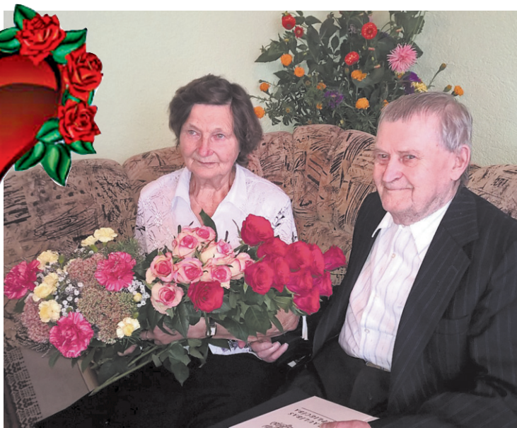
■ Laimīgā laulībā nodzīvoti 60 gadi

Самая большая радость и самое большое богатство в жизни юбиляров это их близкие и родные люди – дети, внуки, правнуки, фотографии которых всегда на почетном месте. Дума Ливанского края и Туркская волостная управа сердечно поздравляют супругов с этой знаменательной датой и желают силы, здоровья и еще много счастливых лет супружеской жизни в кругу своих родных и близких!