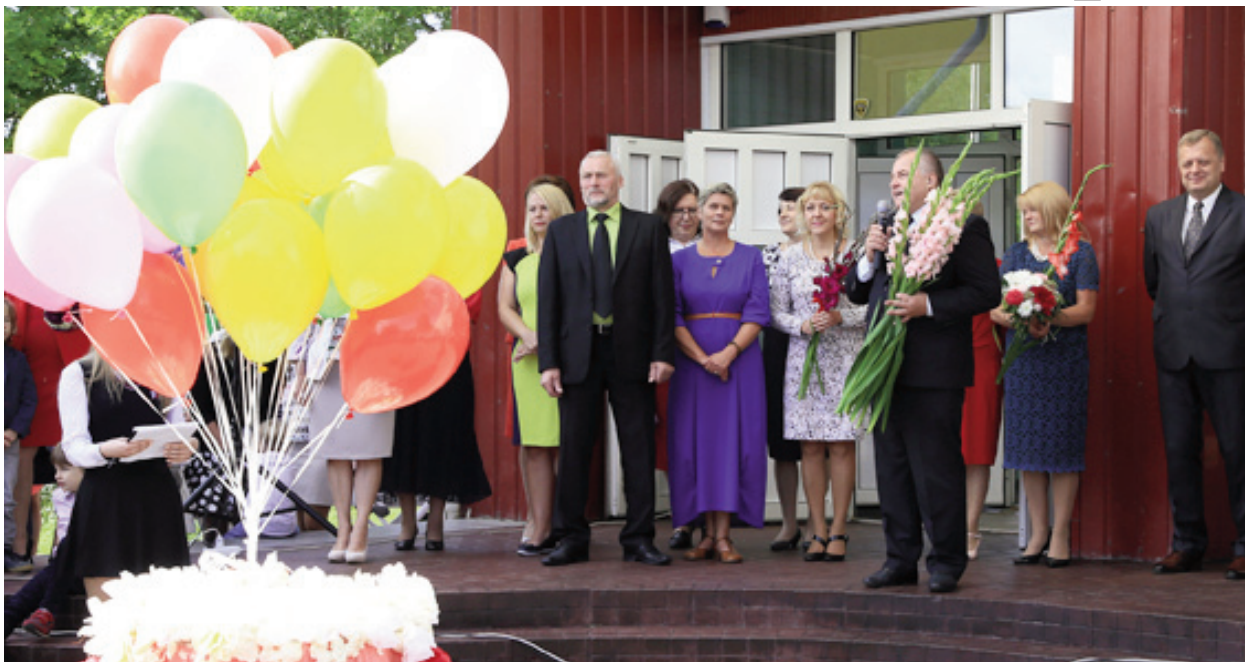
Мероприятие Дня знания у Ливанской 1 средней школы

Завершая 2015/16 учебный год в Ливанском крае, учреждения общего образования закончили 184 выпускника, из которых основное образование получили 106, а общее среднее образование – 78 учеников. Результаты выпускников средних школ Ливанского края на обязательных централизованных экзаменах по латышскому языку, математике, иностранных языкам в целом намного выше по сравнению со средним баллом в стране. По сравнению с результатами централизованных экзаменов прошлых лет, уровень знаний учащихся повысился по английскому языку и латышскому языку, но в крае, также как и в стране в целом, снизились результаты по математике, химии, а также биологии.