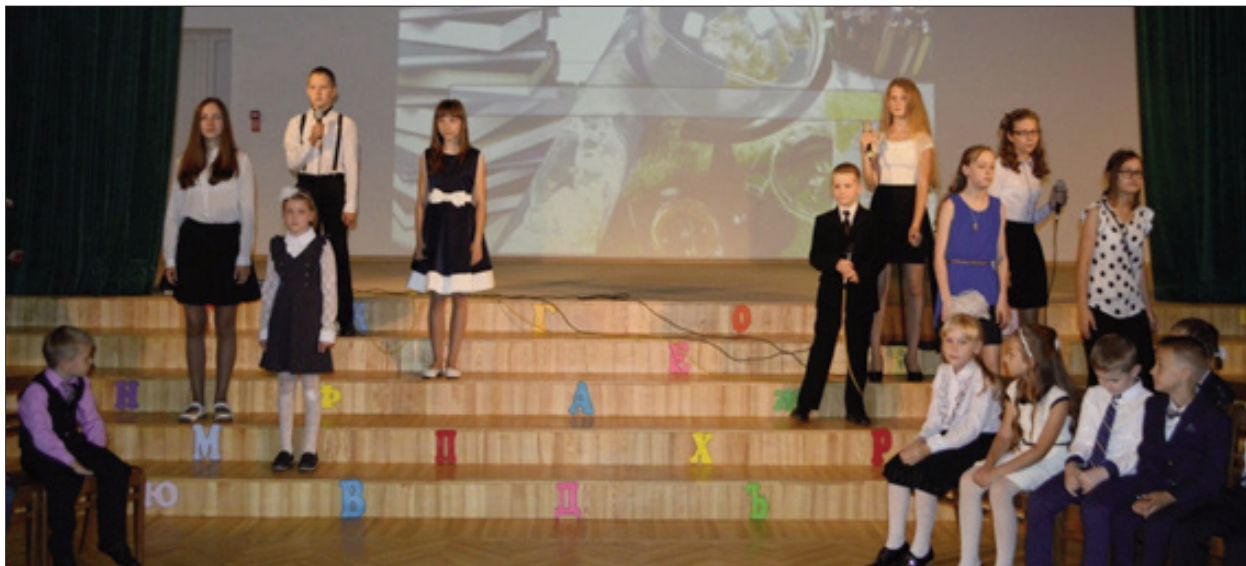
Мероприятие Дня знаний в Ливанской 2 средней школе – выступает школьный вокальный ансамбль

Пусть у каждого будут большие и маленькие цели, предприимчивость и настойчивость в их осуществлении!