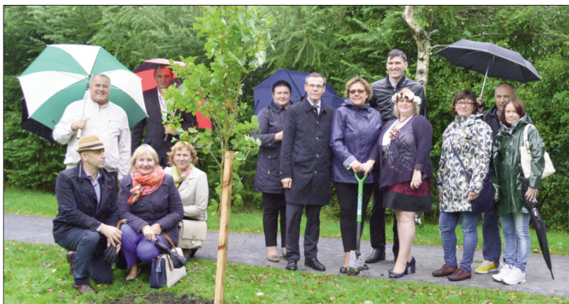
■ Посаженный дуб – символ дружбы между Латвией и Ирландией

Одно из самых значимых событий в рамках этого мероприятия стало подписание договора о сотрудничестве между графством Мейо и Латвийско-ирландской Торговой Палатой, Ассоциацией латышей в Ирландии „LatWest”, а также самоуправлениями Ливанского, Дагдского, Карсавского и Рибеиньского краев. Как символ дружбы между Латвией и Ирландией латышские гости вместе с представителями графства Мейо в местном сквере посади дерево дружбы - дуб.