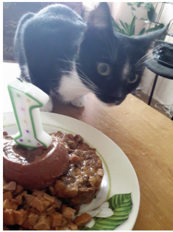
■ Торт 1-го дня рождения выброшенного в прошлом году в мусорный контейнер котенка

О буднях общества рассказывает основатель общества и