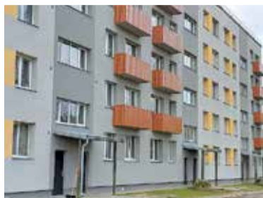
Māja pēc renovācijas Miera ielā 16 k-8.

Sākoties apkures sezonai, iedzīvotāji ar bažām gaida rēķinus. Pieaugot dabasgāzes cenai, arī apkures rēķini paaugstinās. Nerenovētās daudzstāvu ēkas turpina novecot un ar katru gadu kļūst mazāk efektīvas, līdz ar to pieaug arī rēķini par apkuri. Savukārt namos, kas renovēti, rēķini par apkuri ir mazāki, iespējams pašiem regulēt un uzturēt arī komforta temperatūru, kā arī renovācijas gaitā uzlabotais ēkas tehniskais stāvoklis būtiski samazina tās uzturēšanas izmaksas.