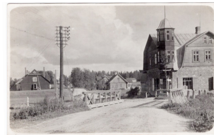
Liezēres centrs. 1920.-1930. gadi.