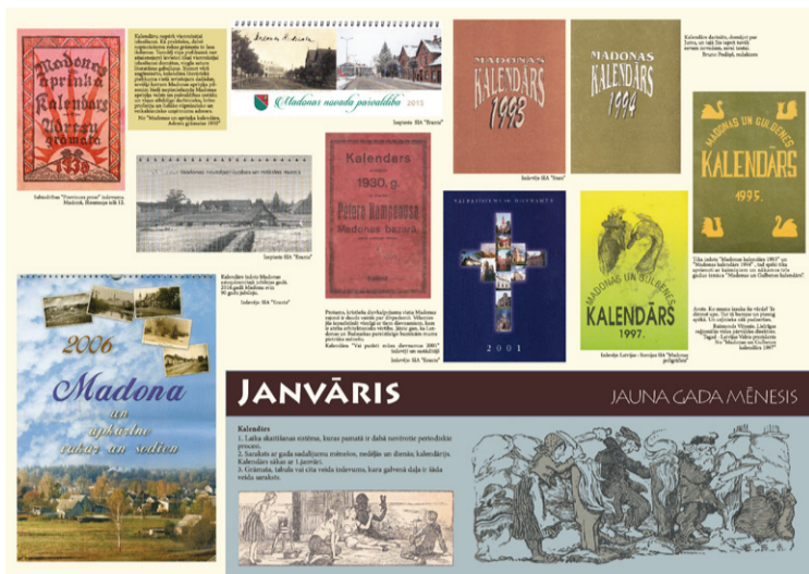
Ceļojošās izstādes "Kalendāri" fragments.

Plaša tematika, resursu racionāla izmantošana, dažāds apjoms un pieejamība – tas ir par ceļojošajām izstādēm. Arī pirms vairāk kā desmit gadiem sagatavotās izstādes joprojām ir pieprasītas. Dažu izstāžu apjoms ir tikai četras planšetes, citu – vairāki desmiti. Tā ka reizēm izvēle notiek atkarībā no telpas iespējām, kur tās plānots izvietot. Lielākā daļa izstāžu vispirms ir bijušas eksponētas Madonas muzeja izstāžu zālēs, bet pēc tam tās apskatījās cilvēki, kas dzīvo visai tālu no citos novados. Pagājušā gada sākumā piedāvājām divdesmit sešas ceļojošās izstādes. Pēc tam pie-