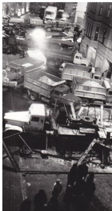
Dzirnavu iela barikāžu laikā.