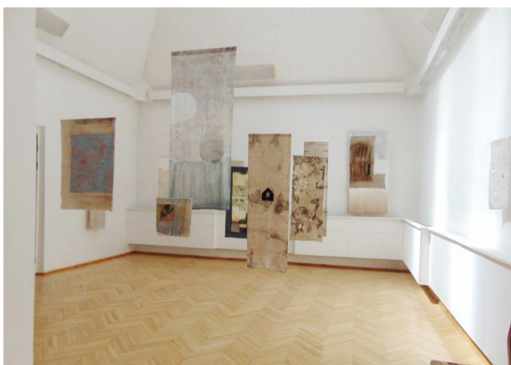
Foto no Vidzemes mākslinieku izstādes 2012. gadā.

Katra vieta rada savu ritma, krāsu un kontrastu izjūtu. Madonas ikdienas krāsas atšķiras no Gulbenes, bet Rūjienas – no Valkas un Valmieras – no Alūksnes. Vidzemes mākslinieku izstāde ir kopā sanākšana, savstarpējā satikšanās, arī jaunas iepazīšanās