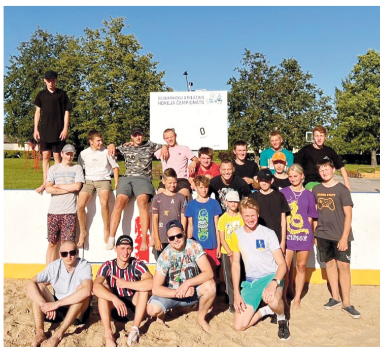
Attēlos: Jauniešu realizētās idejas 2022. gadā.