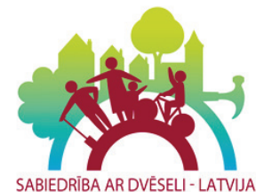
SABIEDRĪBA AR DVĒSELI - LATVIJA

K onkursa mērķis – uzlabot dzīves kvalitāti fiziskajā un sociālajā jomā Ropažu novadā, veicināt novada iedzīvotāju iniciatīvu un atbildību par savu dzīves vidi, kā arī veicināt iedzīvotāju līdzdalību apkārtnējās vides sakārtošanā.