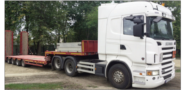
■ Услуги транспортировки крупногабаритных, негабаритных грузов и различной техники.

Предприятие Ливанского края RNS-D Transporting информирует жителей о новом виде услуги: транспортировка крупногабаритных, негабаритных грузов и различной техники. Больше информации обращайтесь лично по адресу: Ливаны, ул. Дзелзеля, 19, или позвонив по телефонам 25442444 и 27877037, а также написав по адресу: rnsd.transporting@inbox.lv