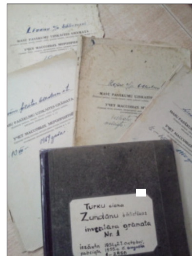
■ История говорит посредством ветхих инвентарных книг. Эта датирована 1951 годом.

Спасибо всем, кто поддерживали, друзьям, посетителям, спасибо за прекрасное мероприятие, уютную атмосферу! Пусть это сотрудничество продолжается!