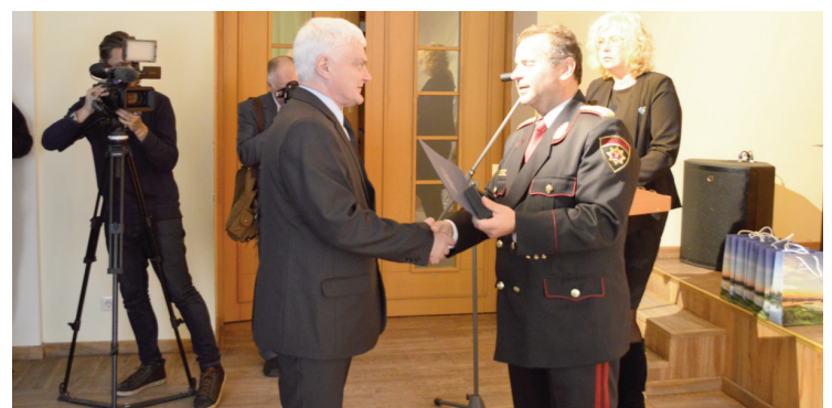
■ Знаки почета МВД вручает заместитель председателя Государственной Пожарно-спасательной службы (ГПСС) Интарс Зитанс.

Почетный знак Министерства внутренних дел ЛР 3 ноября был присвоен более 70 жителям Ливанского края, из которых на мероприятии присутствовали примерно 50, а остальным он будет передан при посредничестве Социальной службы Ливанского края. Награду – почетный знак и подписанную министром благодарностью каждому лично вручил заместитель начальника Государственной Пожарно-спасательной службы Интарс Зитанс. С речью также обратился президент объединения „Сernobiļa” Арнольд Арвалдис Верземниекс. Председатель думы Ливанского края Андрис Вайводс в своем выступлении подчеркнул, что это был героический поступок, который повлек за собой тяжелые последствия для здоровья людей. Большая часть спасателей были вызваны принудительно, но были также и добровольцы. Многие тогда не осознавали последствия, которые оставит проведенное в Чернобыле время на здоровье и качество жизни. Поэтому каждый, кто принимал участие в ликвидации последствий аварии, заслуживает самое глубокое уважение и благодарность за проявленное мужество в критические минуты. Пусть это происшествие для каждого станет уроком, насколько тяжелыми могут быть последствия человеческой беспечности и безответственности, подчеркнул А.Вайводс.