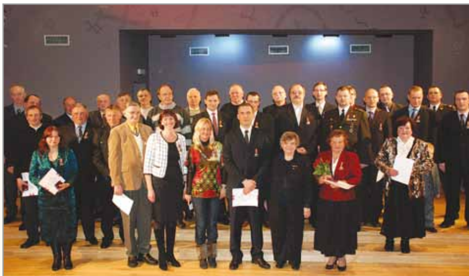
1991. gada barikāžu dalībnieku piemiņas zīmes saņēmēji