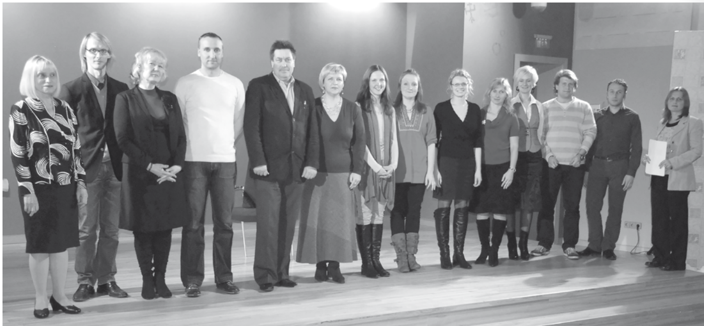
Vērtēšanas komisijas pārstāvji un konkursa „Sabiedrība ar dvēseli 2011” Ādažu novadā projektu grupu vadītāji