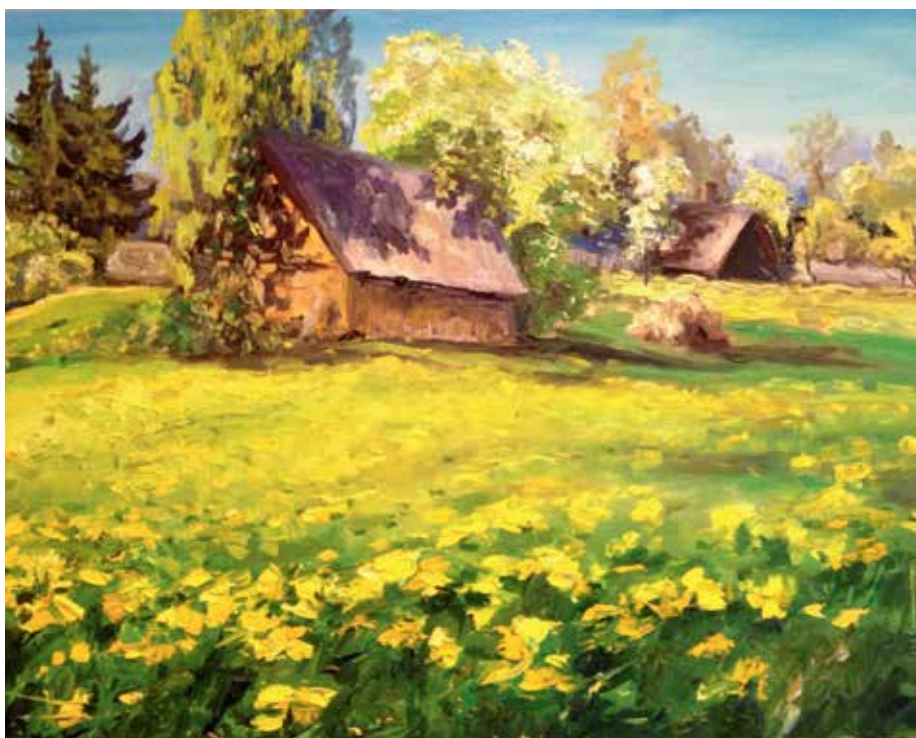
Skats no kādas ceļmalas Kadagā.

” Kādreiz ikviens prata izcept maizi un uzcelt sev māju. Kā ir šodien?