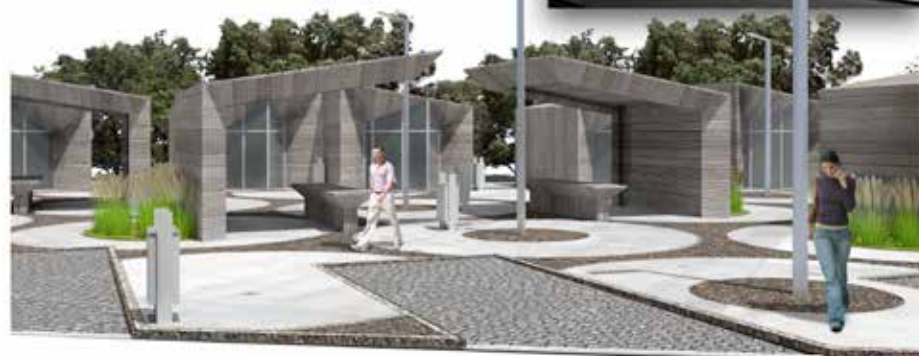
Projekta autors – SIA "CORE projekts"

nojumes tiktu veidotas koka konstrukcijās ar koka dēļu apdari, teritorijas iezīmēšanai paredzēts izmantot gludo betonu un betona laukums ar tajos iestrādātu oļu virskārtu. Paredzēts izveidot individuāla dizaina gaismas ķermeņu tīklu. Laukumos starp betona segumu un koka