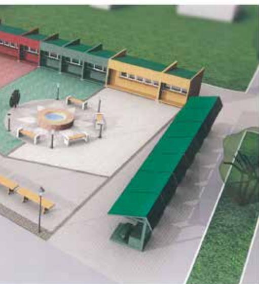
Projekta autors – SIA "Baltex Group"

SIA "Baltex Group" projektā tirdzniecības vietas plānots izvietot pa perimetru, tādējādi atbrīvojot centrālo daļu publiskām aktivitātēm. Gadatirgu laikā brīvajā teritorijā paredzēts izvietot galdus. Ikdienas vajadzībām domāts uzstādīt tirdzniecības kioskus, stacionāru paviljonu un ziedu galdus. Kioskus paredzēts veidot kā mobilus moduļus uz pamatu pēdām. Ideja paredz moduļu krāsojumu košos toņos. Paviljons paredzēts kā stacionāra būve, kurā ielānātas trīs tirdzniecības telpas un plaša terase. Autostāvvietas plānots izvietot gar laukuma ārmalu visā tā garumā. Domāts izbūvēt stacionāru WC un tirgus inventāra noliktavu. Laukuma iesegumā tiktu izmantots dažādu toņu betona bruģis funkcionāli zonējot laukumu. Kā akcentējošs elements bruģi tiktu izveidota ūdensrozes mozaika, kuras centrā plānots neliels ūdens baseiniņš, soliņi un apgaismes ķermeņi, vides objekts – metāla veidota ūdensrozes lapa.