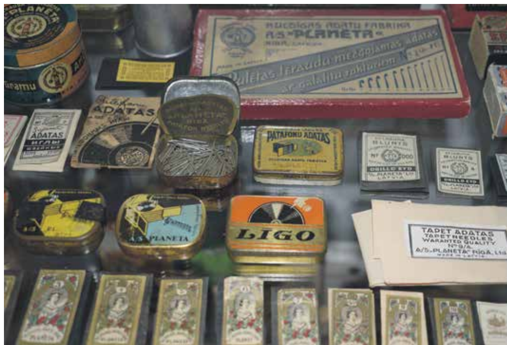
Daļa no adatu kolekcijas, starp tām arī Kuldīgas adatu fabrikas ražotās patafona adatas.