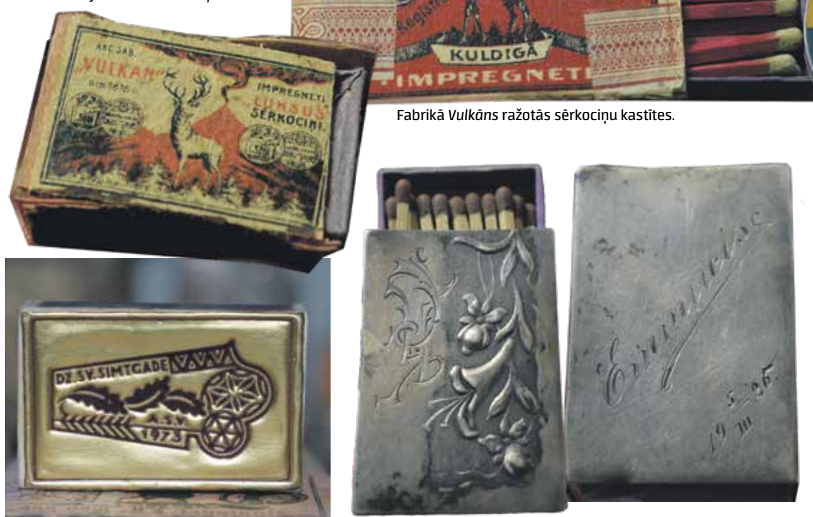
Fabrikā Vulkāns ražotās sērkociņu kastītes.