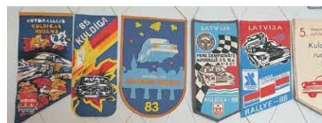
Vimpeliši no rallijiem Kuldīgas rudens .

„Man būtu prieks, ja es varētu izrādīt visu kolekciju.”