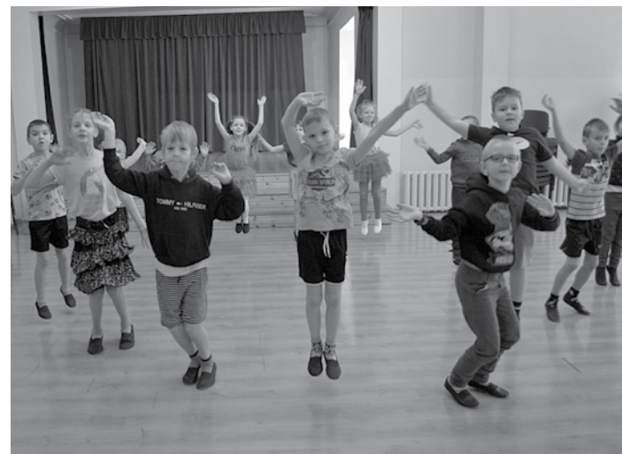
Vārmes pamatskolas 1. klases bērni tautas deju nodarbībā.