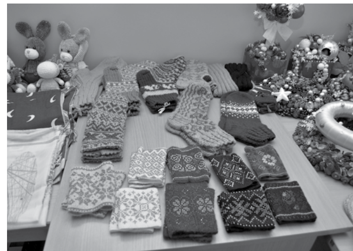
Vārmes bibliotēkā līdz decembra beigām skatāma iedzīvotāju darināto rokdarbu izstāde.

Vārmes bibliotēkā līdz gada beigām var aplūkot rokdarbu izstādi, kurai darbus darinājuši vietējie pagasta iedzīvotāji.