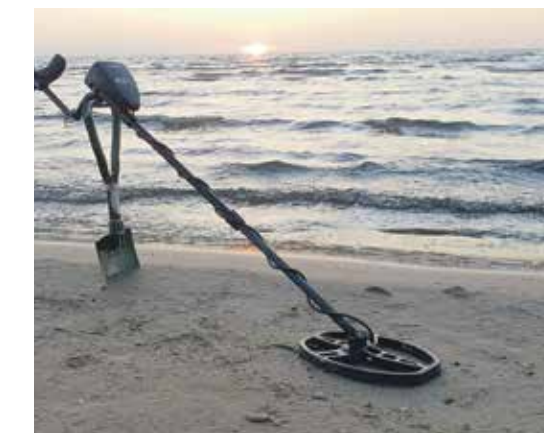
Šajā sezonā, pastaigājoties gar jūru ar metāla detektoru, savākti 108 eiro.