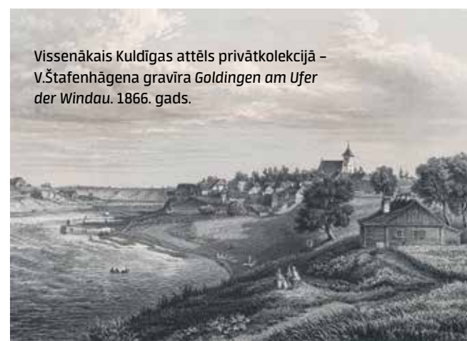
Vissenākais Kuldīgas attēls privātkolekcijā – V.Štafenhāgena gravīra Goldingen am Ufer der Windau . 1866. gads.