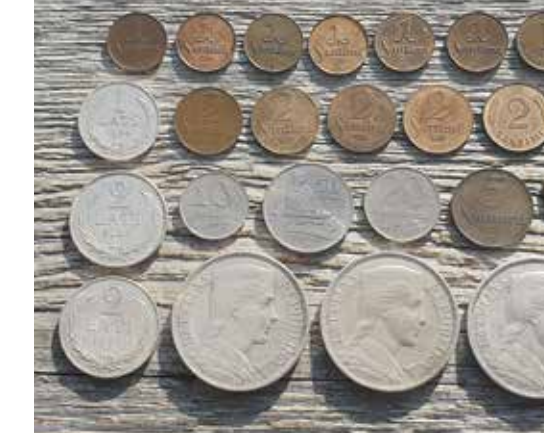
Jura Vilsona kolekcijā ir pilns Latvijas Republikas starpkaru perioda apgrozības monētu komplekts.