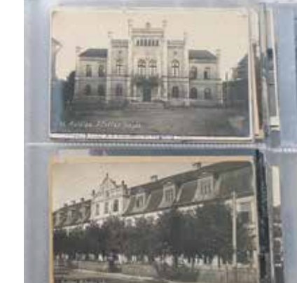
Kolekciju ar senajām fotokartītēm ar Kuldīgas un tās apkārtnes skatiem kolekcionārs glabā fotoalbumā.