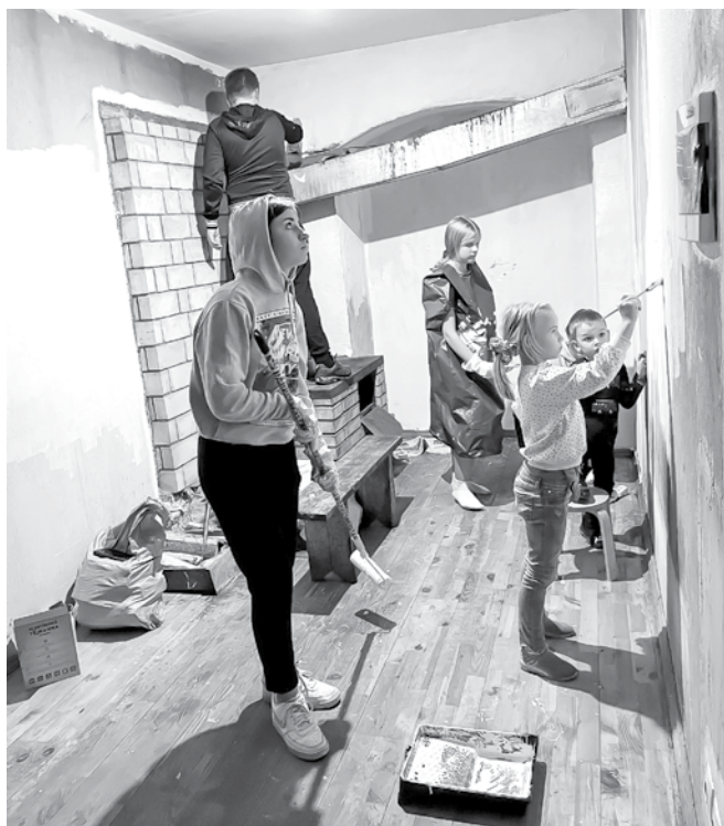
Jauniešu telpa procesā – tiek krāsotas sienas, iesaistās dažāda vecuma bērni un jaunieši no Ēdoles.